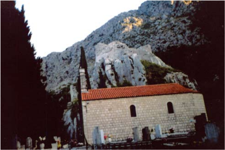
Sokol uz crkvu Male Gospe i groblje

navedenih poslova od strane ovlaštenih nadstojnika koje bi imenovali Rektor i Malo vijeće Republike.