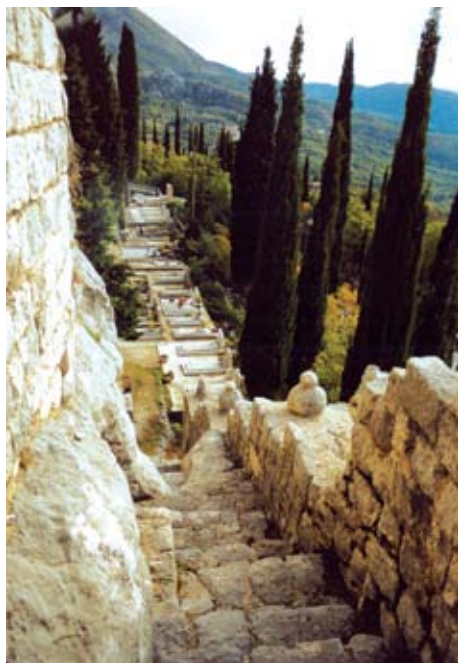
Pogled s tvrđave na jedini ulaz i mjesno groblje

Položaj tvrđave sugerira postojanje utvrde na istom mjestu još iz vremena Ilira, Grka i Rimljana o čemu svjedoče ostaci keramike i rimske cigle nađeni u zidinama tvrđave. No, konačan oblik i dimenzije Sokol dobiva u vrijeme Dubrovačke Republike nakon kupnje istočnog dijela Konavala 1419. godine od bosanskog feudalca, vojvode Sandalja Hranića. Koliko je ta kupnja značila Dubrovčanima svjedoči činjenica da je Sandalj Hranić dobio za nagradu pravo građanstva Dubrovačke Republike i bio primljen u redove dubrovačke vlastele što se smatralo posebnom privilegijom, te mu je sagrađena palača u samom centru Grada.