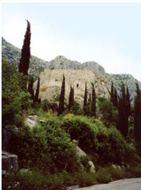
Sokol u svojoj ljepoti okoliša

Spominje se prvi put 1391. u Dubrovačkom arhivu.