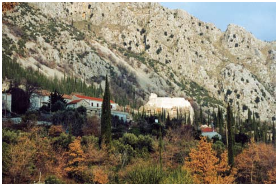
Sokol uz obližnje kuće Valjalo

U njoj je bio kapelan s posadom od 10 ljudi, a kompletan broj prve posade iznosio je 17 osoba (kaštelan, kapelan, skladištar, 10+4 vojnika, stražari i samostrjelci).