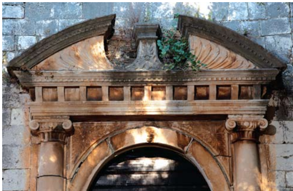
Portal dominikanske crkve sv. Marka u Hvaru, rad Trifuna Bokanića