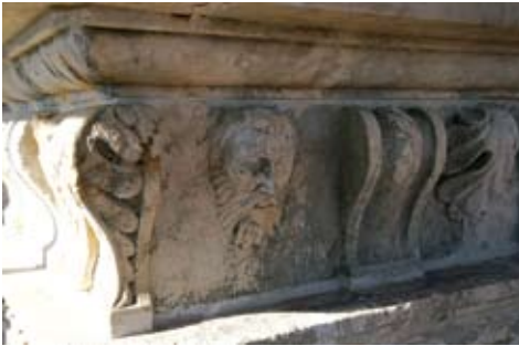
Trifun Bokanić, metope vijenca zvonika trogirске katedrale s muškom glavom i floralni motivima