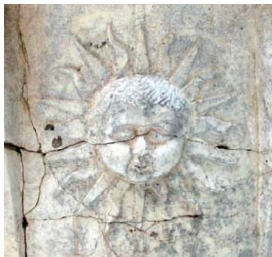
Detalj s krune bunara palače Lucić u Trogiru

Fontika kao ulaza na planirani kat. Venier spominje da se u vrijeme njegova izvještaja grade još dva luka za dovršetak polovice gradnje. Jasno da je zahvat gradu morao biti izuzetno značajan i prije Semitecolova pothvata jer se iznimno skupa gradnja lukova kao priprema za tu investiciju ne bi izvodila samo radi skladištenja baškota za što je kat Arsenala uz ostalo služio u vrijeme kneza Contarinija. 39