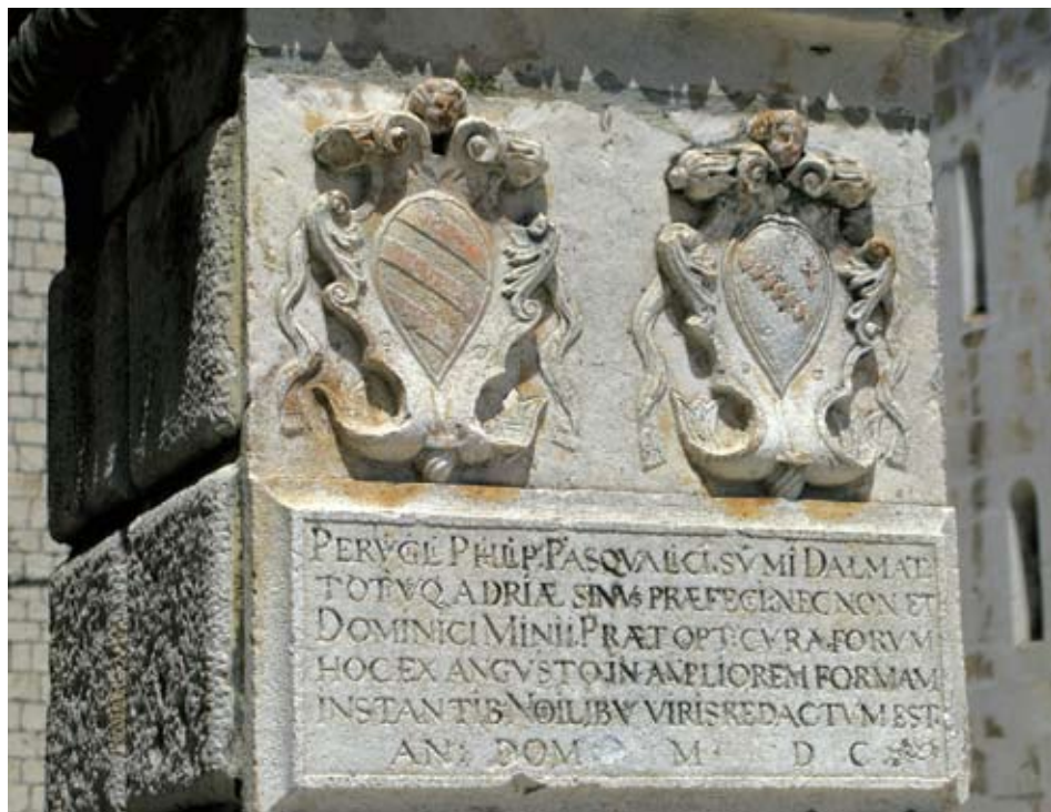
Spomenik kneza Dominika Minija na glavnom gradskom trgu Trogira

PERVGLI PHILIP PASQUALICI SVMI DALMATI TOTIVS Q ADRIAE SINVS PRAEFECI NEC NON ET DOMINCI MINII PREAT OPT CVRA FORVM HOC EX ANGVSTO IN AMPLIOREM FORMAM INSTANTIB NOBILIBV VIRIS REDACTVM EST AN DOM MDC 19