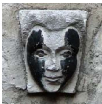
Uzidana ženska glava u dvorištu palače Lucić u Trogiru

LVCIA GENS TENVIT PRIMVM MODO LVCIA SERVAT LVCIA ME SVPERVMNVTV PER SAECVLA SERVET M D C 20