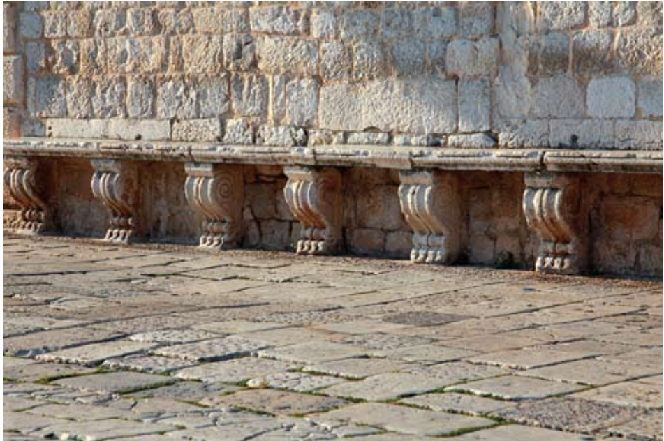
Fontik na hvarskom trgu. Klupa na povijenim izduženim konzolama