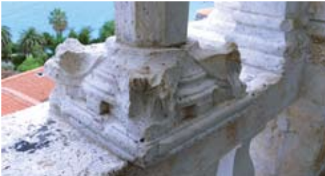
Zvonik trogirске katedrale. Reutilizirani kapitel Bokanićeve radionice upotrebljen kao baza stupa lože zvonika