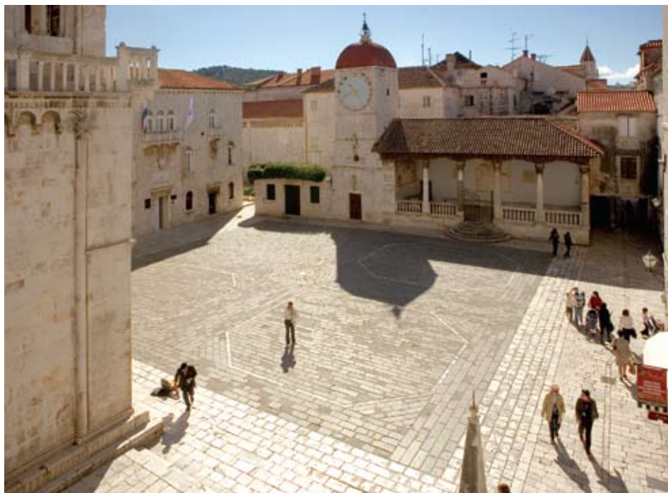
Glavni gradski trg u Trogiru

Obitelj su proslavili brojni ugledni članovi, svećenici, redovnici i političari, a nadasve graditelji među kojima je najznamenitiji Trifun (1575. – 1609.), arhitekt i kipar, koji je za kratkog života od svega trideset i četiri godine ostavio izuzetno bogat opus. Zvonici i gradske lože Trogira i Hvara, oltari Hvara i Zadra, obnove njihovih katedrala i trgova, djela su koja ovog majstora svrstavaju među najveće graditelje svog vremena. U Trifunovoj produkciji sudjelovala je čitava obitelj Bokanić koja je odigrala značajnu ulogu u ostvarenjima brojnih zahtjevnih graditeljskih pothvata Srednje Dalmacije na prelasku 16. u 17. stoljeće. Pored Trifuna, istaknuti njeni članovi naraštajima se spominju u dokumentima vezanima uz građenje. Njegov otac Jerolim Bokanić djeluje u 16. st. zajedno s braćom i rođacima Vickom, Petrom, Šimunom i Stjepanom, a u 17. st., uz Šimuna i Stjepana, spominje se i Ivan koji gradi na zvoniku bolske dominikanske crkve. 2 U vrijeme gradnje spliskih utvrda 1664. godine, među pučiškim majstorima graditeljima i klesarima spominje se Nikola i Vicko Bokanić te Petar Puljezić. 3