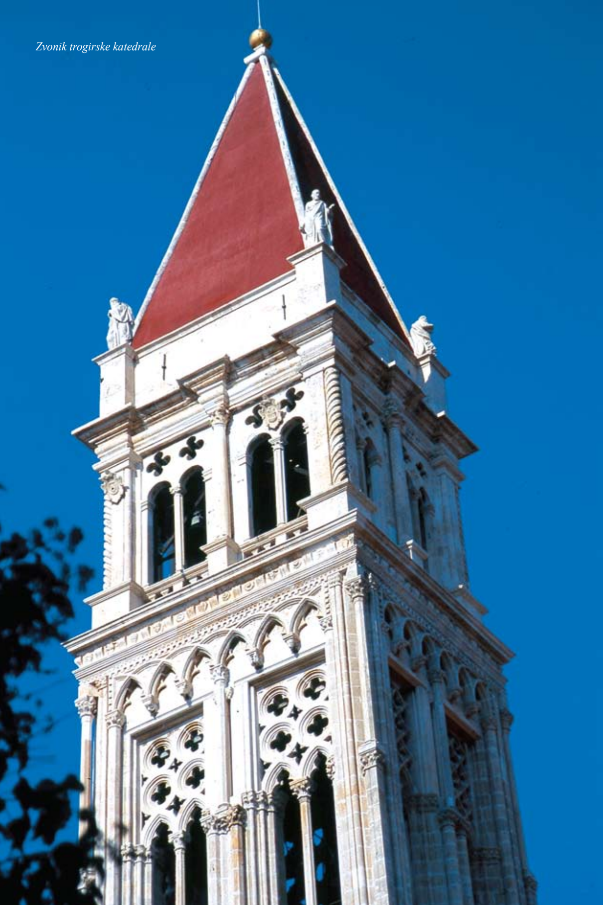
Zvonik trogirске katedrale