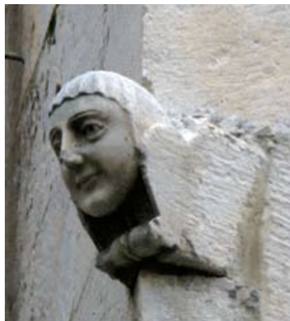
Uzidana ženska glava na pročelju zvonika sv. Nikole

DOMINICO.MINIO.PRAET.CIVES.TR.G PERPETVAE.MEMORIAE.AC.DEVOTIONIS SIGNVM. EREXERVNT M.D.C.I 13