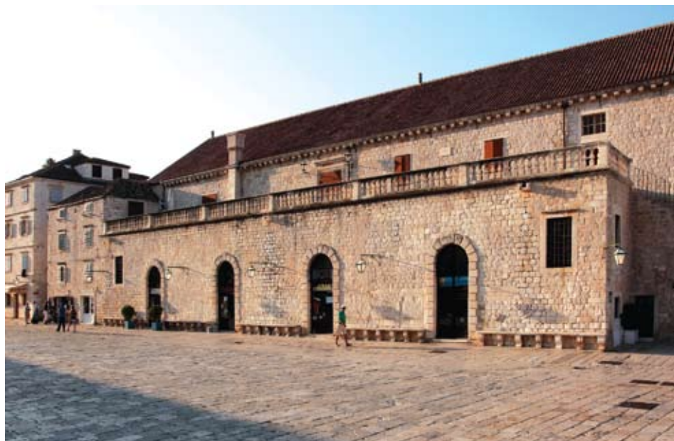
Fontik uz hvarski Arsenal

Nasuprot Gradskoj loži u hvarskoj luci nalazi se zgrada Arsenala. Sagrađena je u 16. st., na mjestu ranijeg velikog arsenala koji je stradao za napada Osmanlija predvođenih turskim potkraljem Alžira Uluz-Alijem 1571. godine. 36 Njegova je obnova trajala sve do početka 17. st., a radovi su bili završeni 1607. godine, kako piše u svom pismu hvarski knez Stjepan Tiepolo mletačkoj vladi. 37 Pa i nakon toga Arsenal je bio dograđivan. Natpis na njegovim istočnim vratima spominje 1611. godinu: