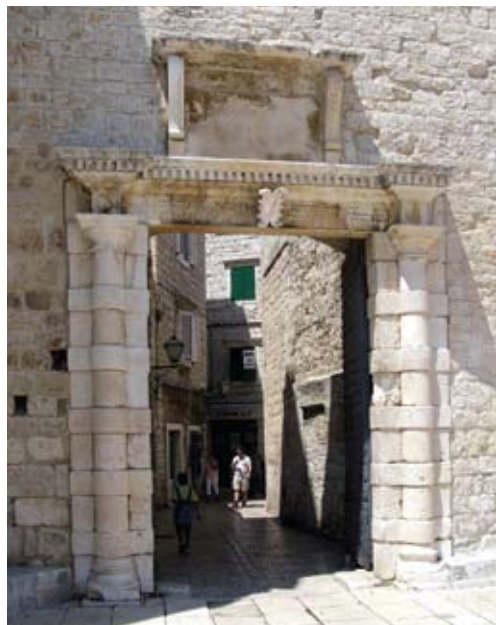
Trogir. Južna gradska vrata, rad Bokanićeve radionice.

Arhitekturu zvonika određuje karakteristična osmerokutna loža zvonika zatvorena u tradiciji benediktinske klauzure ažuriranim kamenim pločama koje se doimaju poput orijentalnih ukrasa. Na pročelju zvonika uzidana je ženska glava, svojevrstan Sanmichelijevski potpis Bokanića, kakve je kipar ugrađivao u zaglavlja lukova oltara i prozora. Na četiri ugla kamenog vijenca lože izrađene su kasno-renesansne fiale, konične izdužene piramide koje podsjećaju na malene obeliske. Taj je arhitektonski dekorativni element Trifun Bokanić često koristio, primjerice čitav niz takvih fiala ritmiziraju pročelje gradske lože u Hvaru koju je Cvito Fisković pripisao Trifunu Bokaniću. 17 Na trogirskom je trgu, pred velikom palačom Cipiko, piramidom u obliku obeliska Bokanić obilježio uređenje gradskog trga dovršena 1600. godine u vrijeme gradskog kneza Dominika Minija. Podignuta je na spomen nove urbanističke regulacije proširene na prostor pred katedralom gdje je srušena općinska kuća u kojoj su se nalazili Fontik i skladište soli, ali i ljekarna i gramatička škola. 18 Preuređenje trogirskog trga 1600. godine potvrđuje natpis pod piramidom: