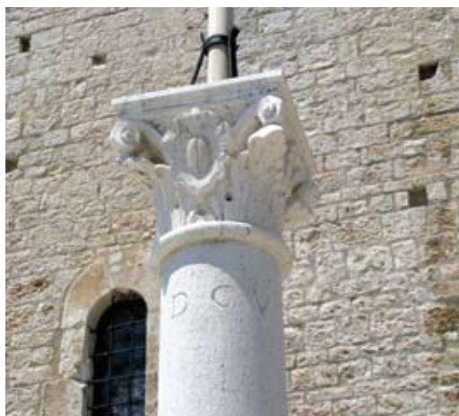
Kapitel šandarca zastave u trogirskoj luci

U dvorištu Lucićeve palače stupovlje atrija, trifora s kapitelima all' antica , piramidalne konzole pod vijencem, balustrada, te brojni drugi građevni djelovi ukazuju na djelovanje Bokanićeve radionice. Njoj se može pripisati i kruna bunara s Lucićevim grbom te karakterističnim licem ovjenčanim zrakama, standardnim dekorativnim elementom radionice.