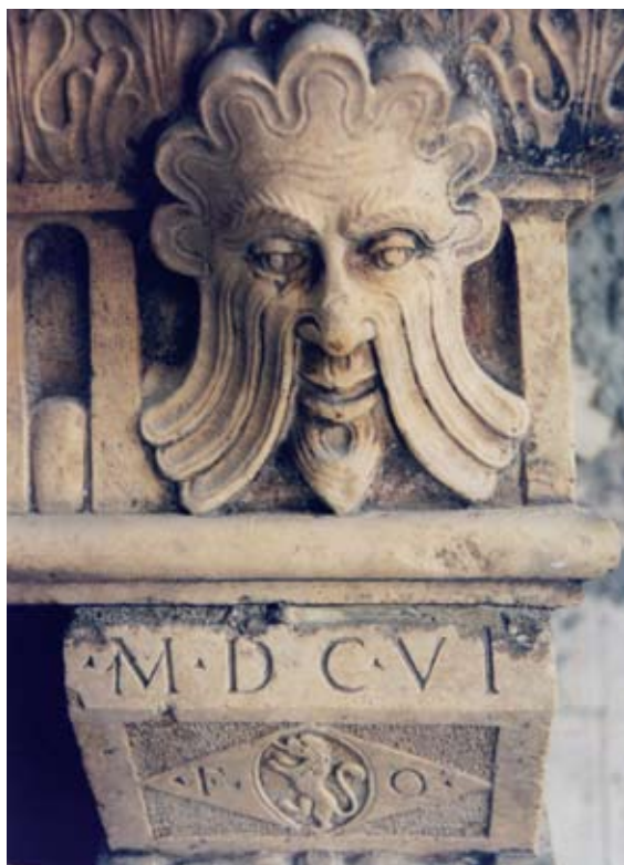
Kamin kuće Kvarko u Trogiru, glava maskerona

Kamin je, prema natpisu, izrađen tri godine nakon dovršetka zvonika stolnice pa se ne može dovoditi u vezu Kvarkovo obnašanje dužnosti operarija katedrale u vrijeme podizanja zvonika katedrale s izradom kamina. Upravo suprotno, kamin je dokaz Bokanićeva stalnog boravka i djelovanja u Trogiru gdje je, trajno se nastanivši, postao njegovim građaninom.