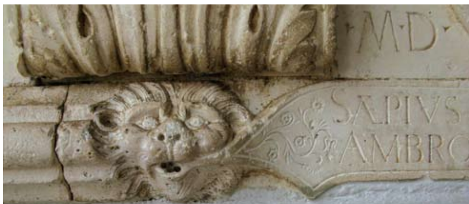
Trogirska gradska loža, lavlja glavica uz natpis, rad Trifuna Bokanića

Za istog kneza, godinu dana poslije, 1606. godine, Trifun Bokanić je obnovio trogirsku gradsku ložu. 22 Njegova su djela klupe uz istočni i južni njezin zid i kameni sudački stol, ukrašen grbovima kneza Ambroza Cornara i grada Trogira, isklesanim na volutama njegovih masivnih kamenih nogu te raskošno ukrašeni kameni grbovi obješeni uz Firentinčev reljef Justicije. Spomen na obnovu zabilježen je natpisom pod retablom Pravde na istočnom zidu lože. Natpis je uklesan na vrpci koja je razapeta između dviju tipičnih bokanićevskih lavljih glavica.