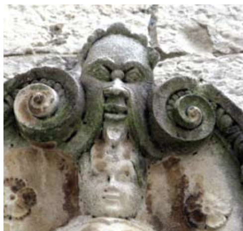
Grb gradskog kneza Dominika Contarinija, detalj

često koristi kao dekorativni element. Nalazimo ga tako na vijencu zvonika trogirске katedrale, na kaminu kuće Kvarko i brojnim drugim primjerima. Ispod Contarinijeva grba je nadvratnik nekadašnjeg ulaza u vijećnicu s natpisom: