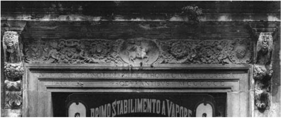
Crkva sv. Šimuna u Zadru, nadvoj ulaznih vrata i prozor na pročelju crkve