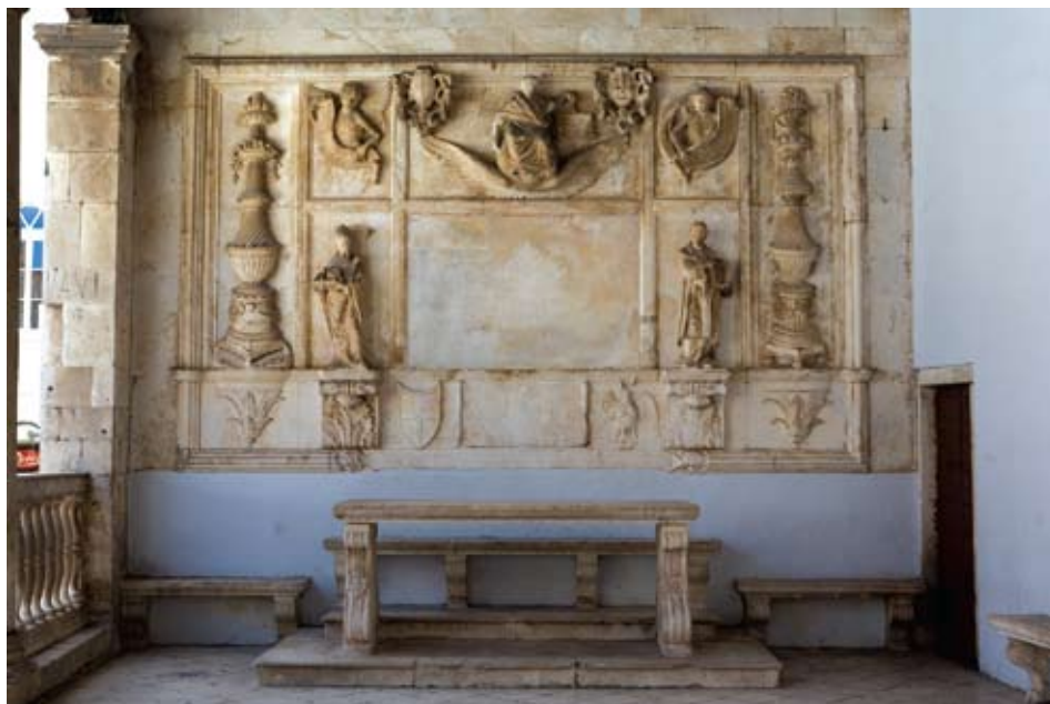
Gradska loža u Trogiru, retabl Pravde Nikole Firentinca s grbovima grada i gradskog kneza, rad Trifuna Bokanića

Za istog kneza, godinu dana poslije, 1606. godine, Trifun Bokanić je obnovio trogirsku gradsku ložu. 22 Njegova su djela klupe uz istočni i južni njezin zid i kameni sudački stol, ukrašen grbovima kneza Ambroza Cornara i grada Trogira, isklesanim na volutama njegovih masivnih kamenih nogu te raskošno ukrašeni kameni grbovi obješeni uz Firentinčev reljef Justicije. Spomen na obnovu zabilježen je natpisom pod retablom Pravde na istočnom zidu lože. Natpis je uklesan na vrpci koja je razapeta između dviju tipičnih bokanićevskih lavljih glavica.