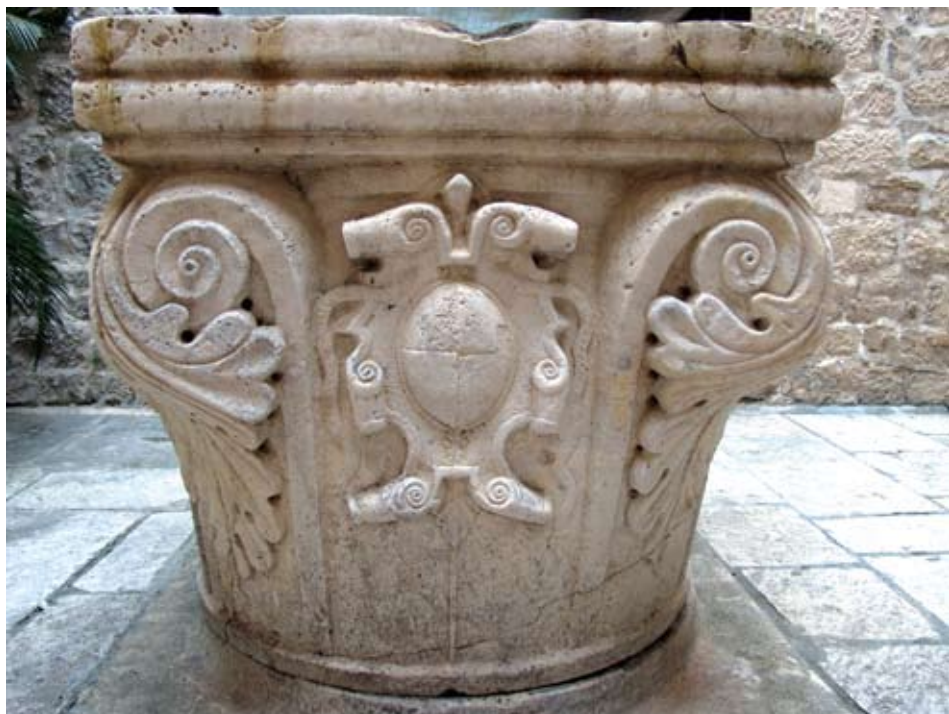
Kruna bunara palače Lucić u Trogiru