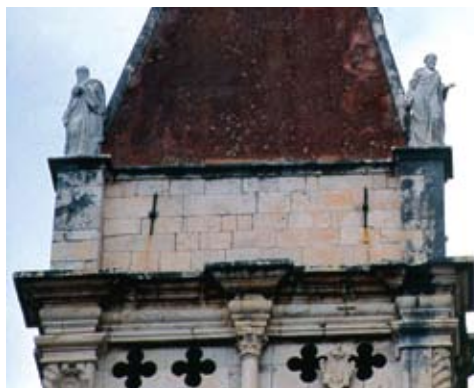
Atika zvonika s kipovima Alessandra Vittorije nakon obnove koncem 17. st.

girskom vijeću novo rješenje, možda drveni model njihova prijedloga završetka zvonika, koje su ponudili umjesto ranije izrađena projekta. Po tom je novom prijedlogu zvonik dovršio Trifun Bokanić 1603. godine. 7 Njegov se izvedbeni nacrt za gradnju lože zvonika u mjerilu 1:1 nalazi ugraviran na popločanju poda južne lože katedrale. 8 Nacrt prikazuje vrh zvonika, potpuno drugačiji od današnjeg, za kojega se pogrešno smatralo da je Bokanićevo djelo. Današnji je izgled zvonik dobio u drugoj polovici 17. st. u pregradnji nakon rušenja vrha koji je stradao