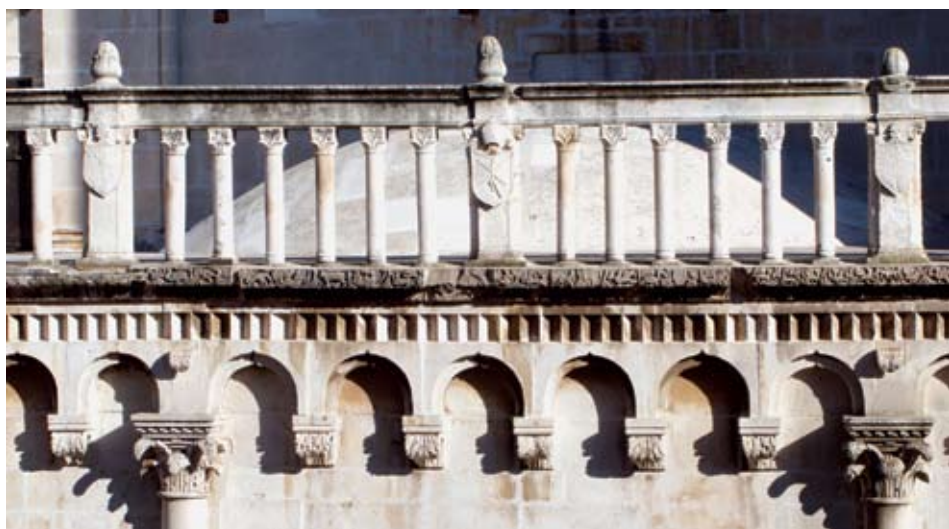
Renesansna ograda nad atrijem trogirске katedrale iz polovine 16. st

zbog udara groma 14. travnja 1653. godine. 9 Zbog toga su kod popravka njegove piramide ugrađene moći sv. Barbare smještene u olovnom relikvijaru unutar akroterija zvonika. Natpis na relikvijaru uz godinu 1669. sadrži i inicijale MZG što bi se moglo dovesti u vezu s obnovom za biskupa Ivana Pavla Garzona (1663. – 1676.). 10 Cvito Fisković, koji hvaleći vještinu Bokanića i njegov uspjeh u usklađenosti starijeg dijela zvonika i njegova