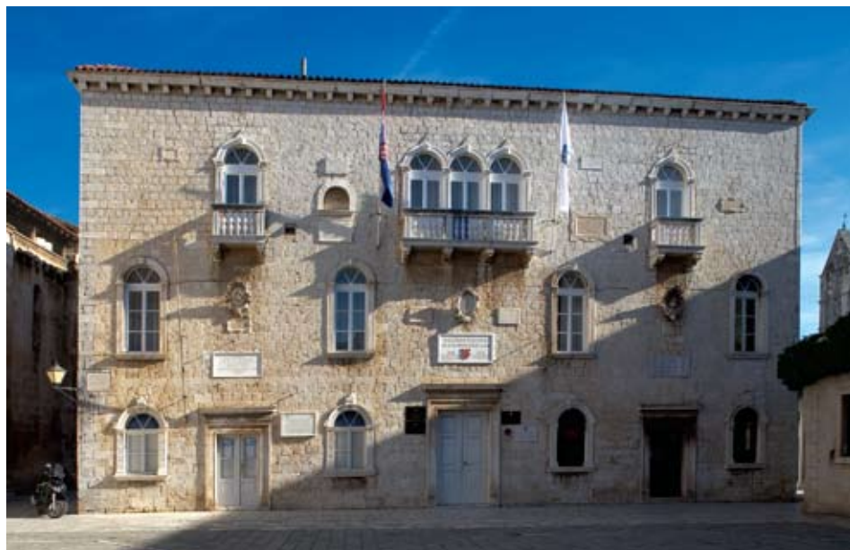
Trogir, komunalna palača, zapadno pročelje

krilati anđelčići u pokretu, poigravajući se volutama njegova raskošna okvira. Donji dio grba završava girlandama lovora i voća ovješeno s obje strane grotesknog maskerona. Izvrstan klesarski i kiparski rad djelo je vrsnog klesara i kipara, a ornamenti karakteristični za Bokanićev repertoar upućuju na Trifuna kojemu bi to bio jedan od zrelih radova. Spomen na zahvat ispisan na mramornoj ploči datiran je 1608. godinom: