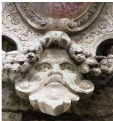
Grb gradskog kneza Morosinija, detalj