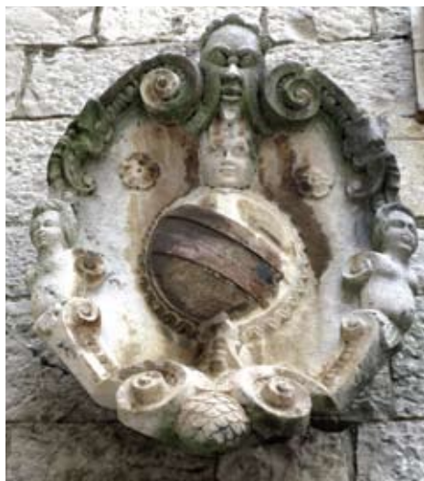
Grb gradskog kneza Dominika Contarinija iz 1609. u atriju trogirске komunalne palače