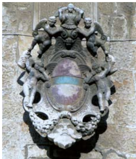
Komunalna palača u Trogiru, grb kneza Morosinija