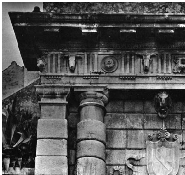
Michele Sanmicheli, Kopnena vrata grada Zadra