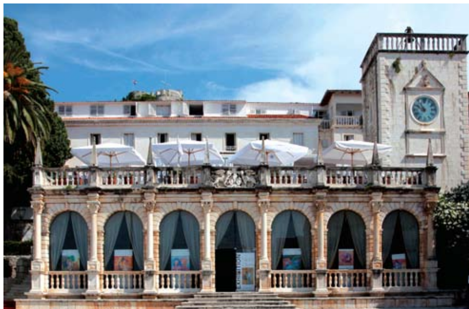
Gradska loža u Hvaru

sve dok je Cvito Fisković, uspoređujući hvarske dokumente, nije povezo s opusom Trifuna Bokanića. 32