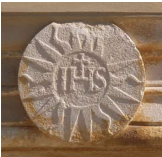
Detalj nadvratnika portala cke bolskog dominikanskog samostana