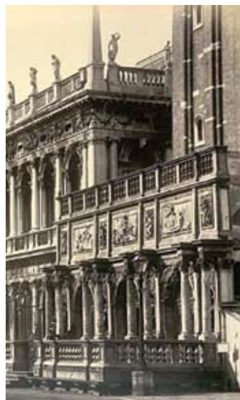
Jacopo Sansovino, loggetta, Venecija