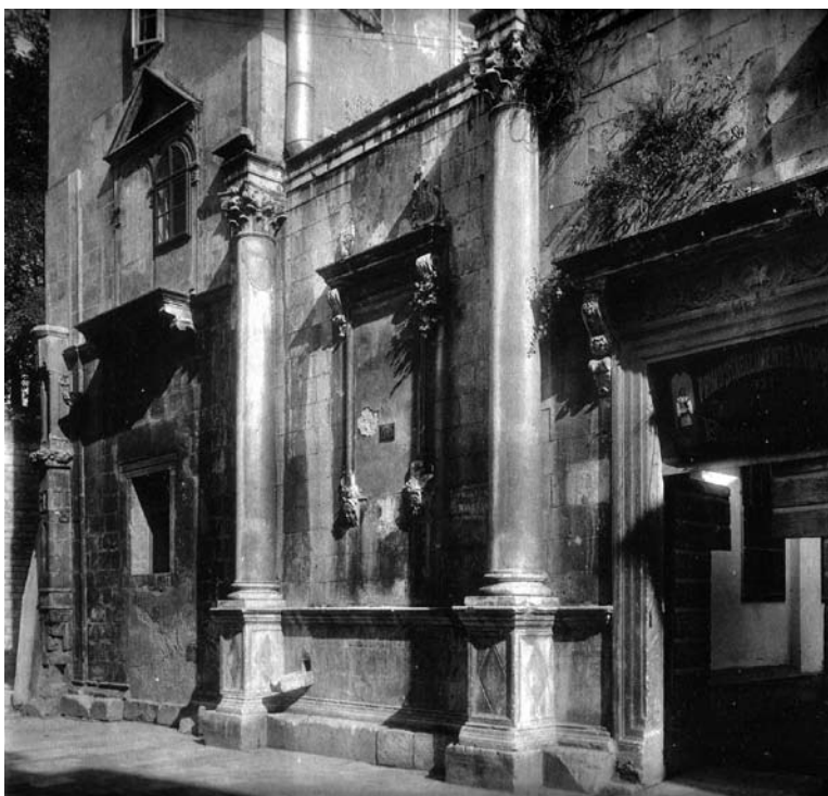
Pročelje nedovršene crkve sv. Šimuna u Zadru