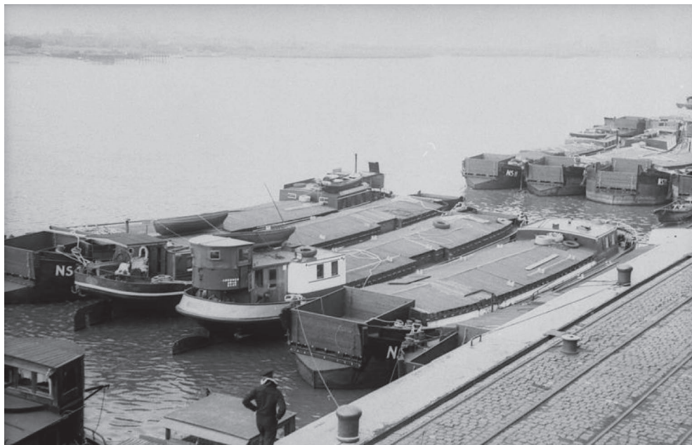
Slika 2: Njemački riječni brodovi prikupljeni u luci Wilhelmshaven, 1940. godine.