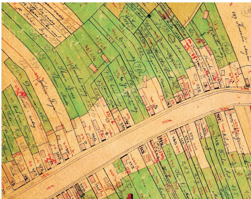
Slika 2. Dio indikacijske skice prije komasacije.