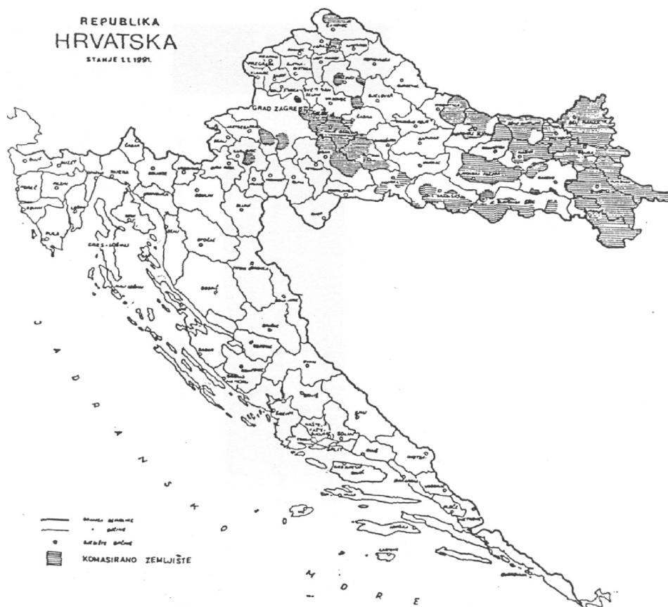
Slika 1. Područja Republike Hrvatske gdje je provedena komasacija.

bližno postigao cilj okrupnjavanja obiteljskih poljoprivrednih gospodarstava kakav je postignut u većini europskih zemalja. U tom su razdoblju veća okrupnjavanja zemljišta ostvarile društvene poljoprivredne organizacije, koje su uglavnom i pokretale komasacije zemljišta u skladu s tadašnjim društvenim uređenjem. Kako je zemljište bivših poljoprivrednih kombinata postalo državno nakon osamostaljenja i promjene društvenog uređenja u Republici Hrvatskoj, znači da danas država raspolaže najvećim česticama poljoprivrednog zemljišta. Takvog zemljišta ima najviše na području Slavonije, gdje je i provedena većina komasacija, a država danas daje to zemljište u zakup zainteresiranim poljoprivrednicima (slika 1). Zbog toga se može reći da je problem okrupnjavanja najmanje izražen u Slavoniji jer poljoprivrednici mogu unajmljivanjem velikih kompleksa državnog zemljišta povećati poljoprivrednu proizvodnju. Najveći problemi s usitnjenošću poljoprivrednih gospodarstava postoje u sjeverozapadnoj Hrvatskoj, pa tako u Međimurju postoje domaćinstva koja imaju i desetke katastarskih čestica, naravno vrlo malih površina.