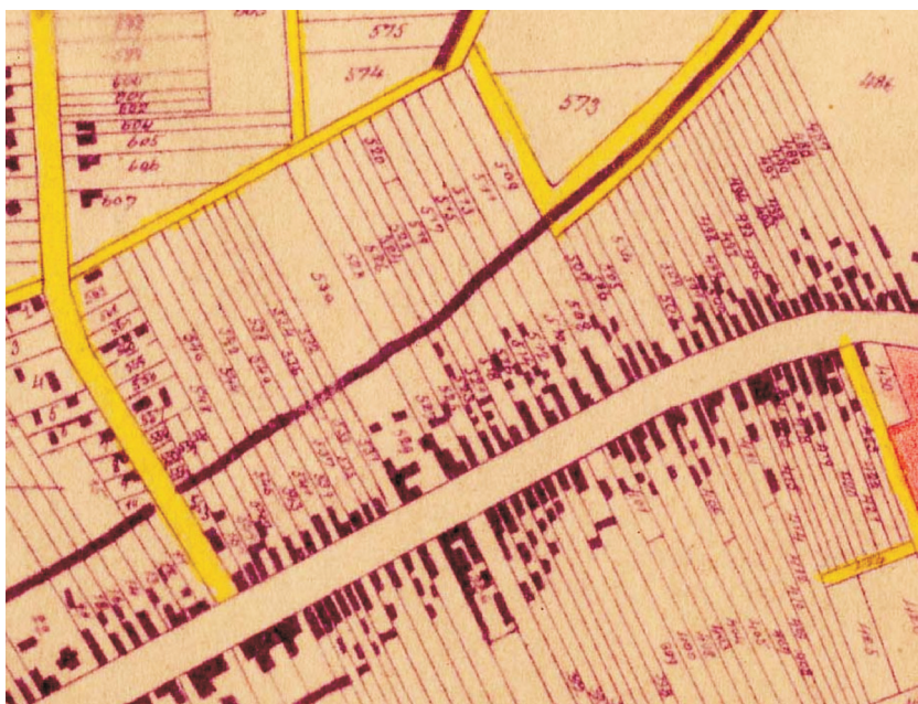
Slika 3. Dio pregledne skice nakon komasacije.