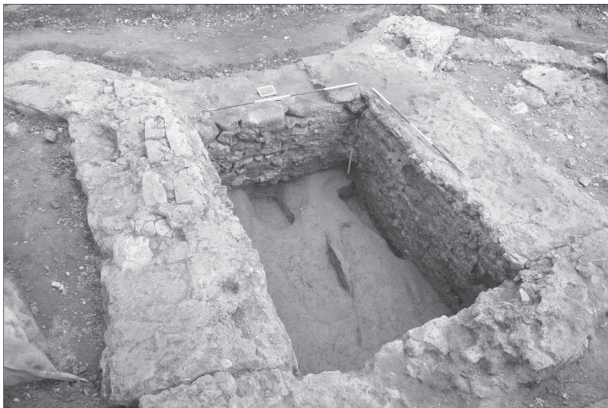
Sl. 1 Crkvari-Sv. Lovro, pogled na istraživanu površinu 2009. g..