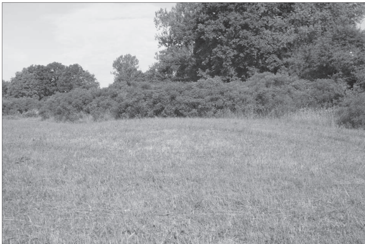
Sl. 1 Glavičice – tumul 8 prije istraživanja.

Fig. 1 Glavičice – tumulus 8 before excavations.