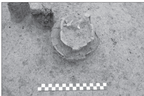
Sl. 2 Šalica u grobu 1 tumula 8.

Ispod gornjeg nasipa tumula, gotovo u njegovoj sredini, pronađen je grob sa spaljenim ostacima pokojnice – grob T. 8/1, koji su položeni na hrpicu na kojoj se nalaze i brojni ulomci brončanih predmeta, što su kao dio njezine nošnje spaljeni s njom. Ipak, prepoznaju se ulomci fibule te vjerojatno dijelovi brončanih narukvica/nanogvica kao i male zakovice s polukuglastom glavicom. U središtu hrpice nalazi se vrč s ručkom te s okomitim kaneliranim trbuhom (sl. 2). Ispod donjeg nasipa tumula od sivosmeđe zemlje, također gotovo u središnjem dijelu, pronađen je grob sa spaljenim ostacima pokojnika – grob T. 8/2. Hrpica spaljenih ostataka pokojnika dosta je kompaktna i protezala se u smjeru JZ – SI, što ukazuje kako je vjerojatno bila položena u tkaninu ili kožu (sl. 3). S južne strane kostiju pronađena je veća brončana igla s poprečno ukrašenim vratom te s manjim profilacijama na vrhu, koja je možda zatvarala organski materijal u kojem su se spaljene kosti nalazile. Sa spalje-