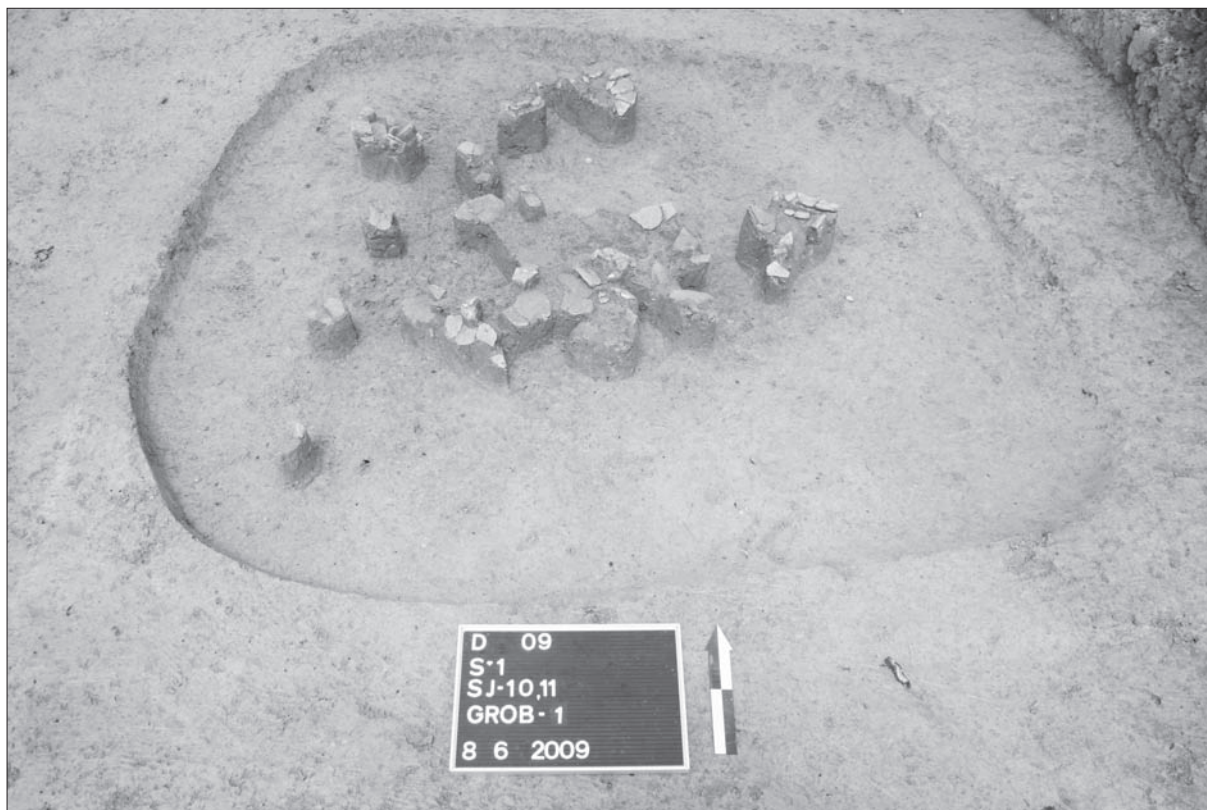
Sl. 4 Draganje – grob 1.