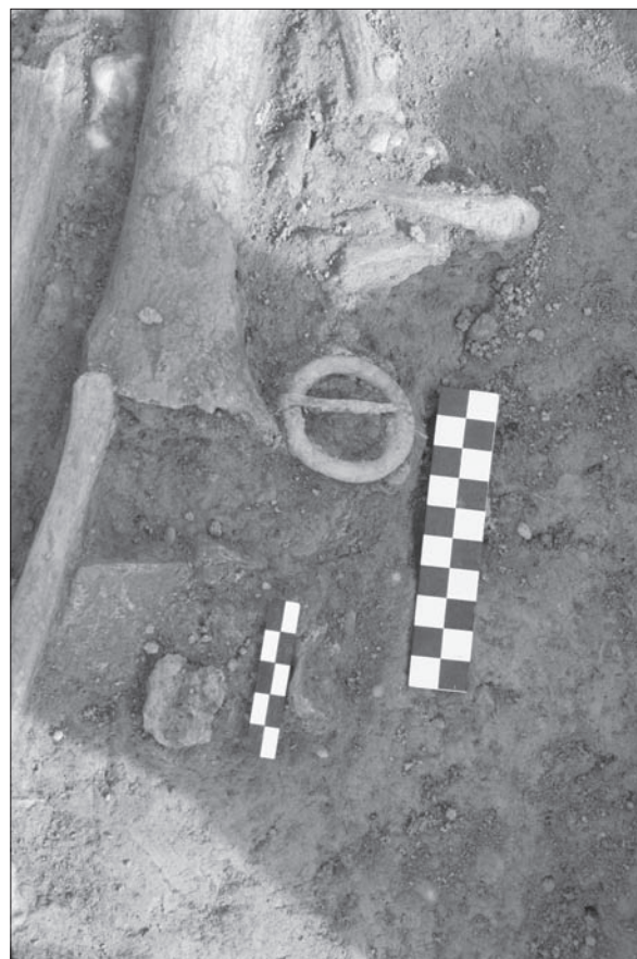
Sl. 1 PN 31 i PN 32 in situ u G 37.

Grob je smješten u □ I 10, sjeverno od G 33. Ukop i zapuna groba nisu vidljivi, tj zapuna je ista kao i okolni sloj SJ 004 u koji je grob ukopan. Kostur je dosta loše očuvan. Duljina kostura iznosi 132 cm. S južne strane presjekao ga je G 34. Visina fragmenta lubanje je 128,71 m, lijevog ramena 128,76 m, a lijeve natkoljenice (koljeno) 128,73 m. Dno groba kod lijevog ramena je na visini 128,72 m, a kod koljena na 128,69 m. U grobu nisu pronađeni nalazi.