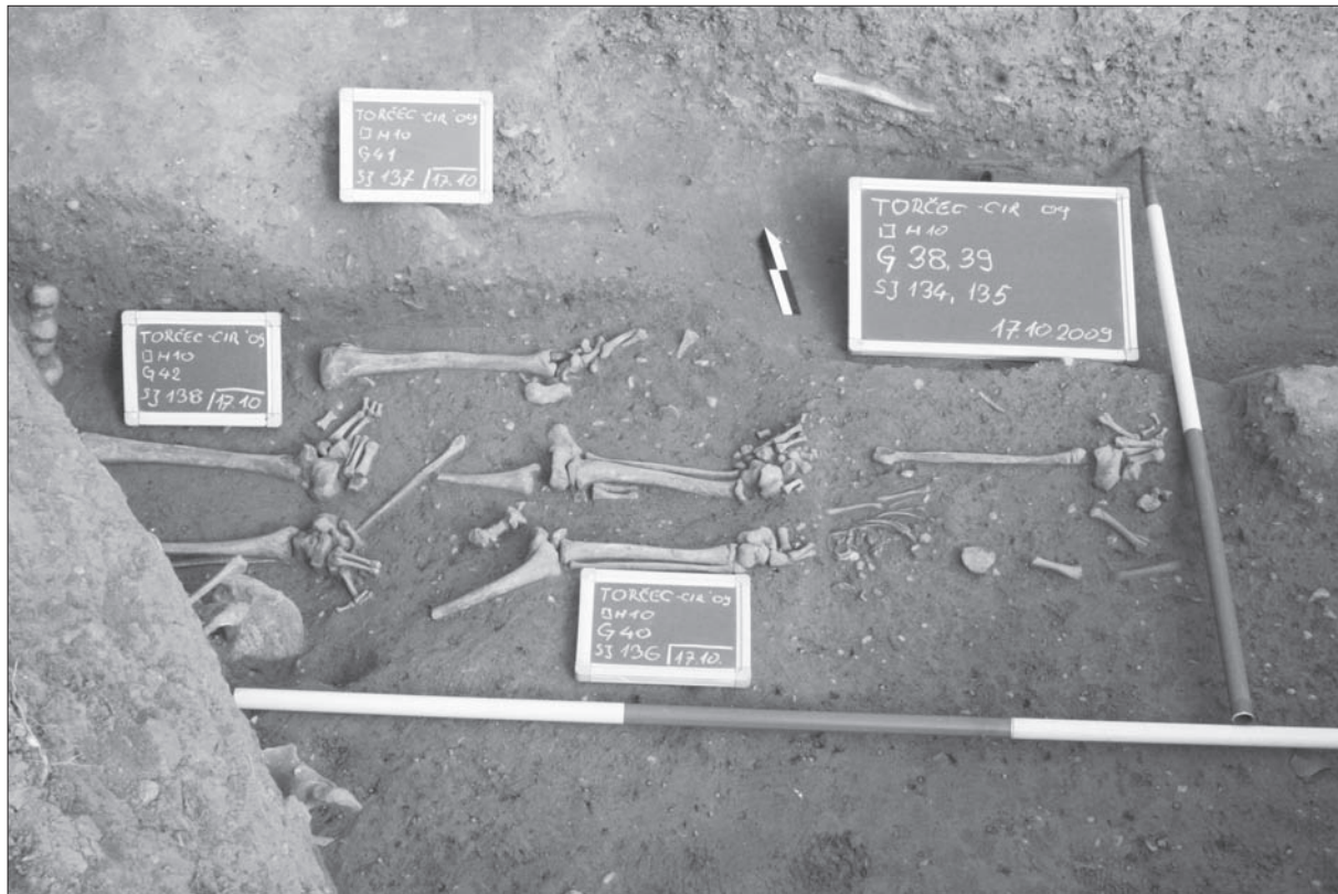
Sl. 2 Grobovi 38 – 42.