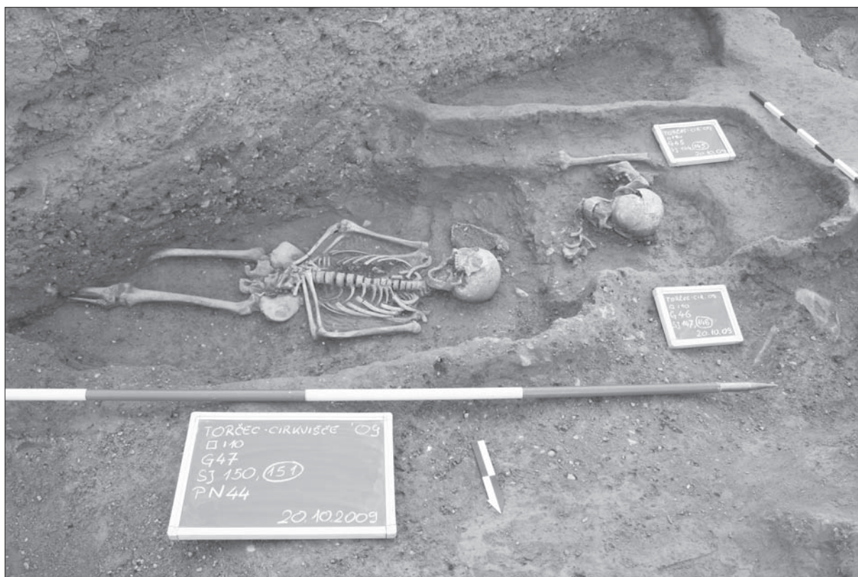
Sl. 3 Grobovi 45 – 47.