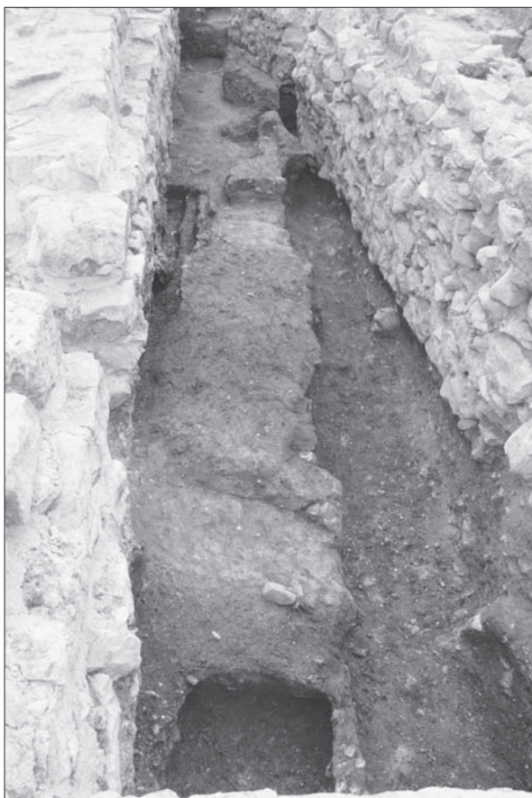
Sl. 3 Ostaci smeđeg sloja u južnom dijelu sektora Sjeverno od broda.