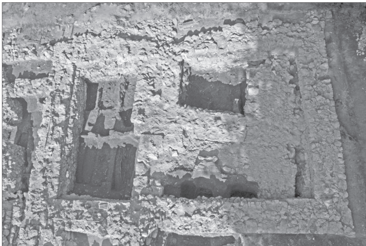
Sl. 1 Pogled s istoka na istraživanu kulu.