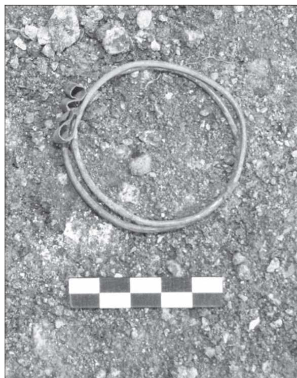
Sl. 2 S-karičice iz groba 262 (PN-515).

Zanimljivo je primijetiti da u ovogodišnjoj kampanji nisu