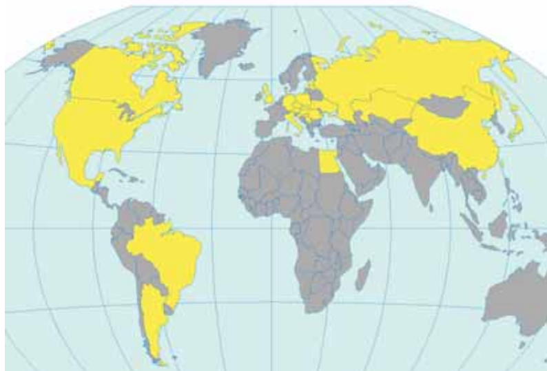
Fig. 1. Authors from countries coloured in yellow participated on the 14th International Conference on Geometry and Graphics in Kyoto

Glavne teme konferencije bile su teoretska i primjenjena grafika i geometrija, inženjerska računalna grafika te obrazovanje u geometriji i grafici. Međutim, na konferenciji se mogu prezentirati i drugi radovi koji su vezani uz geometriju i grafiku, kao što primjerice povijest geometrije i grafike ili umjetnost koja je povezana uz geometriju i grafiku. Teme zahvaćaju široko područje istraživanja i primjene geometrije i grafike što se lijepo vidi ako se pogledaju pojedina područja unutar glavnih tema kao što su: geometrija krivulja i ploha, kinematička geometrija, deskriptivna geometrija, računalom podržana geometrija, modeliranje objekata, primjena geometrije u umjetnosti, znanosti, arhitekturi i inženjerstvu, računalne