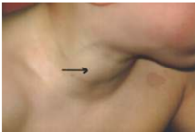
Slika 1. Nabreknuće vrata desno Flebektazija desne unutarnje jugularne vene Picture 1. Swelling on the right side of the neck Right internal jugular vein phlebectasia

pluća uredan. Ezofagogram uredan. Elektrokardiogram i ultrazvuk srca uredan. Ultrazvuk štitnjače uredan. Fiberskopija larinksa i traheobronhoskopija uredan nalaz.