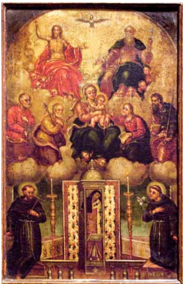
6. Sv. Spiridon s Bogorodicom, svecima i Svetim Trojstvom, ulje na platnu, 39,5 x 63,5 cm, Samostan sv. Nikole, Trogir St Spyridon with the Virgin, Saints and Holy Trinity, oil on canvas, 39.5 x 63.5 cm, Monastery of St Nicholas, Trogir

crkvenom koncilu u Niceji. 26 Po mojem mišljenju upravo su razlozi njihova sudjelovanja na tom koncilu i uvjerenja koja su tu branili osnovna poveznica svih prikazanih ličnosti na ovoj ikoni. Nastup sv. Spiridona i sv. Nikole na nicejskom koncilu označava otpor prema Arijevom učenju i čvrsto zastupanje dogme o Svetome Trojstvu. U širem smislu time se simbolizira čvrstina vjere u temeljnu kršćansku dogmu. Upravo to s njima povezuje i trećega svetog biskupa – sv. Atanazija Velikog (Aleksandrijskog). I on je njihov suvremenik 27 i kao predstavnik Aleksandrijske patrijaršije također je sudjelovao na spomenutom koncilu u Niceji. U raspravama o Arijevom učenju i on je bio jedan od utjecajnih i žestokih sudionika koji mu se suprotstavio i osudio njegovo krivovjerje, te tako dobiva značenje branitelja kršćanske dogme o Sv. Trojstvu.