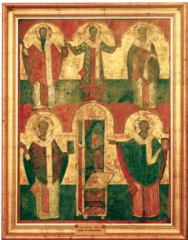
1. Grob sv. Spiridona sa svecima, tempera na dasci, pozlata, 67 x 50 cm, Pinakoteka Župe sv. Nikole u Cavtatu Tomb of St Spyridon with Saints, tempera on panel, gilt, 67 x 50 cm, Picture Collection of the Parish of St Nicholas in Cavtat