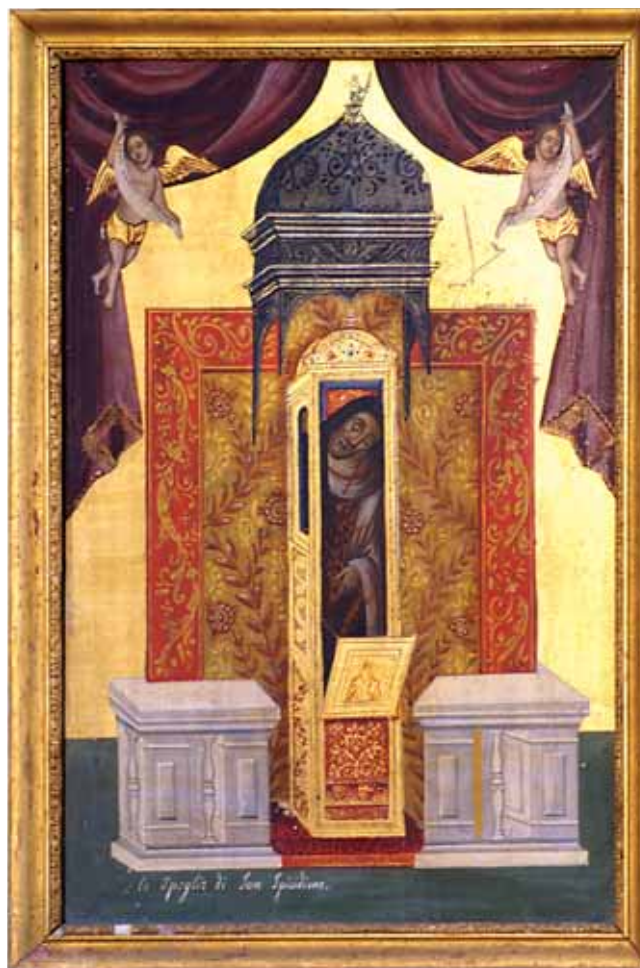
3. Grob sv. Spiridona, tempera na dasci, pozlata, 42 x 59,7 cm, Crkva Gospe od Ružarija u Vignju Tomb of St Spyridon, tempera on panel, gilt, 42 x 59.7 cm, Church of Our Lady of the Rosary in Viganj

Odgovori na pitanja o porijeklu ikonografije Spiridonova groba i razlozima njezina nastajanja mogu se pronaći upravo u osobinama i značenju sveca kojemu je dano središnje mjesto u ovoj kompoziciji. Sv. Spiridon 15 sveti je biskup iz Tremitona na Cipru koji je živio krajem 3. i u prvoj polovici 4. stoljeća. Njegova popularnost može se objasniti s jedne strane brojnim legendama o čudotvornim moćima koje je posjedovao i kojima je pomagao onima u nevolji, 16 a s druge strane činjenicom da je bio biskup iz naroda obdaren sposobnošću jednostavnog tumačenja vjere u Krista. U ličnosti sv. Spiridona povezana je jednostavnost skromnog pastirskog porijekla, duboka religioznost običnog malog čovjeka, ali istovremeno i izuzetno poznavanje teološke misli. Sve to pridonosi jačanju njegove popularnosti, a sv. Spiridon zadobiva višestruko značenje u vjeri puka istočnog Mediterana, ne samo pravoslavaca, nego i katolika. Postao je zaštitnikom seljaka, pastira i maslinara, čak i pomoraca. Istovremeno, zbog sudjelovanja na Prvom ekumenskom koncilu, gdje je vatreno branio pravovjerna crkvena učenja, 17 sv. Spiridon postaje i simbolom borbe Crkve protiv hereze i čvrstine vjere u kršćansku dogmu o Svetom Trojstvu.