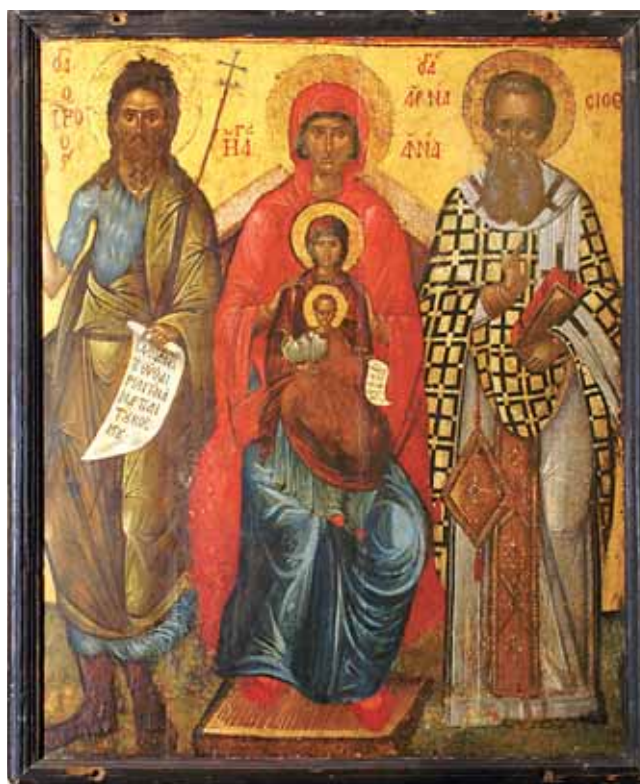
7. Sv. Ana s Bogorodicom i Kristom i sv. Ivanom Krstiteljem i Atanazijem Aleksandrijskim, tempera na dasci, 83,8 x 100,5 cm, Zbirka ikona Bratovštine Svih svetih u Korčuli

Dok, kao što vidimo, zajednički prikazi sv. Spiridona i sv. Nikole nisu rijetki, primjera zajedničkog prikazivanja sv. Spiridona ili groba sv. Spiridona sa sv. Atanazijem Velikim na našim prostorima, koliko mi je poznato, nema. Ipak, jedna ikona iz zbirke Bratovštine svih svetih u Korčuli prikazuje sv. Atanazija Velikog uz sv. Anu s Bogorodicom i Kristom, te Ivana Krstitelja. (sl. 4) Konačno značenje te slike