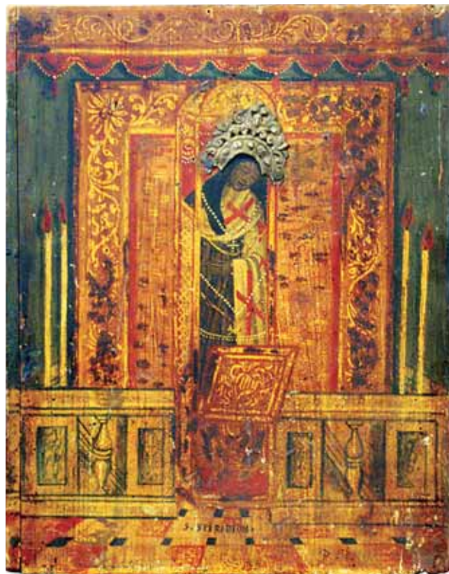
2. Grob sv. Spiridona, tempera na dasci, srebrni okov, 26 x 33,2 cm, Muzej ikona Srpske pravoslavne crkve u Dubrovniku Tomb of St Spyridon, tempera on panel, silver bound, 26 x 33.2 cm, Dubrovnik, Museum of Icons of the Serbian Orthodox Church

povezani u kalendaru Zapadne, ali ni Istočne crkve. 7 Također, nije rijetko da se zajednički prikazane ličnosti povezuju prema sličnim svojstvima ili prema pripadnosti istoj društvenoj skupini. U tome bi se možda moglo pronaći opravdanje zajedničkog prikazivanja navedenih svetaca na cavtatskoj ikoni, jer su svi bili visoko pozicionirani u crkvenoj hijerarhiji. Ipak, nakon provedene analize čini se da bi to ipak bio nedovoljan argument. Stoga se postavlja pitanje određenja pravog razloga zajedničkog prikazivanja tih svetaca, odnosno tih ikonografskih motiva, na ikoni iz Cavtata. Da bismo mogli riješiti postavljena pitanja, bit će nužno istražiti svaki pojedinačni lik ili ikonografski motiv ovdje prikazan, njegovu povijest, porijeklo i značenje. Tek tada ćemo moći predložiti tumačenje slike.