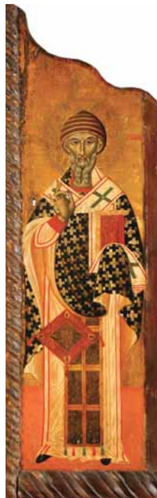
5. Sv. Spiridon, tempera na dasci, 111 x 35 cm, Strossmayerova galerija starih majstora HAZU, inv. br. SG-526.

St Gregory of Nazianzus and St Basil the Great, tempera on board, 111 x 75 cm, Croatian Academy Strossmayer Gallery of Old Masters, inv. no. SG-525