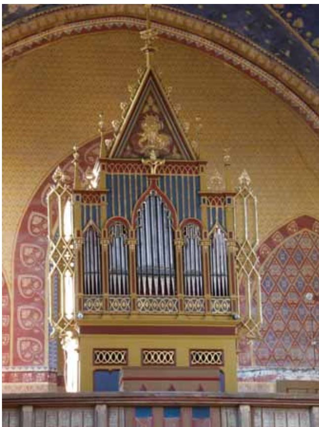
13. Orgulje crkve u Veleševcu, izrađene 1871. u tvrci Heferer

Organ of the church in Veleševac, made in 1871 in Heferer's company