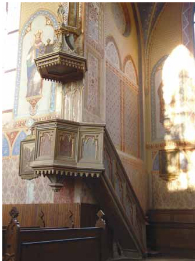
14. Propovjedaonica crkve u Veleševcu, 1871. (?). Na zidu broda uz propovjedaonicu (lijevo) prikazan je kao svetac hrvatski kralj Zvonimir

Organ of the church in Veleševac, made in 1871 in Heferer's company