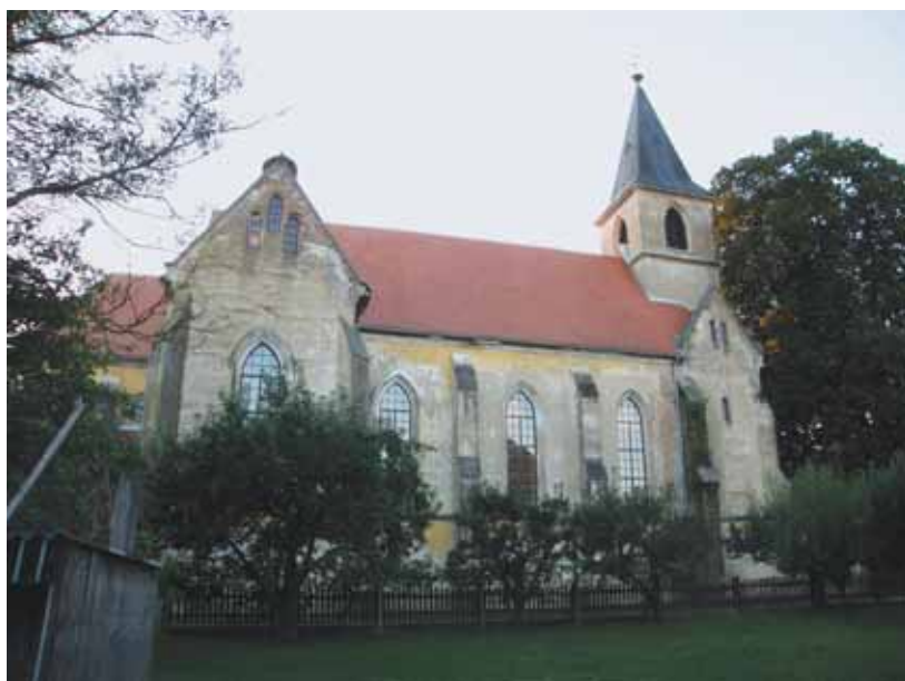
5. Bočno pročelje crkve u Veleševcu, sagrađene 1869.–1871., današnje stanje

Lateral elevation of the church in Veleševac, built 1869–1871, condition today