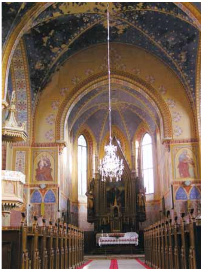
6. Unutrašnjost crkve u Veleševcu, pogled prema svetišću

Interior of the church in Veleševac, view onto the chancel