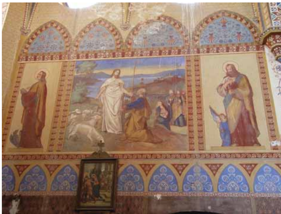
17. Oslík svetišta crkve u Veleševcu sa scenom iz Petrova života Pasi ovce moje i prikazima evanđelista Ivana i Mateja

Decoration of the chancel of the church in Veleševac, with scene from Peter's life, Grazed my sheep , and depictions of the gospel writers John and Matthew (photo by D. Damjanović, 24. 8. 2009.)