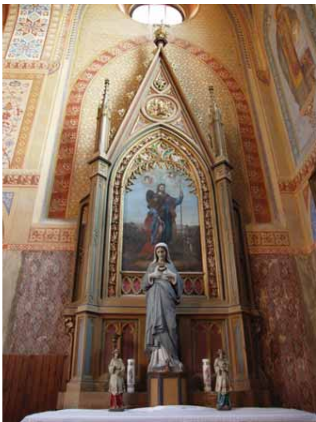
11. Oltar svetog Roka u transeptu crkve u Veleševcu, 1871.

Altar of St Roch in the transept of the church in Veleševcu