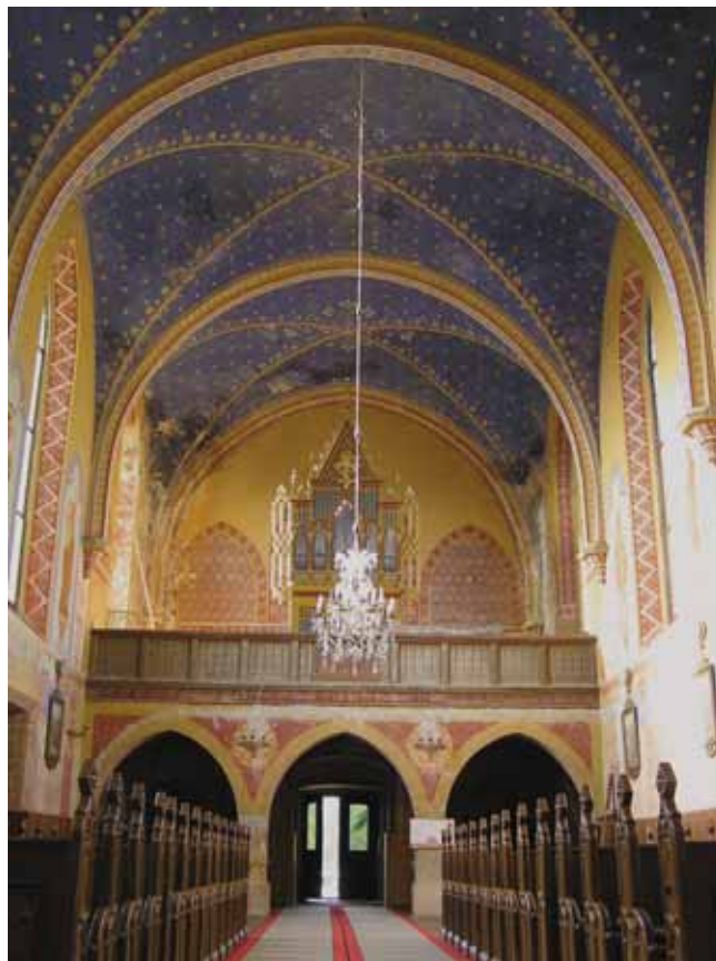
7. Unutrašnjost crkve u Veleševcu, pogled prema koru

Nabavljanje nove unutrašnje opreme za crkvu u Veleševcu uglavnom je završeno tijekom 1871. godine, dakle prije