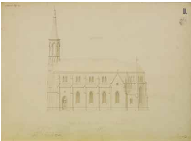
4. Carl Rziwnatz, Projekt za bočno pročelje crkve u Veleševcu, 1859. Albertina, Beč, zbirka projekata Carl Rziwnatz, Plan for the lateral elevation of the church in Veleševac, 1859, Albertina, Vienna, Collection of Plans