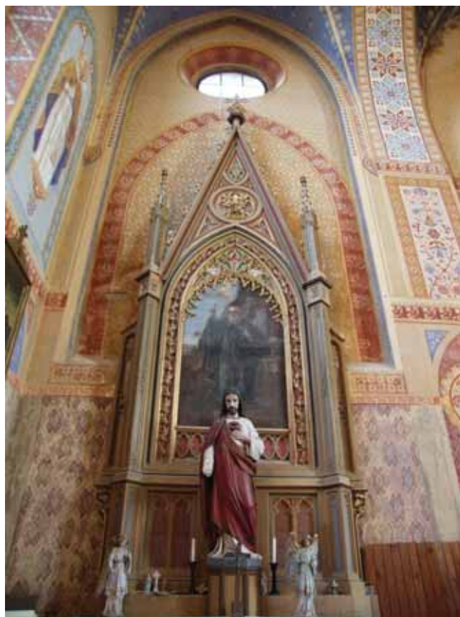
12. Oltar svetog Antuna Pustinjaka u transeptu crkve u Veleševcu, 1871.

Čini se kako nakon 80-ih godina 19. stoljeća inventar crkve nije bitno nadopunjavao, 60 čime ovaj Gesamtkunstwerk hr-