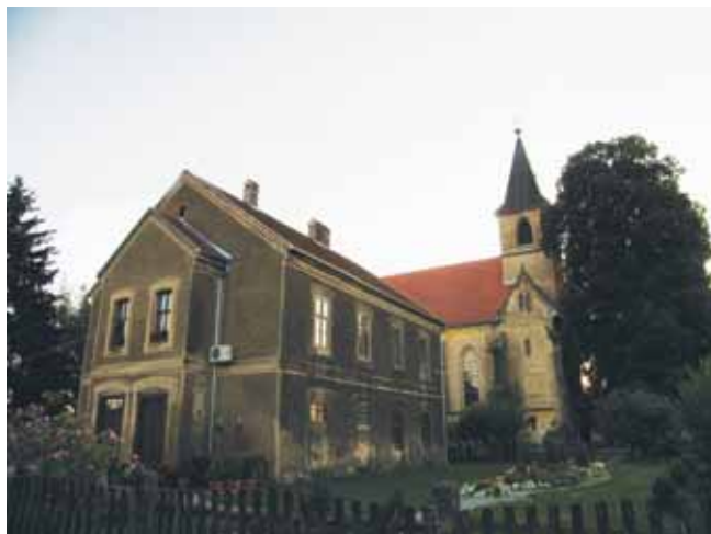
8. Župni dvor u Veleševcu, podignut 1868.–1870., današnje stanje

Vicarage in Veleševac, built 1868–1870 situation of today