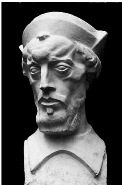
2 Ivan Meštrović, Andrija Medulić, gips, 1909., Narodni muzej, Beograd

Ivan Meštrović, Andrija Medulić, plaster, 1909. The sculpture is in the National Museum in Belgrade.