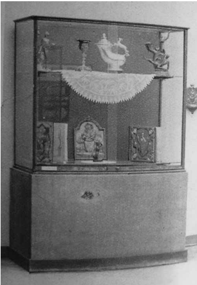
2 Vitrina s predmetima Ive Kerdića na izložbi »Djela« 1927. u Zagrebu

Display case with objects of Ivo Kerdić at the Djela exhibition in Zagreb in 1927