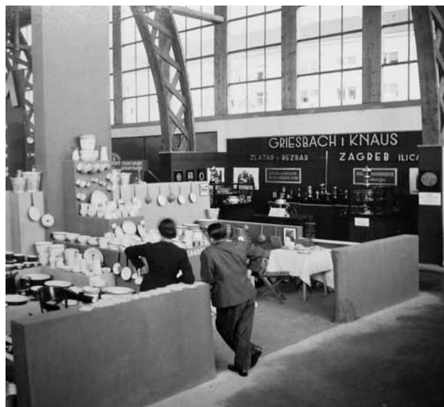
11 Nastup na 30. Zagrebačkom zboru 1938.