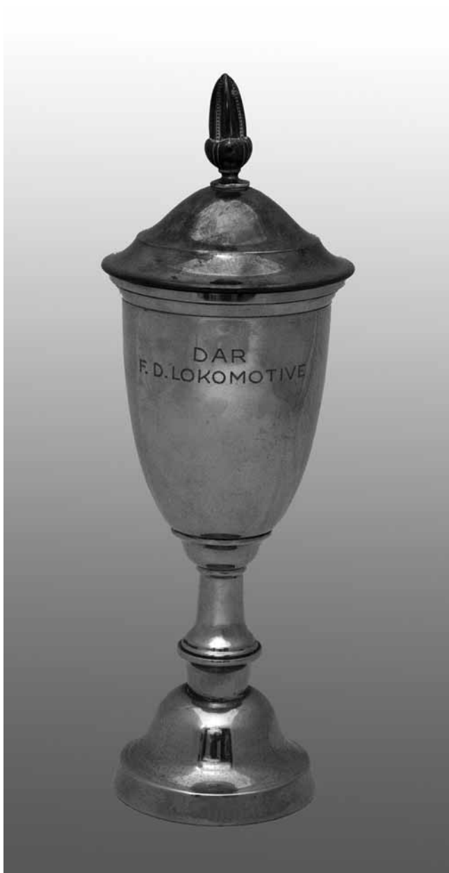
13 Pokal, posebrena metalna legura, oko 1936., Hrvatski športski muzej

Cup, nickelled metal alloy, around 1936, Croatian Sports Museum