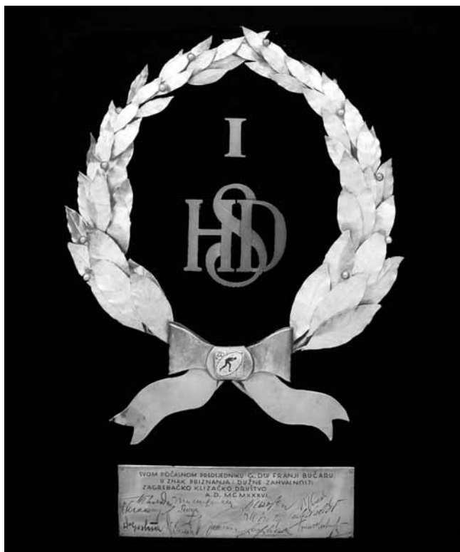
14 Plaketa Zagrebačkog klizačkog društva dr. Franji Bučaru, 1936., Hrvatski športski muzej

Plaque of the Zagreb Skating Association presented to Dr Franjo Bučar, 1936, Croatian Sports Museum