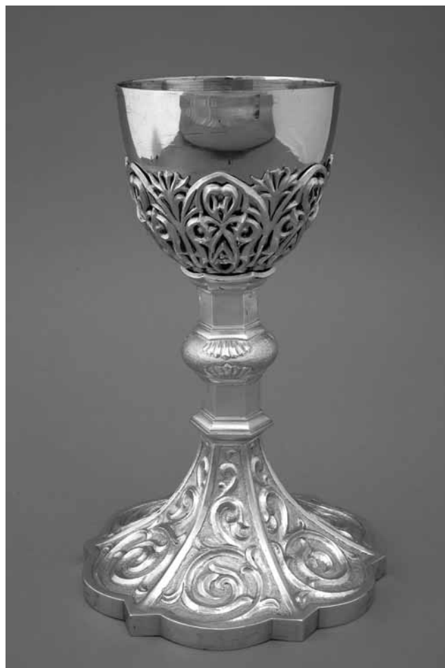
6 Kalež, pozlačeno srebro, nakon sredine 1933., Muzej za umjetnost i obrt Chalice, silver gilt, after mid 1933, Museum of Arts and Crafts

u Zagrebu, izvedene 1932. godine u pozlaćenom iskucanom i cizeliranom srebru s uložnim poludragim kamenjem i biserima. 20 Monstranca heksagonalne zvjezdasto razvedene baze s pravilnim kružno raspoređenim zrakama izuzetno je raskošno zamišljena u duhu kasnog i krutog eklekticizma s elementima neogotičkih i neorenesansnih motiva, zanatski vrhunske izvedbe i vrlo luksuznog dojma. (sl. 4) Kalež, također naručen i izveden za sjemenište, ponavlja elemente baze monstrance, ali s drugačijim nodusom i s košaricom kupe koja slijedi reljefne ornamente baze. (sl. 5) Oba predmeta puncirana su žigovima radionice Griesbach i Knaus kao i državnim jugoslavenskim žigovima za srebro. Izvedeni su 1932. godine. Na monstranci je radionica i signirana (Ex Officina Griesbach i Knaus Zagrabiae), a prema zapisima o gradnji i opremanju Nadbiskupskoga sjemeništa izgleda da se oblikovanje može pripisati arhitektu Vinku Rauscheru. Ovdje se navodi da je Rauscher izradio »nacrt za svekoliko crkveno pokustvo«, u koje se, uz »raspela, škropionice, pričesne klupe, svijećnjake, crkvena rasvjetna tjelesa, umjetno ostakljenje, crkvena zvona, križeve na krovu kapele«, ubraja i »crkveno ruho te razni sitni pribor potreban za vršenje službe