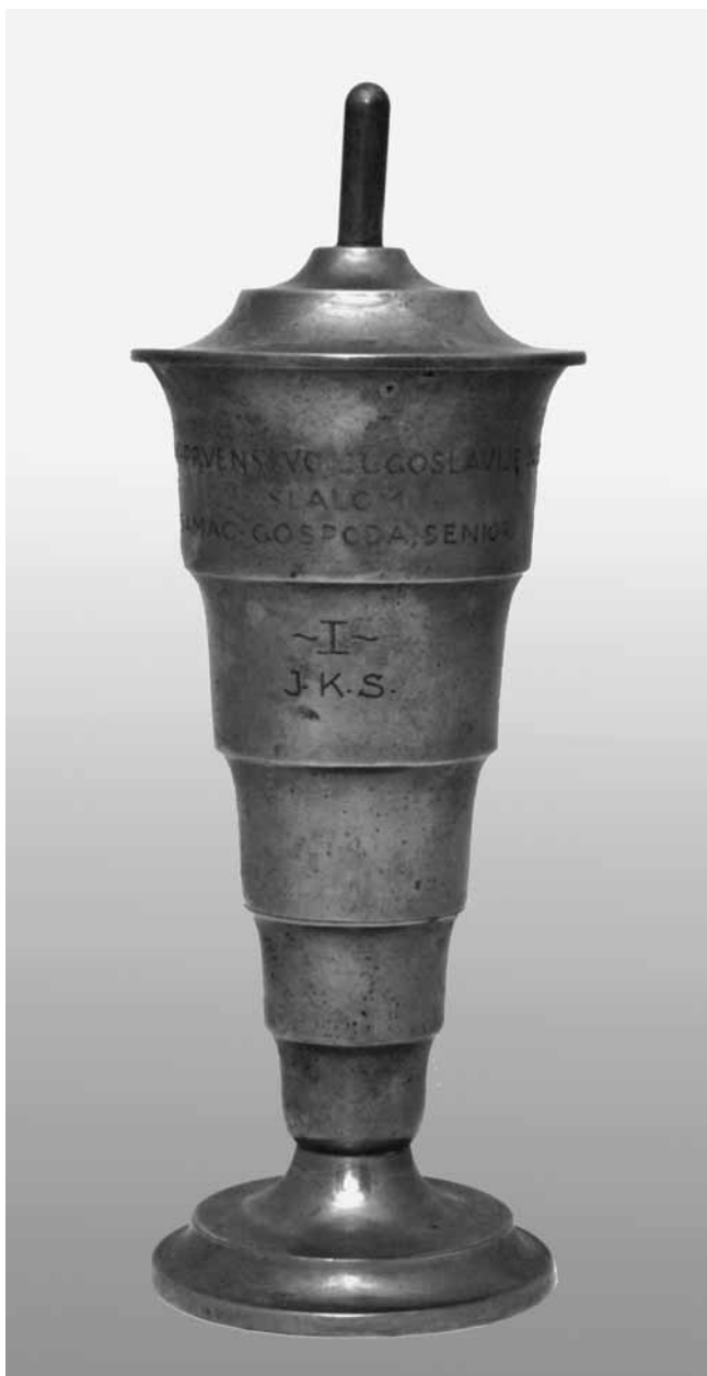
12 Pokal, posebrena metalna legura, oko 1936., Hrvatski športski muzej

Cup, nickelled metal alloy, around 1936, Croatian Sports Museum