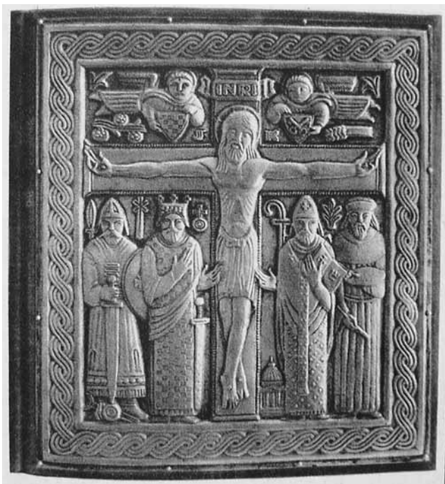
7 Ivo Kerdić »Spomenica Hrvata Sv. Ocu«, fotografija iz revije Svijet, Zagreb 1933., br. 15

Ivo Kerdić, Memento of the Croats to the Holy Father, photograph from the review Svijet, Zagreb, 1933, no. 15