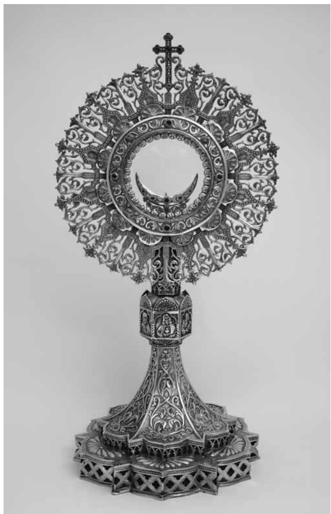
3 Reklama i ponuda sakralnih predmeta iz kataloga s ponudom tvrtke, 1936.

Advert and range of religious objects, from the firm's catalogue of 1936