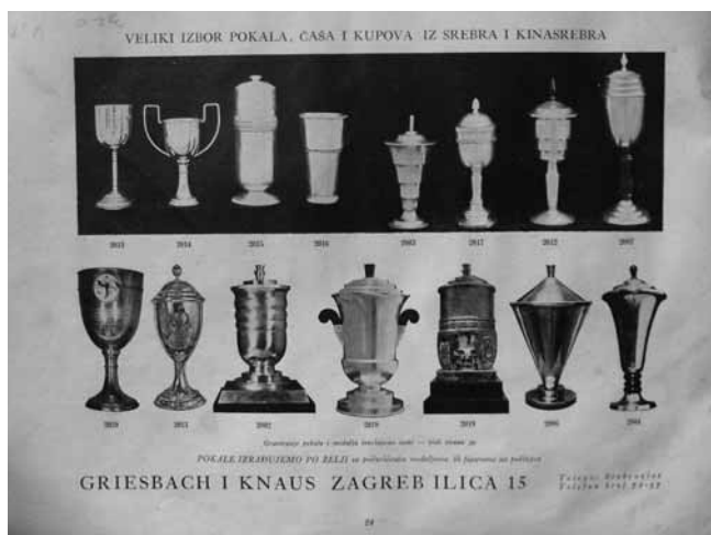
10 Ponuda sportskih pokala iz kataloga s ponudom tvrtke, 1936. The range of sporting cups, from the firm's catalogue of 1936

tako da nakon popravka izgledaju kao novi.« 27 Međutim, izvedba srebrnine i predmeta za opremu stola nije imala vlastitu katalošku ponudu. Izrađivali su pladnjeve, vrčeve, servise za čaj i kavu kao i sve »stolne predmete« te reklamirali izradu svijećnjaka u svim stilovima i popravke srebrnine. 28 Pladnjevi iz njihove produkcije s jedne strane slijede moderno oblikovanje glatkih profilacija i lomljenih stranica u duhu art decoa (sl. 8), pri čemu maksimalno iskorištavaju kvalitetu poliranog srebra kombiniranjem reflektirajućih ploha ili se oslanjaju na reprezentativne uzore historicizma preuzimajući cvjetne elemente ukrasnih bordura aplicirane na razvedene rubne profilacije (sl. 9). Iako su primjeri malobrojni, ukazuju na dvojnost stilskih kretanja tih godina: sklonost geometrizmu art decoa kao i sklonost oblikovanju s izraženijim reminiscencijama na historijske stilove.