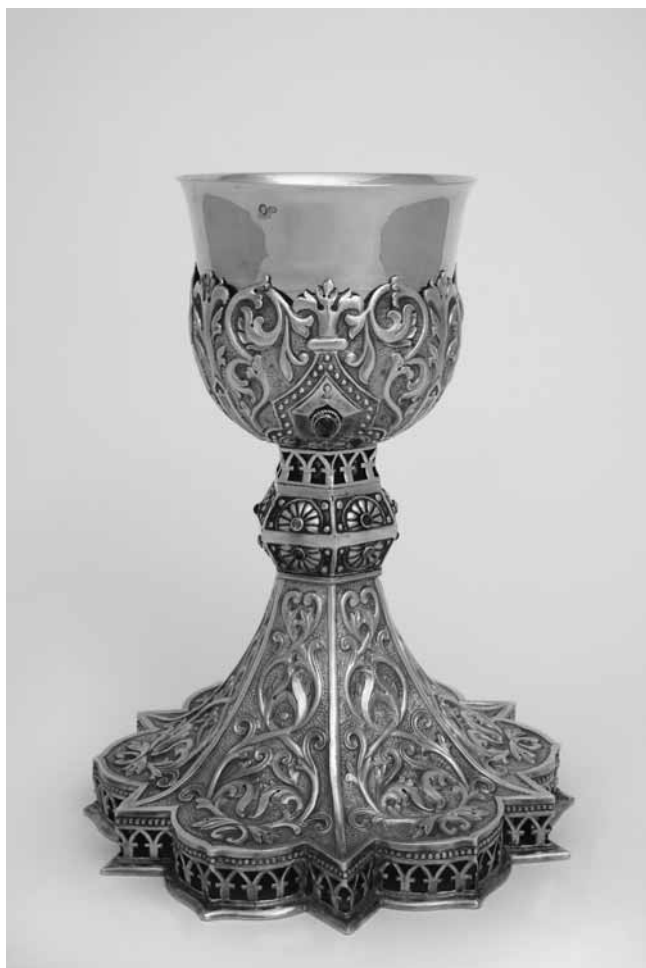
5 Kalež, pozlačeno srebro, vjerojatno prema nacrtu Vinka Rauschera, 1932., Međubiskupijsko sjemenište, Zagreb Chalice, silver gilt, probably from a drawing of Vinko Rauscher, 1932, Archdiocesan Seminary, Zagreb