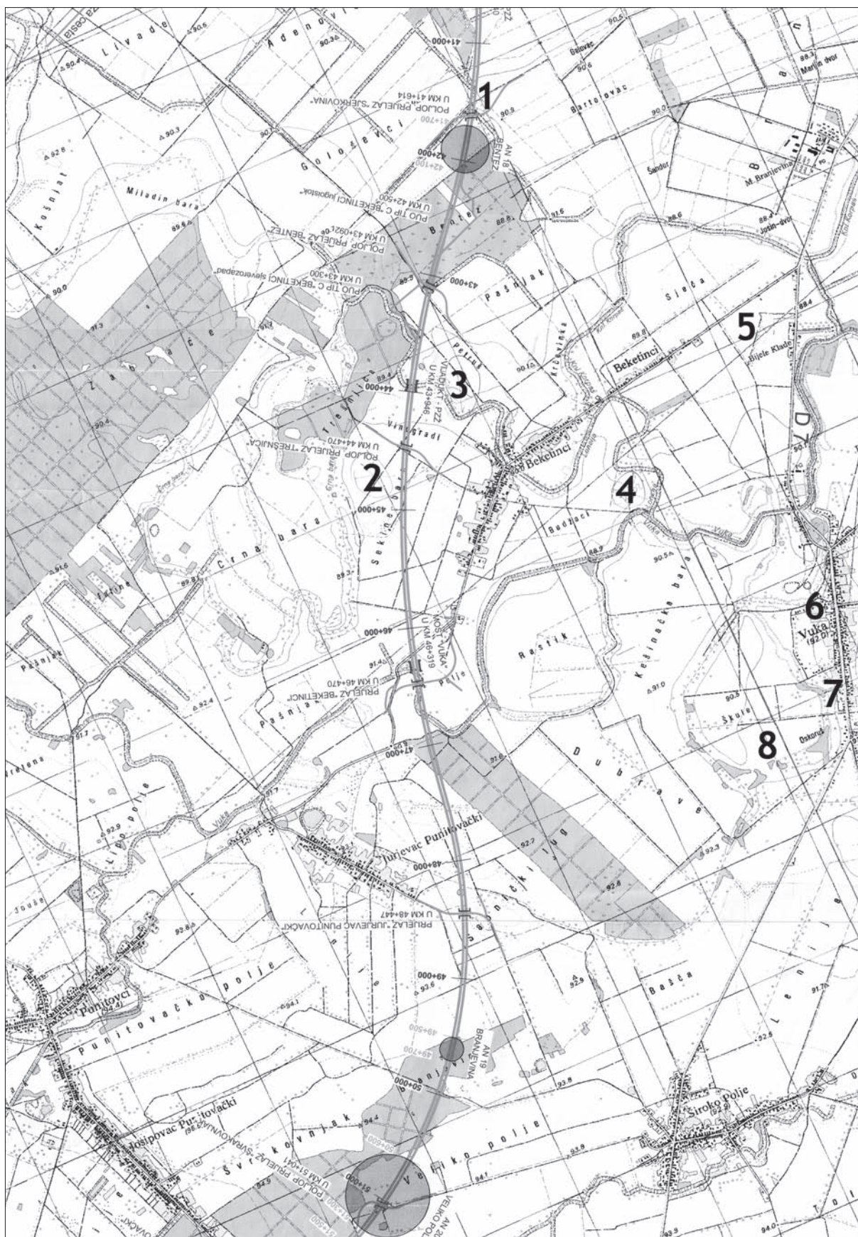
Karta 1 Arheološki lokaliteti: 1. Bektinci, Bentež; 2. Bektinci, Brestić; 3. Bektinci, Petruš; 4. Bektinci, Budžaci; 5. Bektinci, Bijele Klade – Potok Korpaš; 6. Vuka, Osječka ulica (iza crkve Sv. Josipa; 7. Vuka, Osječka ulica (groblje); 8. Vuka, Oskoruš.