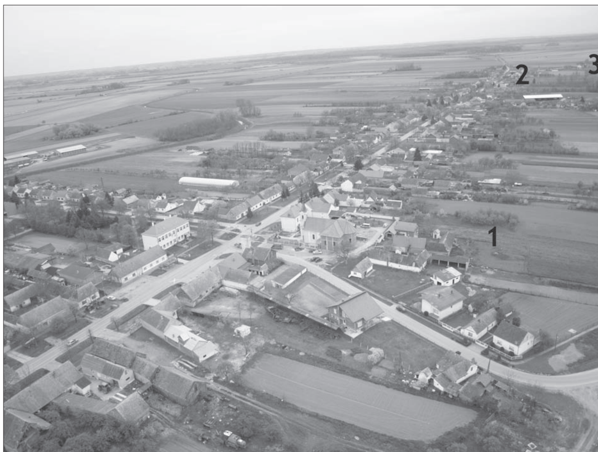
Sl. 2 Vuka – arheološki lokaliteti: 1. Osječka ulica (iza crkve Sv. Josipa), 2. Osječka ulica (groblje), 3. Oskoruš.