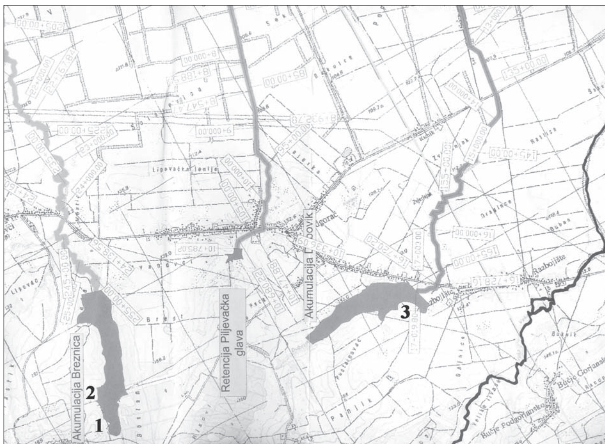
Karta 2 Arheološki lokaliteti na akumulacijama Breznica i Dubovik kod Podgorača: 1) Kršinci, Parlog-Risovi, 2) Kršinci, Parlog-Kučiste, 3) Podgorač, Panjik (izradila: K. Botić).

Map 2 Archaeological sites at the reservoirs Breznica and Dubovik near Podgorač: 1) Kršinci, Parlog-Risovi, 2) Kršinci, Parlog-Kučiste, 3) Podgorač, Panjik (by: K. Botić).