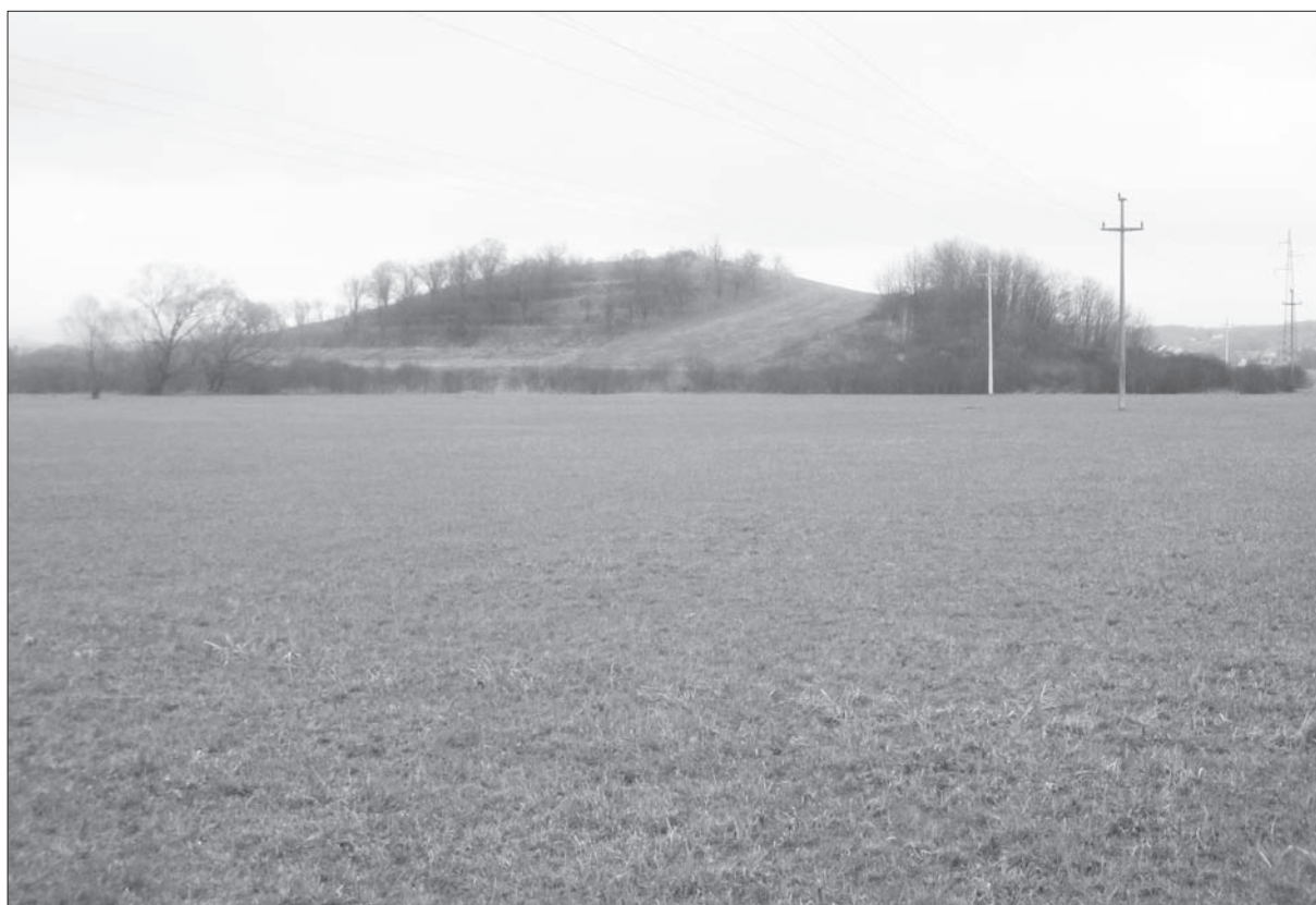
Sl. 3 Daruvar-Gradina.