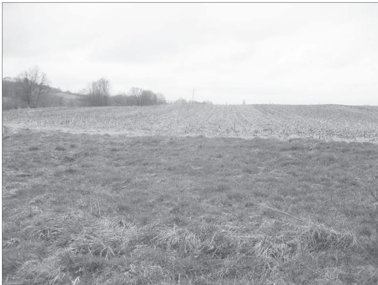
Sl. 2 Ljudevit Selo-Toplica.

Fig. 1 Končanica-Lipovina 1.