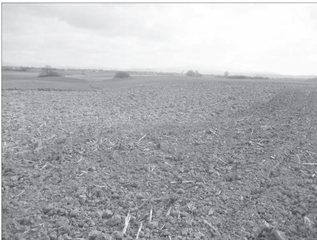
Sl. 4 Gornji Sredani-Zidine.