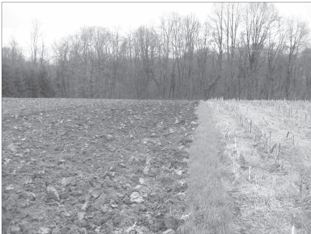
Sl. 1 Končanica-Lipovina 1 (snimio: M. Dizdar).

Fig. 1 Končanica-Lipovina 1 (photo: M. Dizdar).