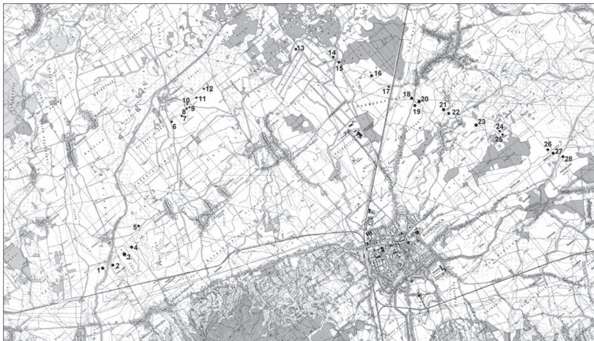
Karta 1 Nalazišta na trasi obilaznice Koprivnice (izradila: A. Tonc).

Ključne riječi: terenski pregled, Koprivnica, obilaznica, prapovijest, srednji vijek Key words: field survey, Koprivnica, bypass, prehistory, Middle Ages