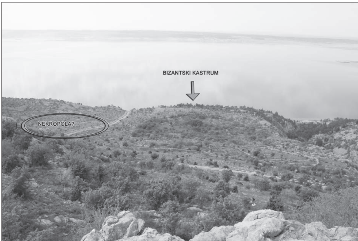
Sl. 3 Ostaci ranobizantske utvrde i vjerojatni položaj nekropole (snimio: M. Dizdar).