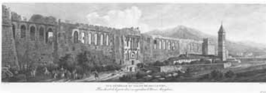
slika 2. Pogled na Dioklecijanovu palaču, sa strane Zlatnih vrata, u pozadini se vidi Marjan