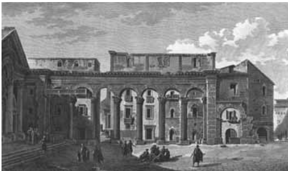
slika 6. Vestibul (tj. Trg ili Dvorište sa stupovljem, Peristil) Dioklecijanove palače