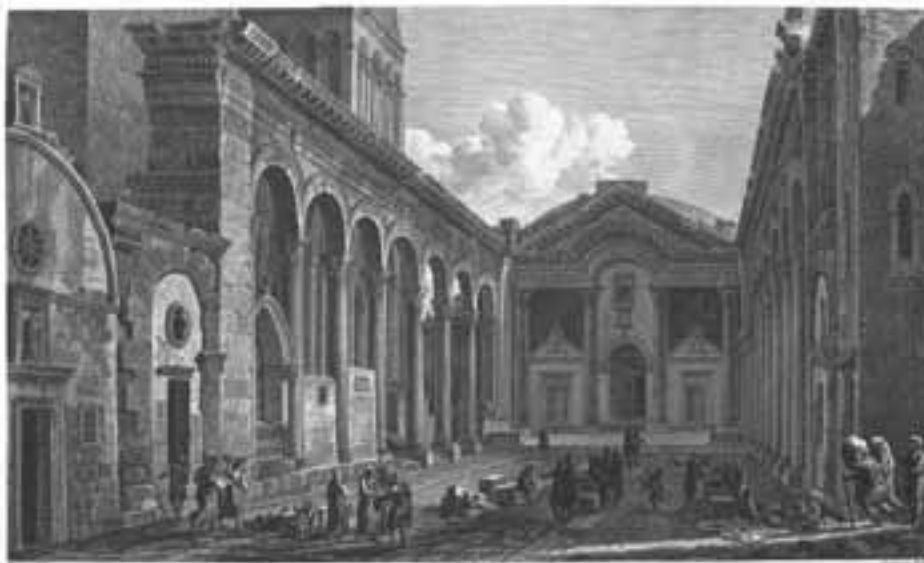
slika 5. Pogled na veliki Vestibul (zapravo Trg odnosno Peristyl), sada zvan Crkveni trg