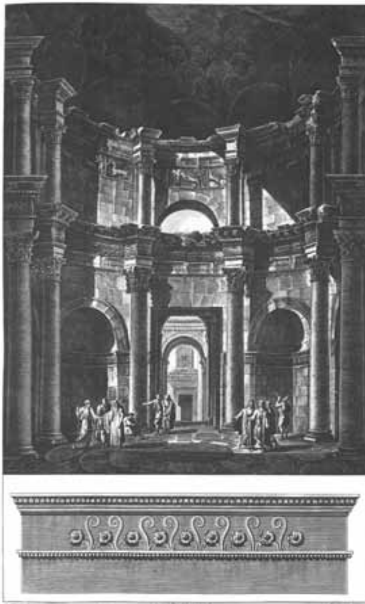
VEK DE L'INTERIEUR DE TEMPLE DE JUPITER A SPALATRO, Le fragment de l'entablature dans les ruines de Salona.