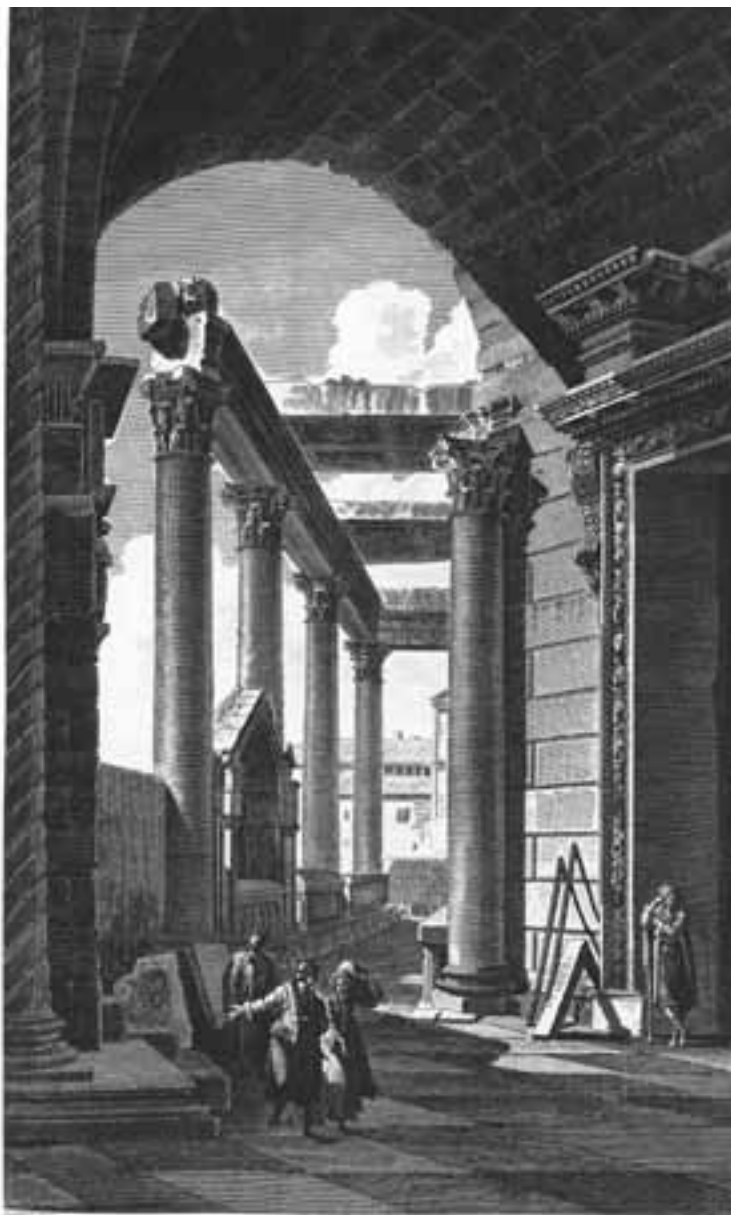
VUE D'UNE PARTIE DE LA GALLERIE DU TEMPLE DE JUPITER, du Côté de la Porte d'Or.