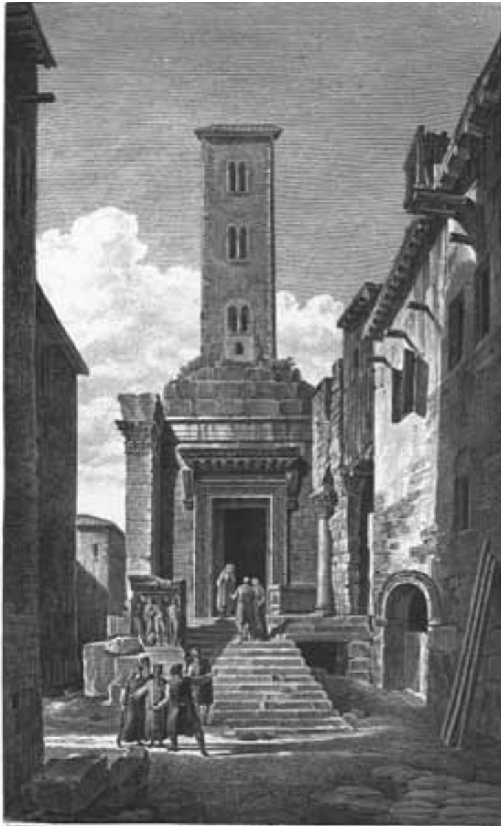
VUE DU TEMPLE D'ÆSCULAPE, Plan en face du temple de la Vierge vu du Temple de Neptune.