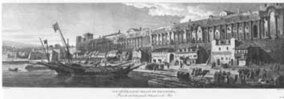
slika 1. Pogled iz luke na Dioklecijanovu palaču