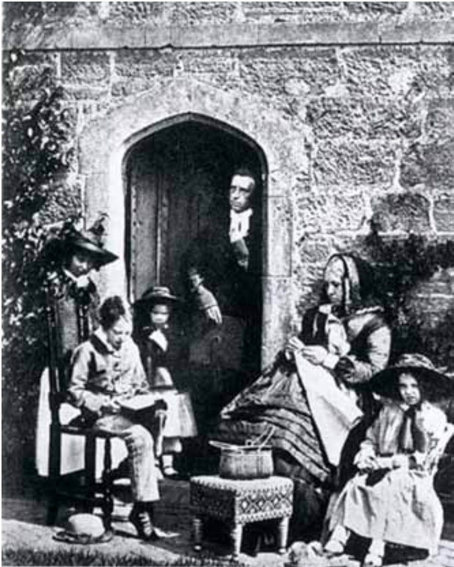
slika 2. John Mason Neale i njegova obitelj ispred kuće u East Greansteadu u Engleskoj 1855. g.