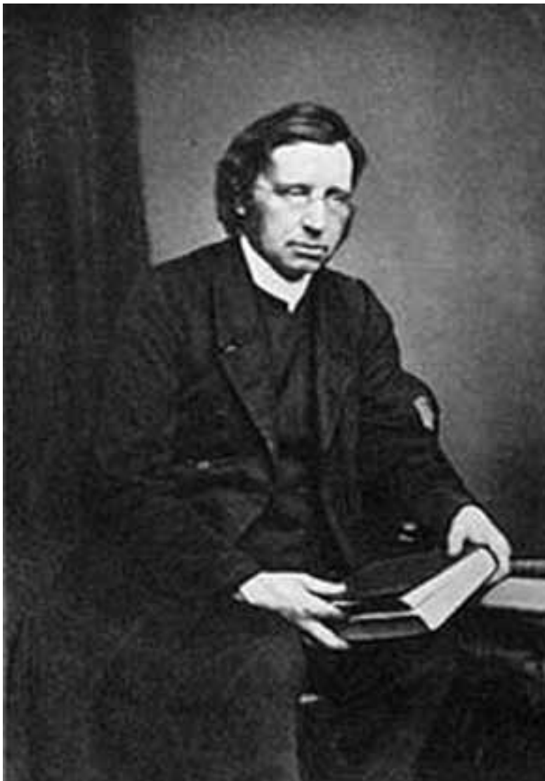
slika 1. John Mason Neale ( http://anglicanhistory.org/neale/ )