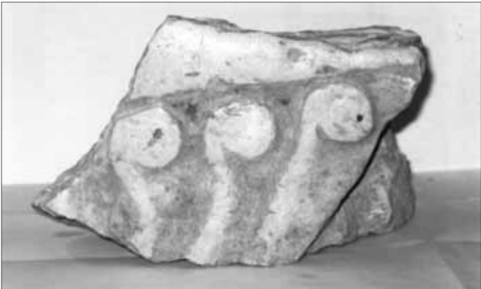
slika 9. Mramorni ulomak ukrašen dvoprutim kukama nađen u grobu br. 22