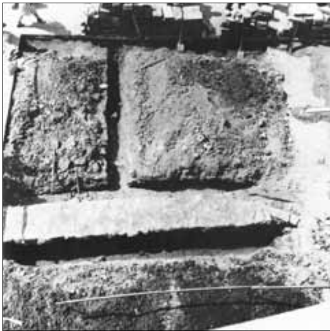
slika 6. Ostaci temeljnih zidova po sredini Trga koji bi mogli pripadati sakralnoj građevini (crkvi sv. Lovre?)