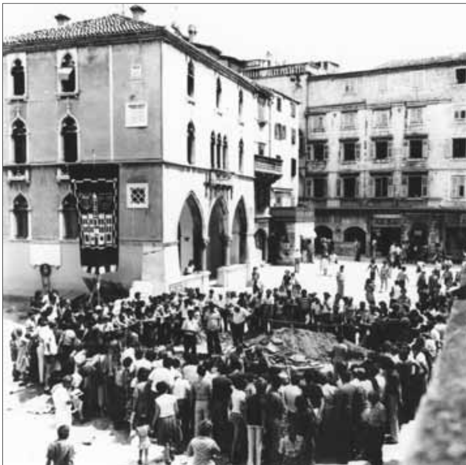
slika 1. Arheološka istraživanja na Pjaci izazvala su veliko zanimanje javnosti