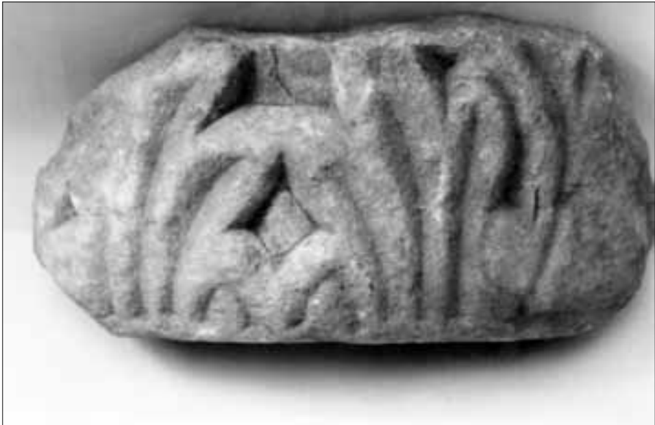
slika 8. Mramorni ulomak ranokršćanskoga kapitela pronađen u grobu br. 22