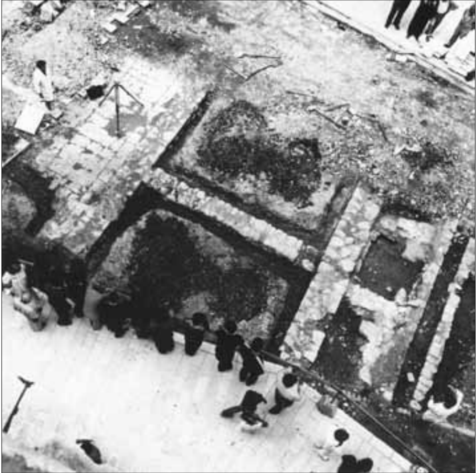
slika 2. Temeljni ostaci porušenoga gotičkog sklopa prema zapadu (ostaci Kneževe palače s pločnikom)