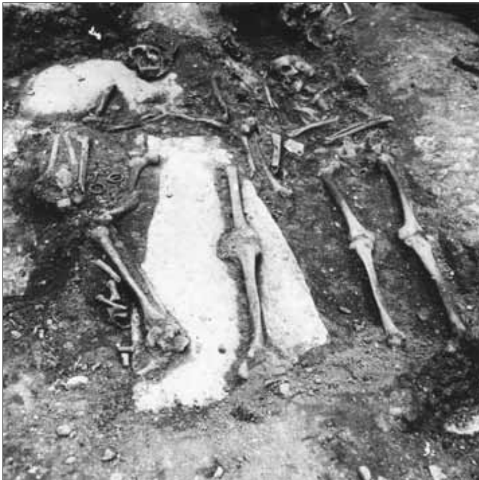
slika 3. Tipovi grobova pronađenih tijekom istraživanja