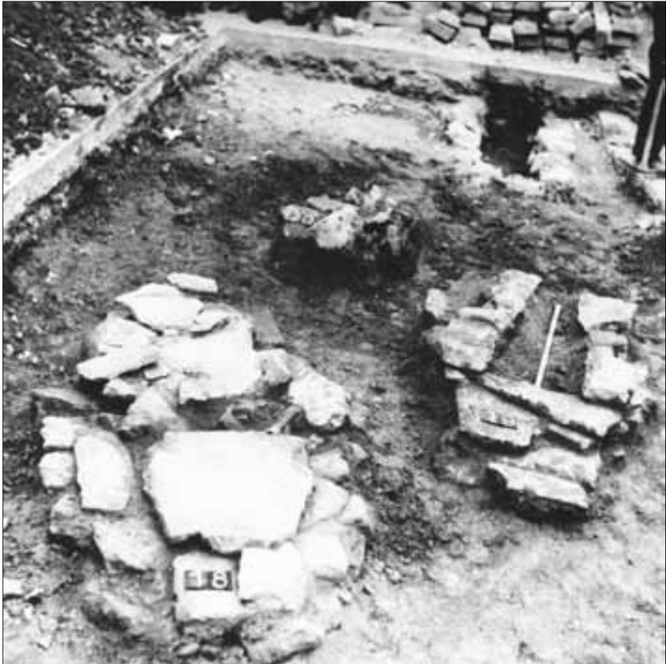
slika 4. Tipovi grobova pronađenih tijekom istraživanja (u prostoj zemlji, ovalni, pravokutni)