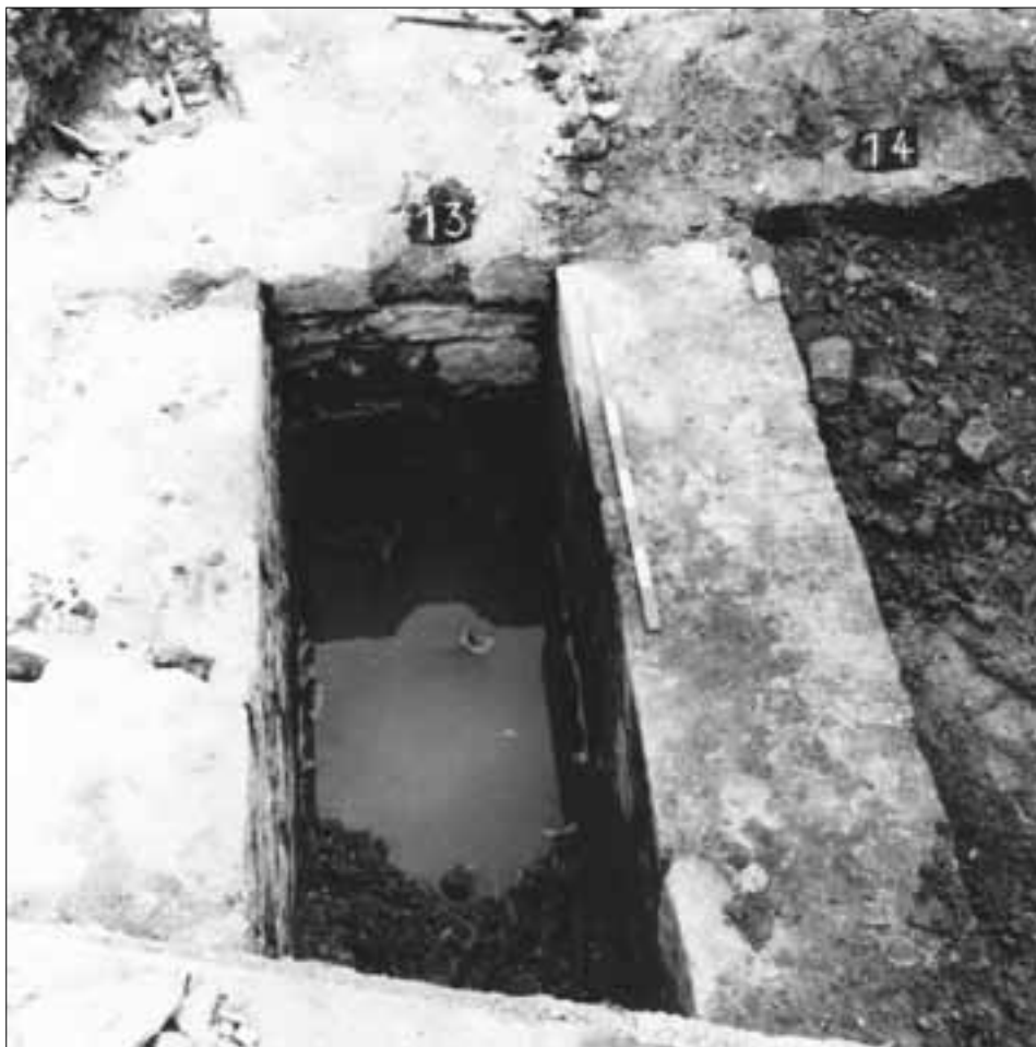
slika 5. Tip zidane grobnice