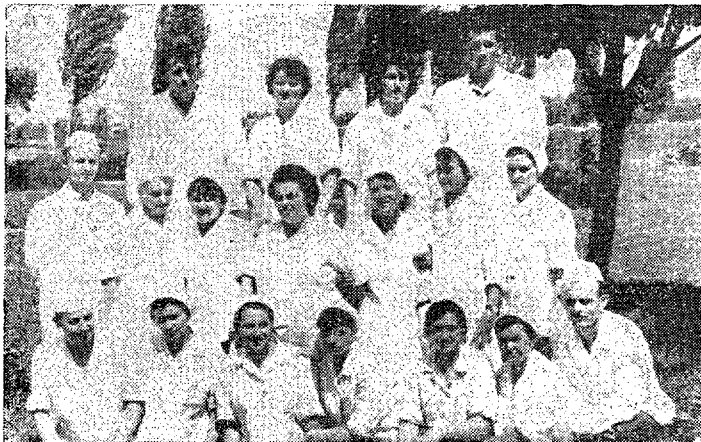
Sl. 4 — Odbor za stručno osposoblja- vanje radnika pri Centralnoj mlekari Novi Sad