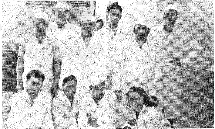
Sl. 3 — Odbor za stručno osposoblja- vanje radnika pri Zadružnoj mlekari, Mlekoprodukt Zrenjanin