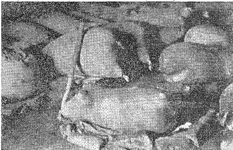
Sl. 3 — Mješine s ovčjim sirom i skorupom. Piva