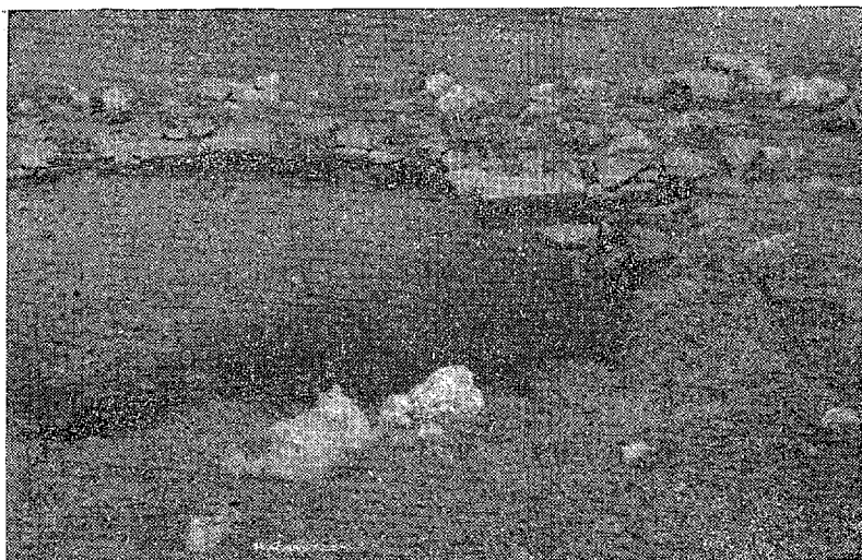
Sl. 2 — Zapuštena zidana lokva na pašnjacima ispod Platka udaljena od mjesta sirenja