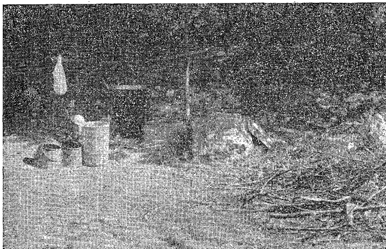
Sl. 1 — »Sirarna« grobničkih ovčara pod »vedrim nebom«