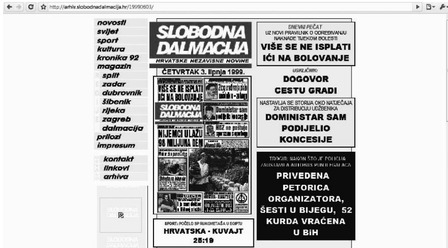
Slika 2 - Početna stranica prvog izdanja Slobodne Dalmacije na internetu

Izbori.net ostvarili su veliki uspjeh, a na dan izbora, 3. siječnja 2000. godine, imali su više od 100 tisuća posjeta 25 . Pored Izbori.net postojalo je još nekoliko web stranica što su nudile informacije koje se nisu mogle pronaći kod mainstream medija u Hrvatskoj, a koje su bile financirane od strane inozemnih fondacija 26 .