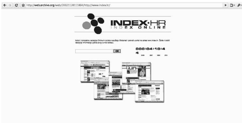
Slika 3 - Obavijest da autori i kompletna redakcija Online.hr napušta Globalnet i pokreće www.index.hr

pomoć Globalneta pokreće Online.hr 27 . Iskon uskoro preuzima Klik.hr. U studenom 2002. godine, zbog nemogućnosti dogovora oko poslovnih udjela i financija, Babić s cjelokupnim uredništvom osniva Index.hr.