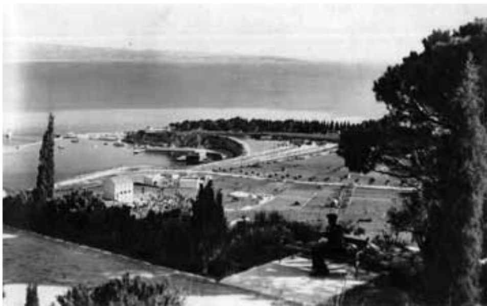
slika 3. Pogled s Marjana na uvalu Baluni i Sustipan (foto razglednica s početka 1930-tih, izdanje Stühler, iz privatne zbirke Karmen Hrvatić)