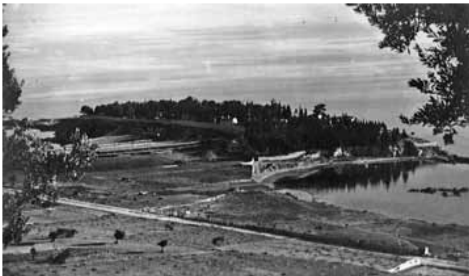
slika 4. Pogled s Marjana na Sustipan i uvalu Zvončac (foto razglednica s početka 1930-tih, izdanje Stühler, iz privatne zbirke Karmen Hrvatić)