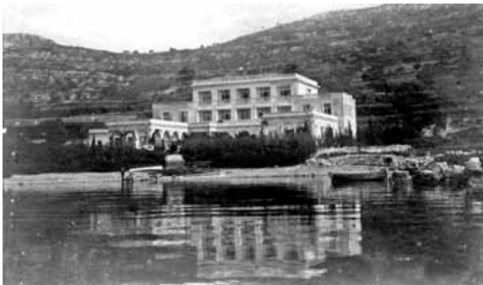
slika 1. Pansion Šiler, sagrađen 1914. godine