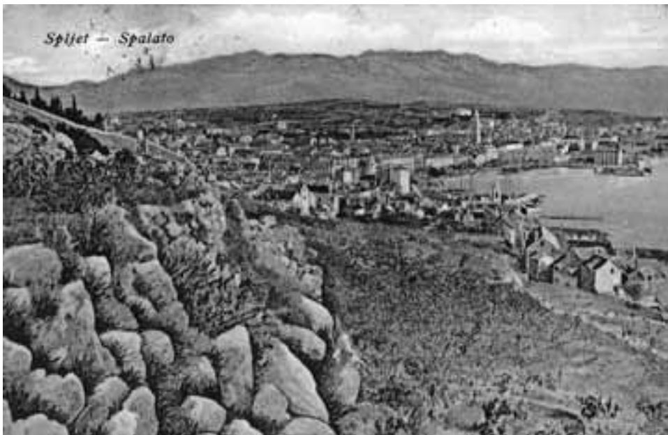
slika 5. Južne padine Marjana (razglednica izdavača G.A. Milišića, datirana 1911., iz privatne zbirke Karmen Hrvatić)