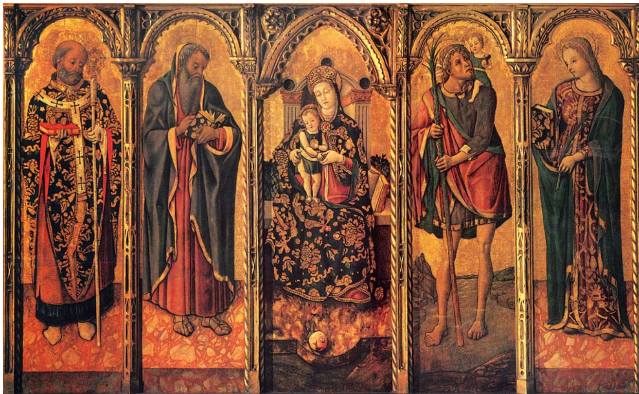
Vittore Crivelli: Poliptih, Moskva, Muzej Puškin (iz Crkve sv. Krševana u Zadru?)

Vittore Crivelli: Polyptych, Moscow, Pushkin Museum of Fine Arts (from the Church of St Chrysogonus)