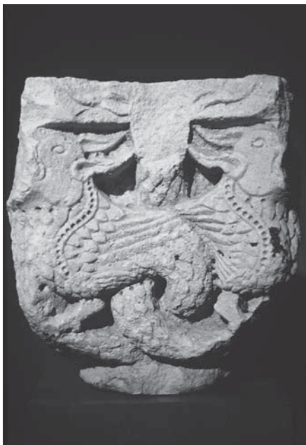
Zadar, Stalna izložba crkvene umjetnosti, kapitel s likovima zmajeva Zadar, Permanent Exhibition of Church Art, capital with dragon figures