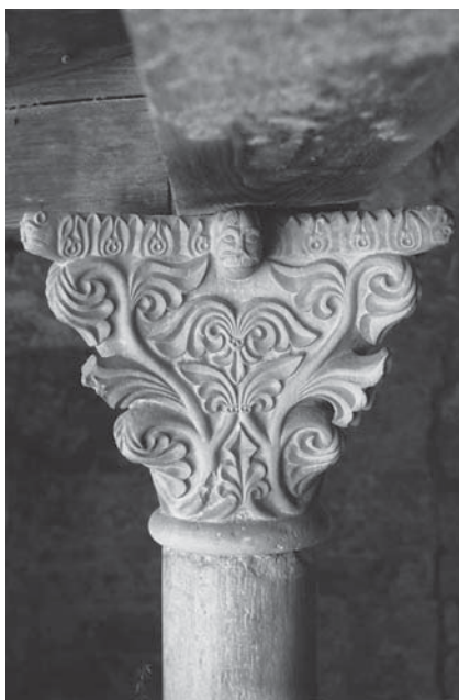
Ugljan, klaustar u Samostanu sv. Jeronima, kapitel s prućem i listovima lozice

Zadar, National Museum, capital from the Monastery of St Mary the Little