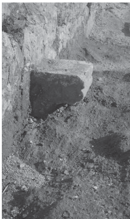
Zadar, konzola prvotnoga klaustara u Samostanu sv. Frane, (foto: P. Vežić) Zadar, bracket of the original cloister in the Monastery of St Francis