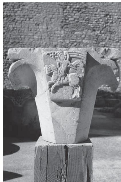
Zadar, Narodni muzej, kapitel s likom sv. Krševana

Ugljan, cloister of the Monastery of St Jerome, impost capital with figures of three fish