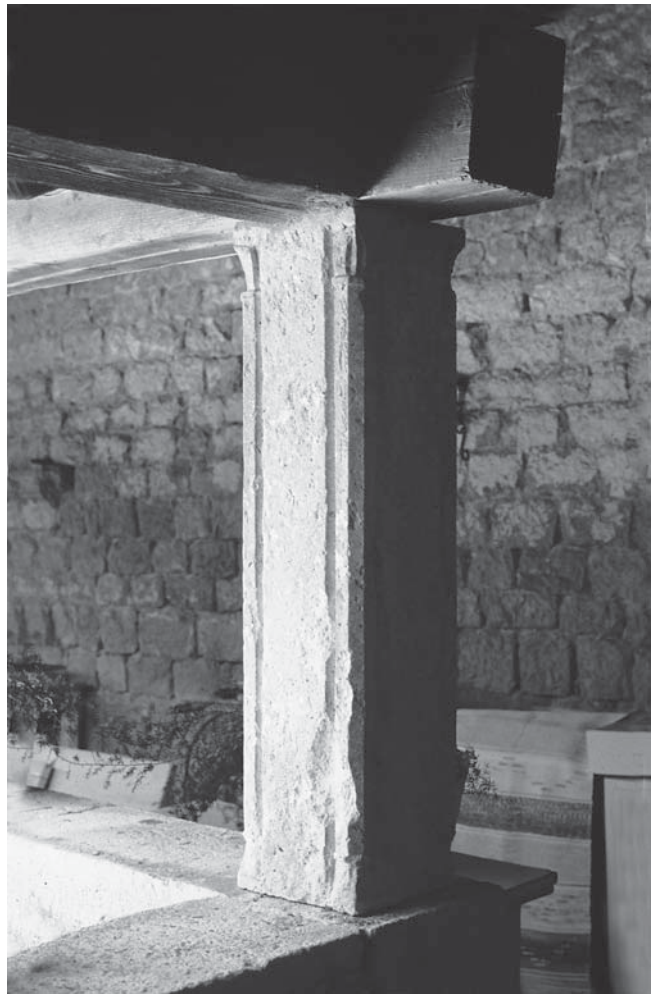
Ugljan, pilastar u klaustaru Samostana sv. Jeronima Ugljan, pilaster in the cloister of the Monastery of St Jerome

S tom su glavicom u formi i dimenzijama srodna još dva kapitela. Jedan se nalazi također u ugljanskome klaustaru, u jugozapadnom kutu, a drugi je izložen na Stalnoj izložbi cr-