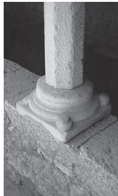
Ugljan, klaustar u Samostanu sv. Jeronima, baza stupića Ugljan, cloister in the Monastery of St Jerome, base of a pillar

u isto vrijeme i prostor, te se čini mogućim da svi kapiteli potječu iz prvotnoga klaustara sv. Frane u Zadru.