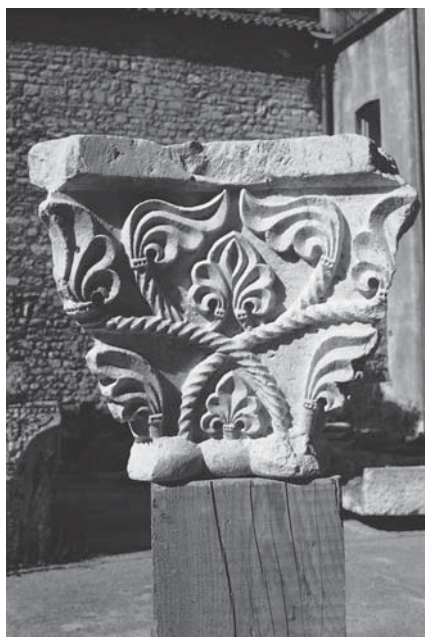
Zadar, Narodni muzej, kapitel iz Samostana sv. Marije Male

Zadar, National Museum, capital from the Monastery of St Mary the Little