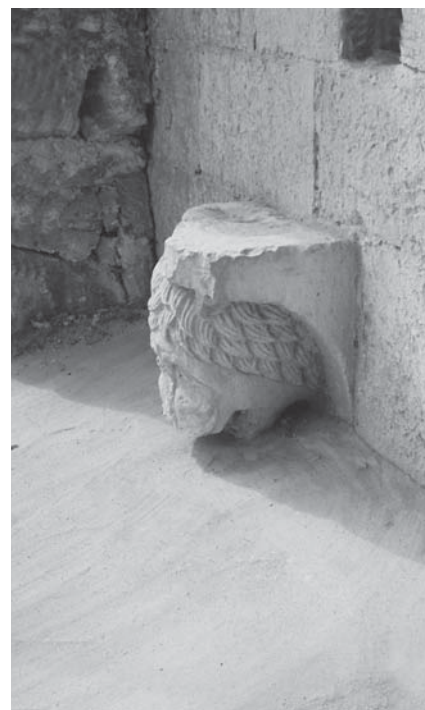
Zadar, konzola na sjevernome zidu Crkve sv. Frane Zadar, bracket on the northern wall of the Church of St Francis