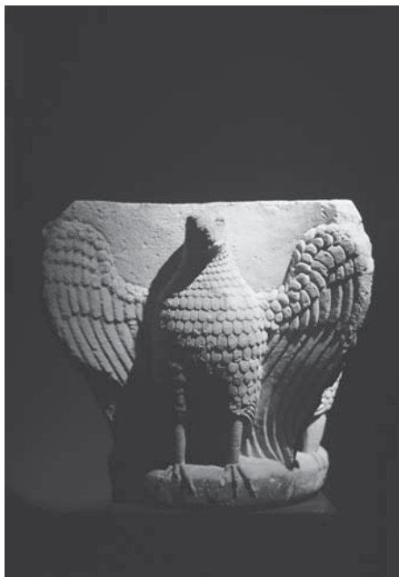
Zadar, Stalna izložba crkvene umjetnosti, kapitel s likovima četiriju orlova Zadar, Permanent Exhibition of Church Art, capital with figures of four eagles