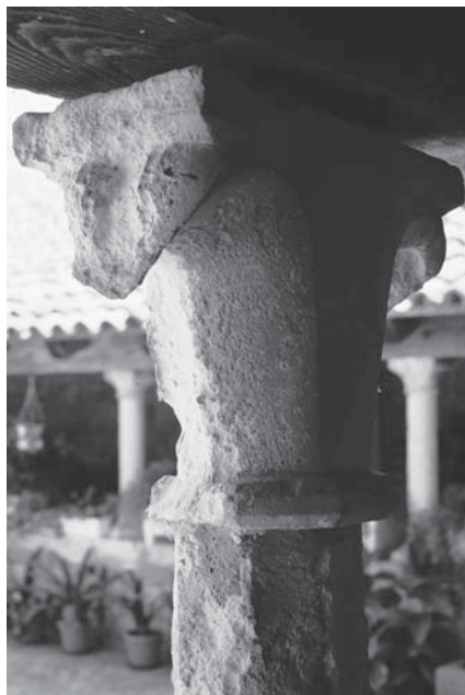
Ugljan, klaustar u Samostanu sv. Jeronima, impost-kapitel

Ugljan, cloister in the Monastery of St Jerome, impost capital