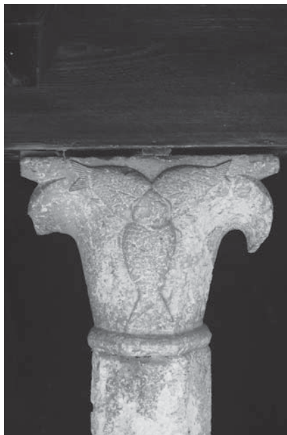
Ugljan, klaustar u Samostanu sv. Jeronima, impost-kapitel s likovima triju riba

Ugljan, cloister in the Monastery of St Jerome, impost capital