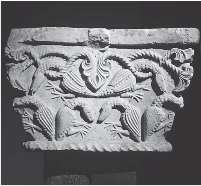
Zadar, Stalna izložba crkvene umjetnosti, kapitel iz Samostana sv. Frane u Zadru

Zadar, Permanent Exhibition of Church Art, capital from the Monastery of St Francis, Zadar