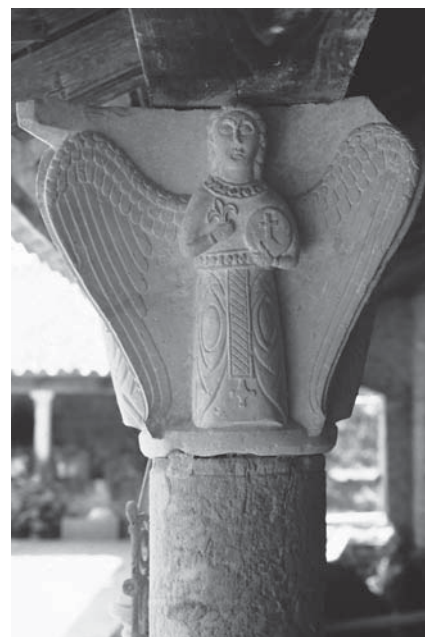
Ugljan, klaustar u Samostanu sv. Jeronima, kapitel s likovima četiriju anđela

Ugljan, cloister in the Monastery of St Jerome, capital with vine cane and leaves