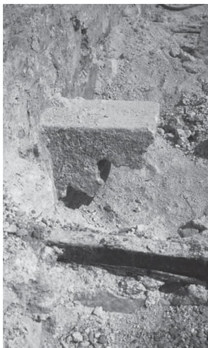
Zadar, konzola prvotnoga klaustara u Samostanu sv. Frane Zadar, bracket of the original cloister in the Monastery of St Francis