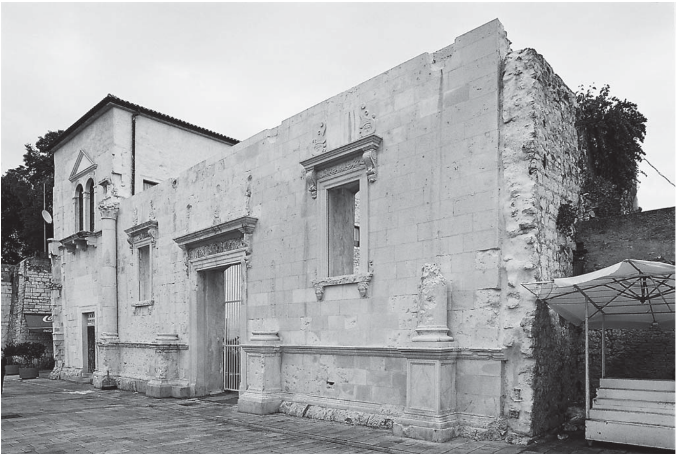
5 Kapela sv. Roka i pročelje nedovršene Crkve sv. Šimuna, sadašnji izgled nakon konzervatorsko-restauratorskih radova, Fototeka Konzervatorskog odjela u Zadru (foto: Z. Bogdanović, 2006.)

Chapel of St Roch and facade of the unfinished Church of St Simeon, present-day appearance after conservation and restoration treatment, Photo Collection of the Conservation Department in Zadar.