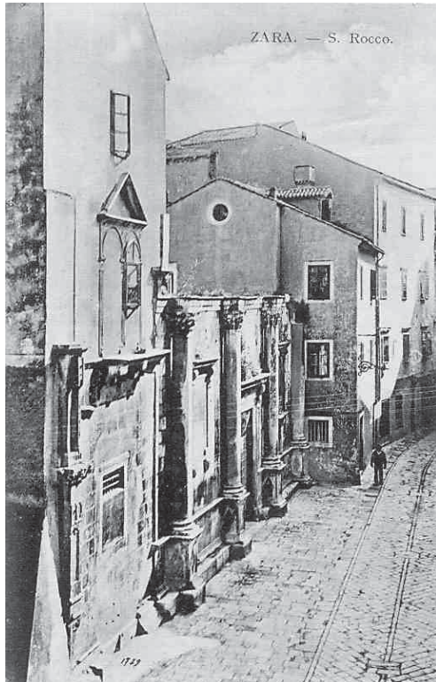
Kapela sv. Roka i pročelje nedovršene Crkve sv. Šimuna, presnimljeno iz: Ćiril M. Iveković, Građevinski i umjetnički spomenici Dalmacije , mapa 6, tabla 43 ( Jadranska straža , Beograd, 1928.)

Chapel of St Roch and facade of the incomplete Church of St Simeon, copied from Ćiril M. Iveković, Građevinski i umjetnički spomenici Dalmacije, album 6, plate 43, (Jadranska straža, Beograd, 1928.)