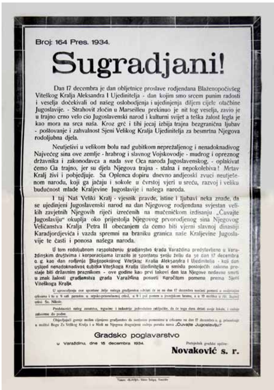
Fotografija 10. Obavijest da kraljev rođendan više nije praznik 79