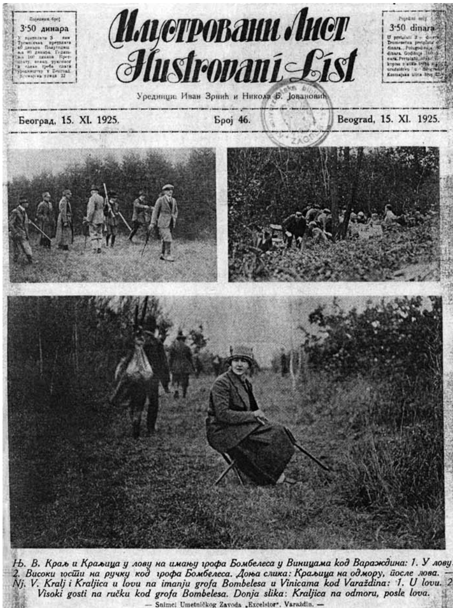
Fotografija 1. Tri fotografije za vrijeme lova 1925. godine 70