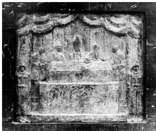
Fotografije 13, 14. i 15. 82