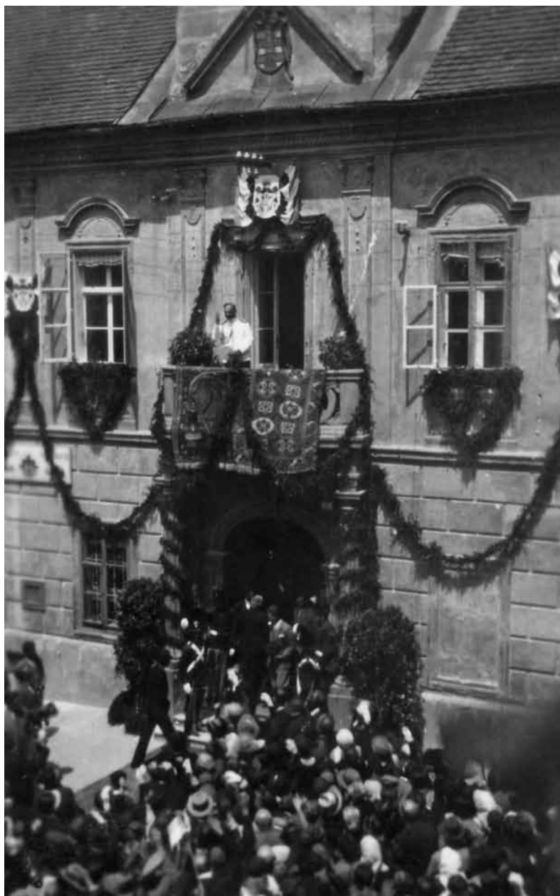
Fotografija 3. Kralj Aleksandar prilikom posljednje posjete Varaždinu 1931. godine 72