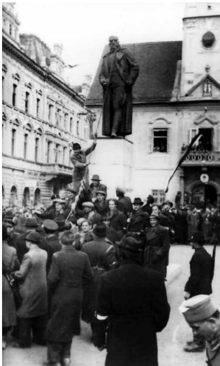
Fotografija 17. Trenutak prije rušenja spomenika lancem (bijeli ukrasni kamen) 84