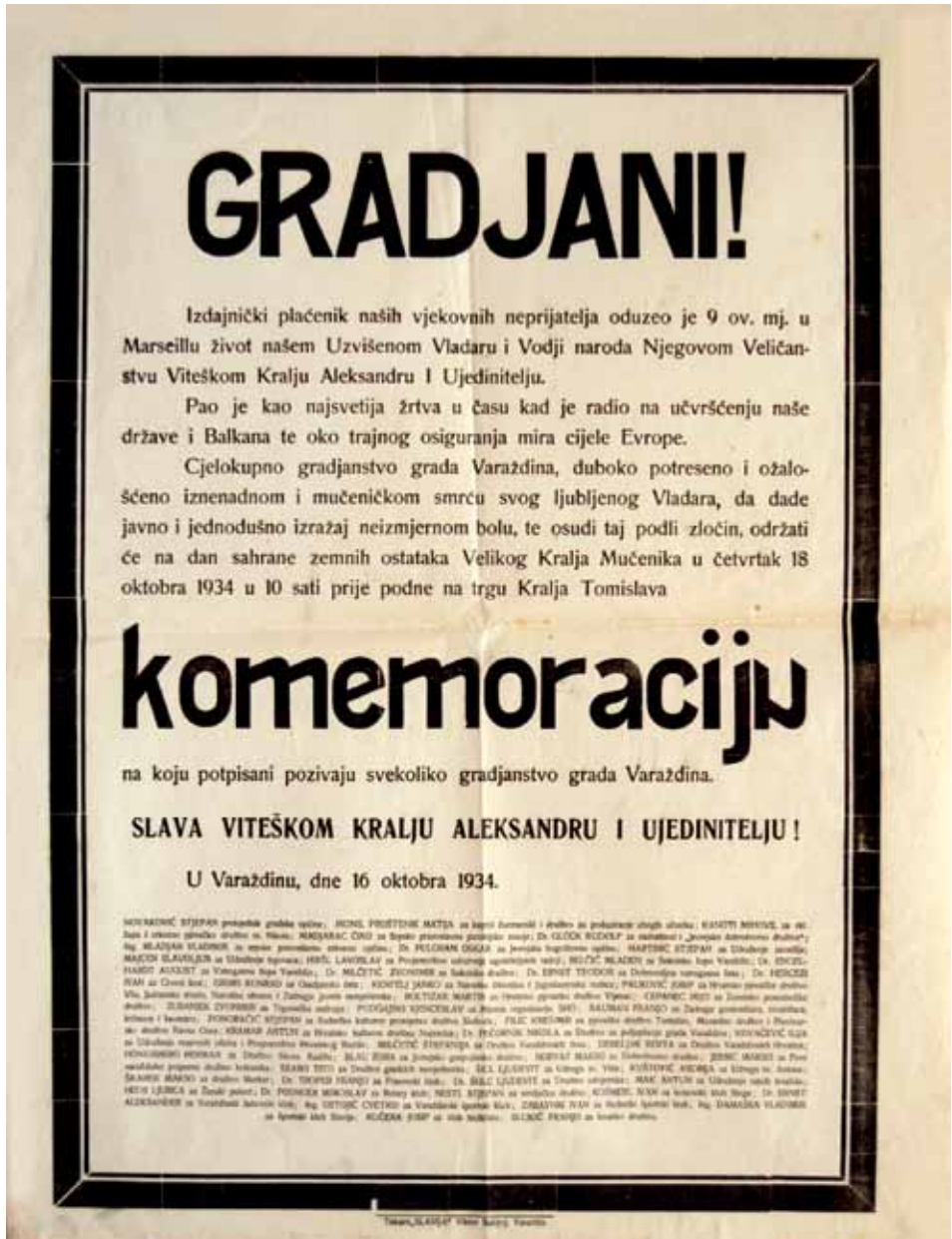
Fotografija 9. Poziv na komemoraciju 78