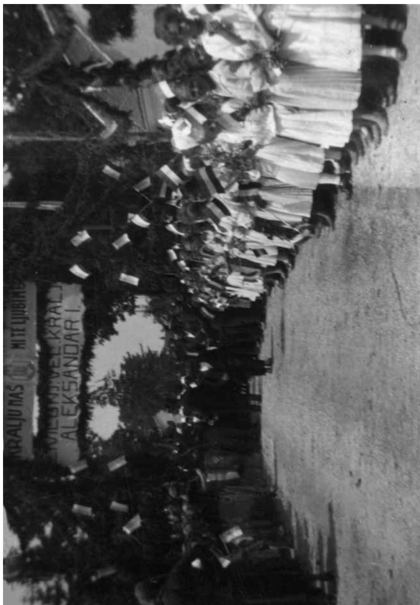
Fotografija 7. Doček u Vidovcu 76