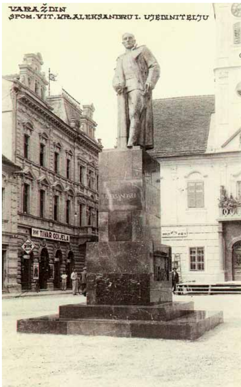
Fotografija 16. Razglednica Varaždina s motivom spomenika kralju Aleksandru 83