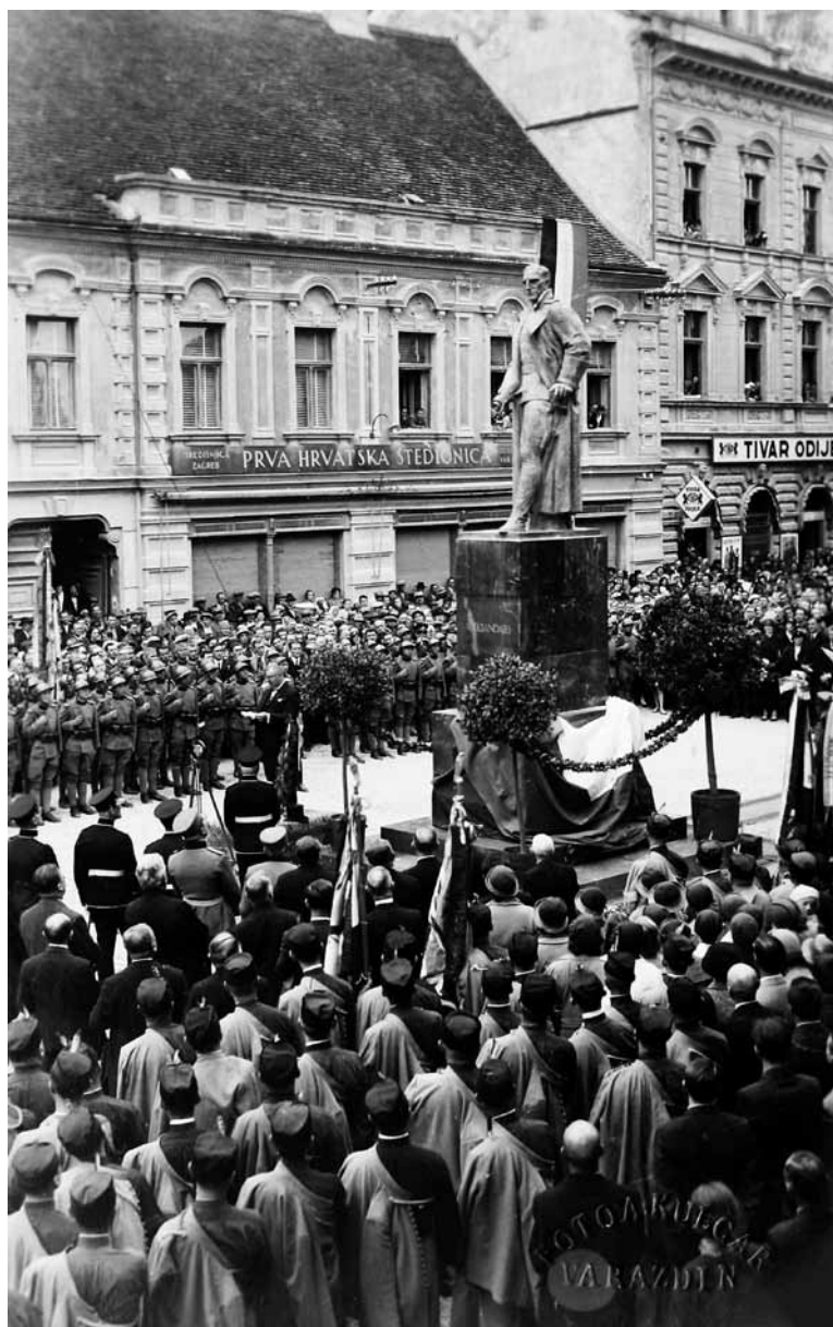
Fotografija 12. Trenutak nakon otkrivanja spomenika kralju Aleksandru (tamni ukrasni kamen) 81