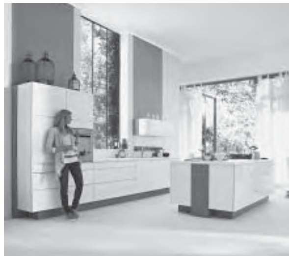
Slika 13. Jednostavnost i čistoća oblika: kuhinja Esprit ; proizvođač Alno

zacija je trend koji je odavno stigao u domove, osobito u kuhinje. Tijekovi rada mogu se optimizirati smislenim postavljanjem namještaja u prostoru, a rasvjeta je usmjerena na osvjetljavanje radne ploče i prostora za blagovanje. Kada su u pitanju električni uređaji ili tzv. bijela tehnika, energetska je učinkovitost glavna tema. Sve veći broj potrošača postaje svjestan potrebe očuvanja energije i vode, djelomice zato što je to korisno za novčanik, ali i zato što je korisno za okoliš. Energetski učinkoviti i tihi kuhinjski uređaji bit će norme sutrašnjice. Oblikovno, kuhinje se pomiču prema jednostavnome, skromnome i funkcionalnom dizajnu (sl. 13). Jednostavno znači elegantno i nenametljivo – vrsta stila koji nikad ne dosadi. Najnoviji trend u kuhinjskom prostoru jesu otvorene police i mnogo stakla na vratima ormarića, radnim površinama i zidnim pločicama. Live-in kuhinja najuvjerljiviji je dokaz da se različita područja kuće ujedinjuju, a očekivanja ljudi glede interijera mijenjaju se.