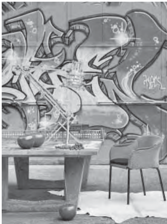
Slika 10. Jednostavne forme i kompleksno eksperimentalno razmišljanje, Transforming Perspectives