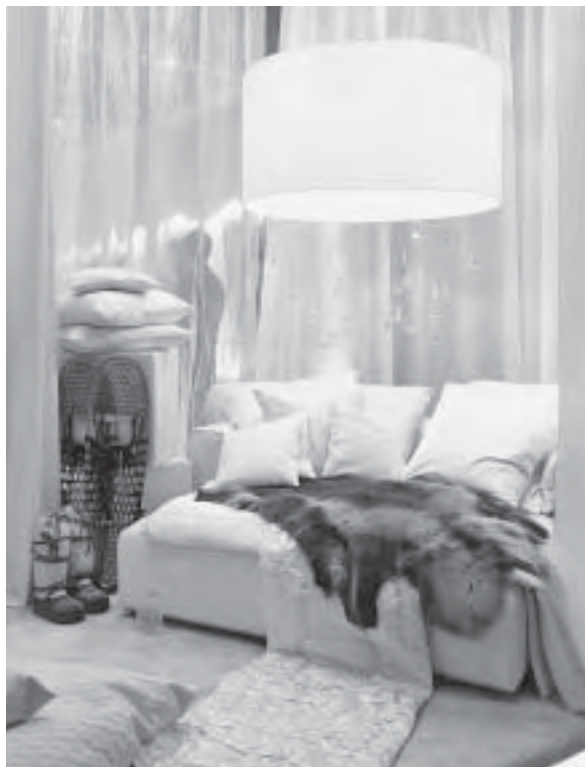
Slika 2. Ambijentalno opremljen interijer s pregrštom dekorativnih elemenata (rasvjeta, jastuci, zavjese, prekrivači...), pravi zimski ugođaj, imm cologne 2011.

Čvrste linije i “ukočene” vitrine definitivno su prošlost. Novi stil življenja, dinamičan i fleksibilan, zahtijeva i fleksibilna rješenja u opremanju interijera. Problem se rješava modularnim sustavima namještaja. Individualni elementi jednostavno se slažu jedni na druge, gradeći ormare i otvorene police, lako složive za potrebe preseljenja... (sl. 3).