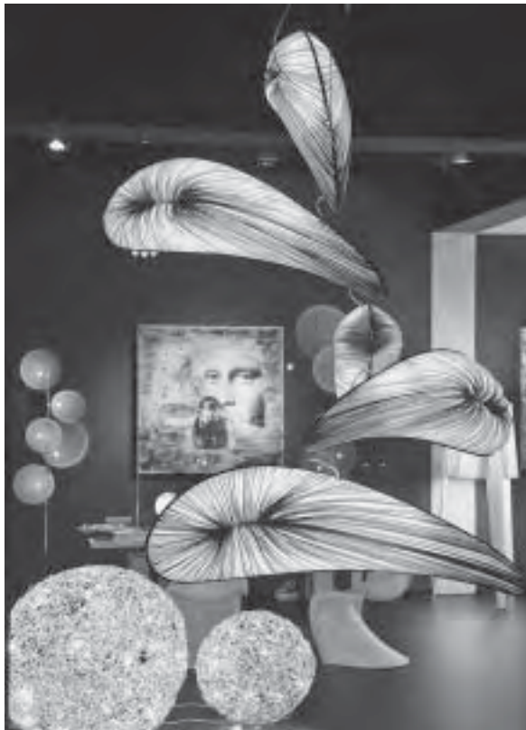
Slika 20. Lebdeći svjetleći elementi kao funkcija i dekoracija u prostoru, imm cologne 2011 .

predmeta. Svjetlo postaje integrirajući element, novi materijal u stvaranju nove dimenzije prostora (sl. 20).