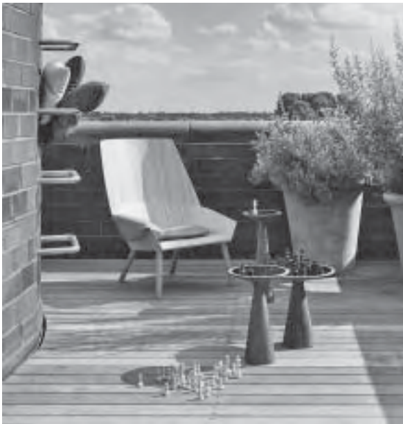
Slika 7. Toplina i emocije, Emotional Austerity