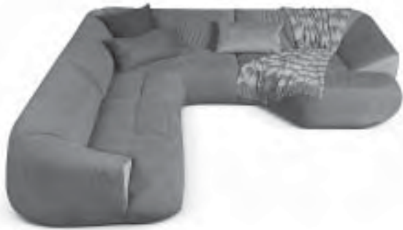
Slika 4. Ojastučena garnitura S-Tate: sve bliže podu; proizvođač Bretz