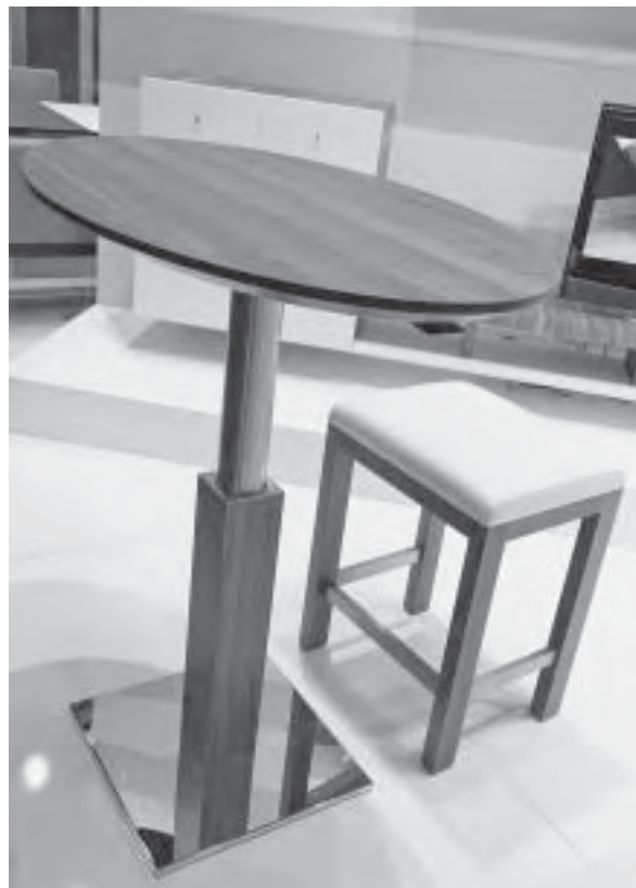
Slika 18. Tamna orahovina u kombinaciji s bijelom kožom i sjajnim metalom uvijek djeluje elegantno, makar je riječ i o jednostavnim proizvodima