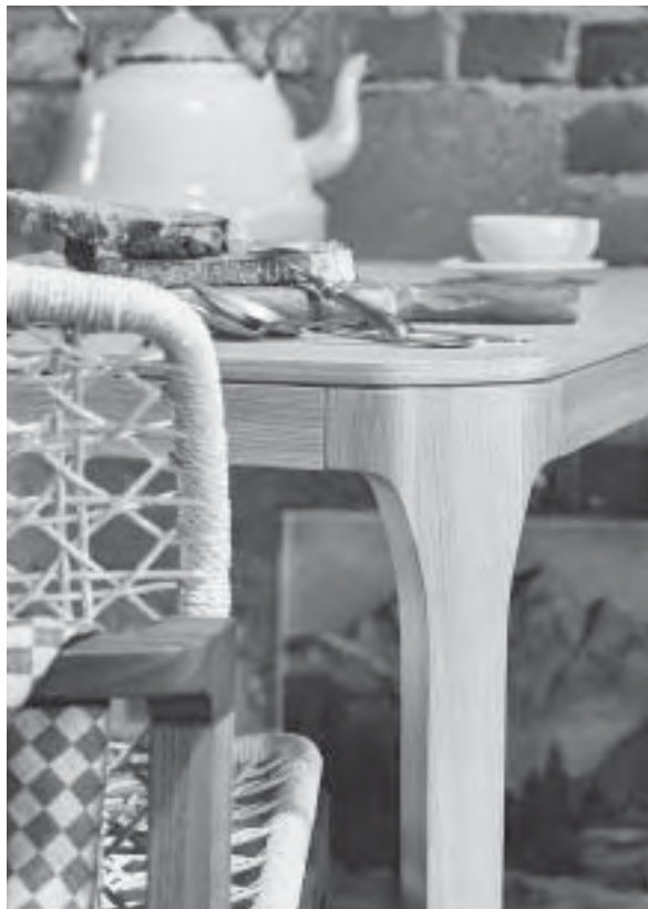
Slika 17. Hrast je ponovno hit: blagovaonički stol kao detalj trenda Emotional Austerity

međusobno kombiniraju stvarajući zanimljive igre na površinama. Orah će zadržati svoj važan status. On zrači dojmom vrijednosti i elegancije (sl. 18). Visokokvalitetna trešnja u osjetljivim, crvenkastim nijansama ima istaknutu ulogu. Upotreba domaćih vrsta drva postaje kupcima sve važnija. Svjetlije boje spektra i dalje podrazumijevaju bukvu, javor, jasen, johu i brezu.