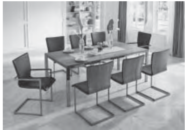
Slika 21. Elegancija i profinjenost blagovaoničkog namještaja u kombinaciji crne kože, metala i drva; proizvođač Koinor

U prostorima stana prevladava individualnost i umjerena decentnost bijele ili crne, s naglašenim detaljima drva. Prostori se povezuju u jedinstvene cjeline, nema jasno naznačenog prijelaza između npr. dnevnog boravka – blagovaonice – kuhinje. Kuhinje su samim time postale prošireni prostor i stilska poveznica