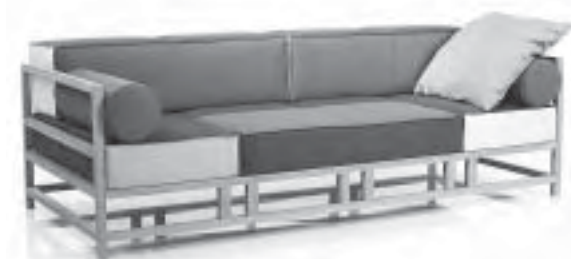
Slika 11. Jednostavnost koja opčinjava, Easy Pieces ; proizvođač Brühl

posjeta prijatelja koji dolaze podijeliti s vama ukusni obrok ili pogledati utakmicu život jednostavno nije potpun. A ako ćete toliko vremena provoditi kod kuće, želite mjesto koje je „dobro za dušu“.