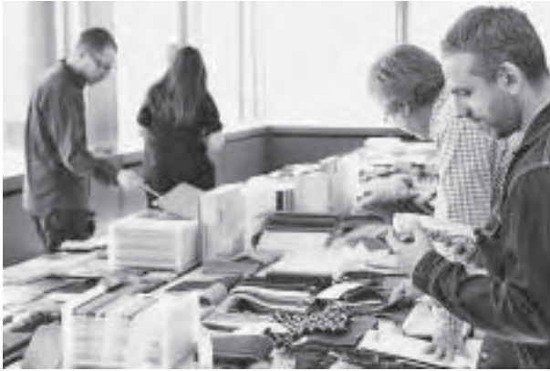
Slika 6. Detalj radionice The Interior Trends 2011 .