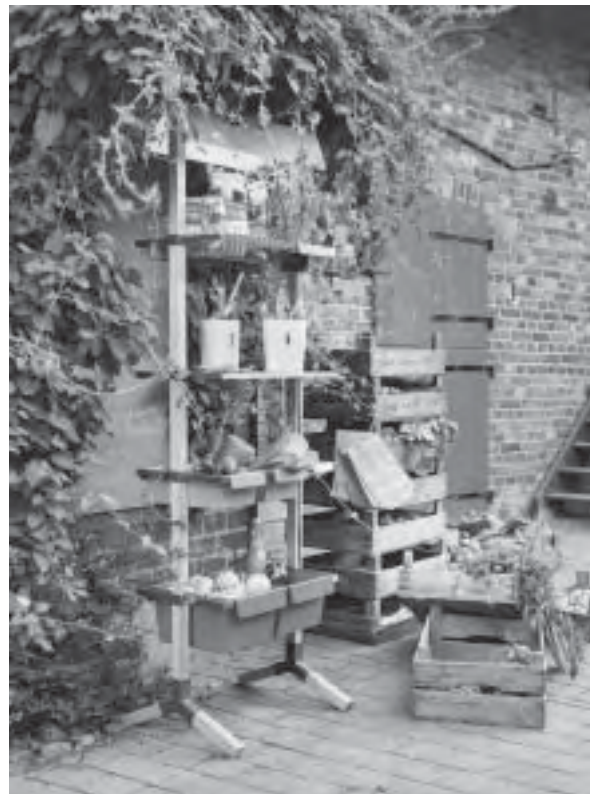
Slika 9. Spoj funkcionalnoga, jednostavnoga i autohtonoga, Re-balancing

Koji će trendovi prevladati u ovoj godini – pitanje je koje zanima svakog proizvođača, distributera i kupca. Vizionarski zadatak definiranja trendova nije nimalo jednostavan, ako se uzme u obzir brzina promjena na globalnom tržištu, zahtjevnost kupaca glede zadovoljavanja vlastitih navika, ukusa i potreba, kao i individualnost naglašena na svakom koraku. Novonastale vrijednosti u društvu, koje danas više ne možemo definirati isključivo kao trendove, ostavljaju prostora za nekolicinu različitih stilova, oblika i pojavnosti koje zbunjuju sve sudionike.