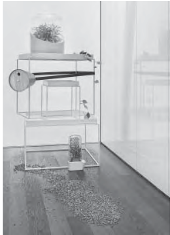
Slika 8. Nove tehnologije i materijali, Surprising Empathy