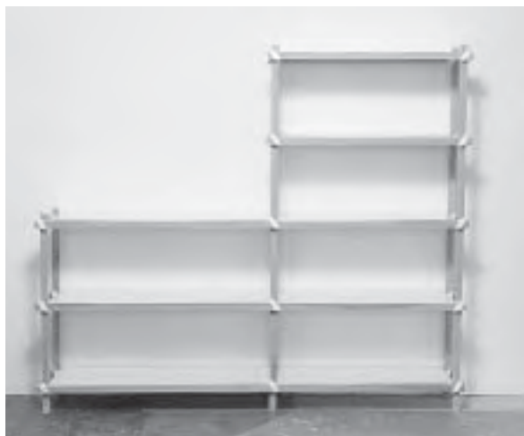
Slika 3. Jednostavnost i funkcija police Shrink ; dizajn Nicola Zocca, [D 3 ] Design talents, [D 3 ] Contest

Česta vanjska nepretencioznost i zatvorenost namještaja naglašava trend unutrašnjih vrijednosti, a