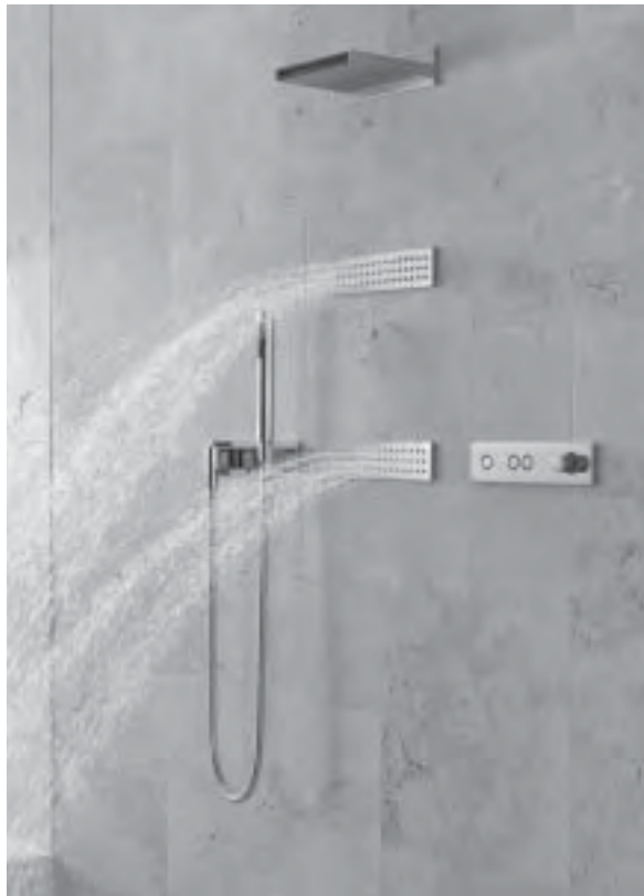
Slika 22. Elegancija i jednostavnost u kupaonici: sustav ATT; proizvođač Dorn Bracht

titi "individualno" u masovnoj serijskoj proizvodnji? Je li rješenje ipak u kompjutorskoj proizvodnji i savršeno izrađenim detaljima u ručnoj doradi?... Kolika je onda cijena takvog proizvoda? Za koji segment tržišta i ciljnu grupu treba proizvoditi? Uistinu, koliko su marketing, informacija, inovativnost i dizajn važni (strateški i filozofski) određenoj tvornici namještaja i njezinim rukovodnim kadrovima.