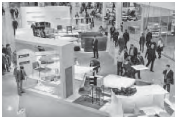
Slika 1. Atmosfera na imm cologneu 2011.

S obzirom na to da su ukusi različiti (i o njima se ne raspravlja), pojavljuje se problem kako zadovoljiti ukus. Odgovor je i ove godine bio u tzv. ambijentalnoj individualnosti.