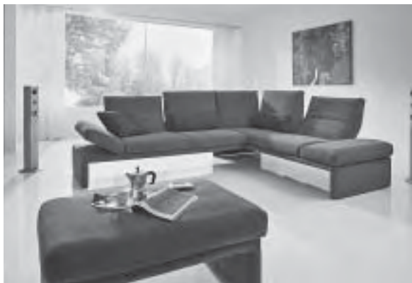
Slika 14. Crno je i dalje in: ojastučena garnitura tvrtke Koinor

Pruge, cvjetni uzorci, apstraktna grafika... u smislu uzoraka i tkanine za ojastučenja nude izuzetnu raznolikost. Mnoge su tkanine grubog tkanja ili reljefnih tekstura koje šalju neodoljiv poziv za sjedenje, ležanje