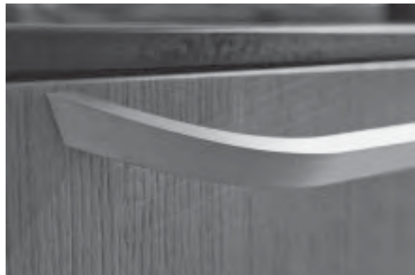
Slika 5. Visoka kvaliteta proizvoda izražena detaljima, green dizajn i održivost; detalj komode Rational ; proizvođač Cult

nezaobilazna kompjutorska i komunikacijska tehnologija integrirana je u unutrašnjost namještaja punu iznenađenja. Ključna je riječ funkcionalnost. Oblik proizvoda kupcu se može “svidati” ili ne, što ovisi o ukusu i životnoj filozofiji. No funkcionalnost čini određeni proizvod “nužnim” u kućanstvu. Uz funkcionalnost, osobito su traženi kvaliteta proizvoda, koja se očituje u cjelovitoj izradi i, poglavito, obradi detalja, te racionalan, ekološki ( green ) dizajn i trajnost primjenom odgovarajuće sirovine (sl. 5).