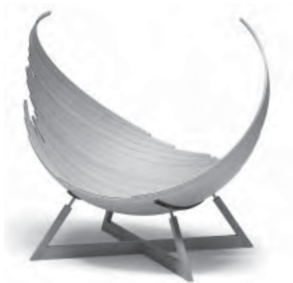
Slika 19. Drvo kao vječna inspiracija: neobična sjedalica Barca; proizvođač Conde House

Drvo je i dalje vječna inspiracija za neobične oblike, pri čemu je i te kako nužno poznavati svojstva pojedinih vrsta drva (sl. 19).