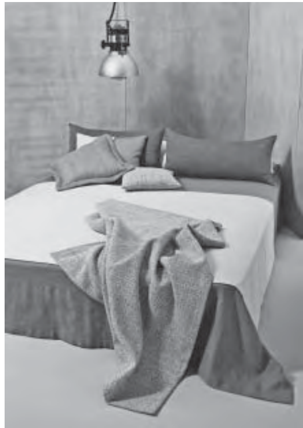
Slika 15. Tkanine za ojastučenja, ležajeve ili zavjese; proizvođač Nya-nordiska

i odmor. Zavjese nerijetko prate stil ojastučenja (sl. 15). Udobnost je i dalje vrlo važna.