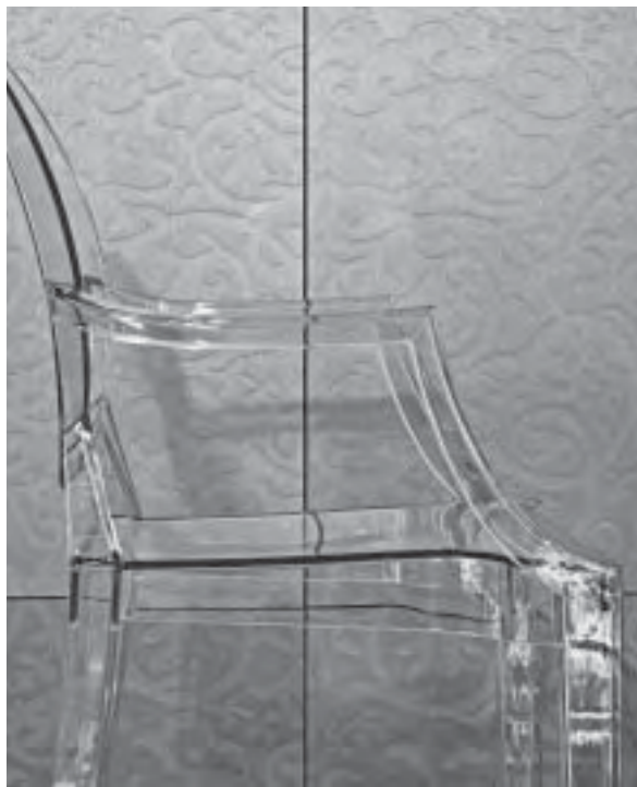
Slika 16. Tapete su ponovno u modi; proizvođač Nya-nordiska

međusobno kombiniraju stvarajući zanimljive igre na površinama. Orah će zadržati svoj važan status. On zrači dojmom vrijednosti i elegancije (sl. 18). Visokokvalitetna trešnja u osjetljivim, crvenkastim nijansama ima istaknutu ulogu. Upotreba domaćih vrsta drva postaje kupcima sve važnija. Svjetlije boje spektra i dalje podrazumijevaju bukvu, javor, jasen, johu i brezu.