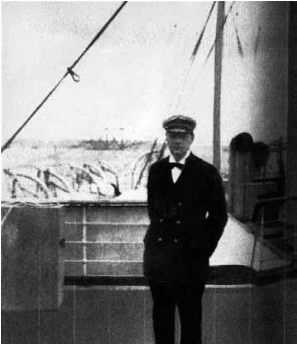
Churchill na admiralskoj jahti HMS Enchantress