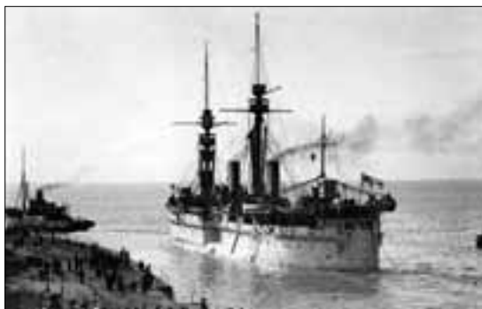
Kaiser, njemački admiralski brod