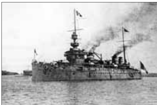
Victor Hugo, francuska oklopljena krstarica