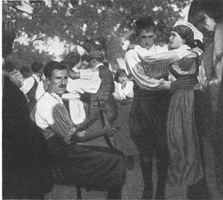
Ples uz pratnju lire. — Lisac (Ston).

uopće, pa se od takvih vremena po zakonu ustrajnosti ili bolje konservativnošću održavalo to i poslije kroz duga vremena, s manjim ili većim intenzitetom. Ni to, kada se vršilo ovo prenošenje i kulturna pozajmica, ne da se u ovaj čas pouzdano reći, ma da ima mogućnosti i nade, da će se potanjim studijem i tu doći do određenoga datuma. Prije bih bio sam sklon tvrdnji, da lira u nas na Jadranu nije iz velike davnine, možda tek od neko dvjesta godina unatrag. Potpora bi tome mogla da bude i činje-