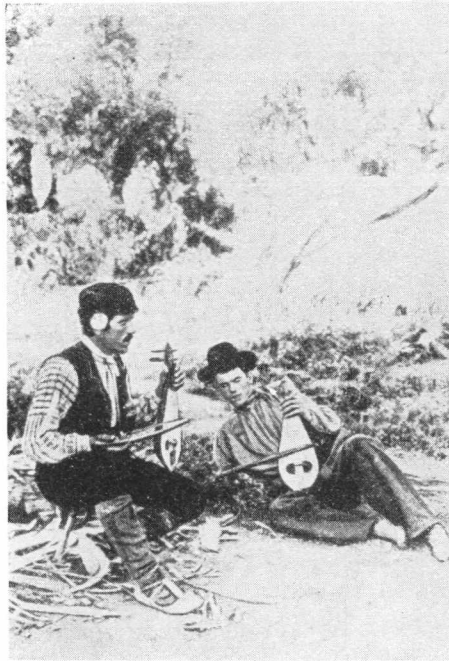
Svirači s lirama. — Bugari u Cogeali (Rumunjska). Joueurs de lyre. — Bulgares de Cogeali (Roumanie).

preživljuje i na Jadranu svoje davne pretke, koje su u Evropi inače svuda bez izuzetka već davno zamijenili novi razvijeni, savršeniji i izmijenjeni oblici — naša je lira — lijerica u pravom smislu dragocjena muzička »živa starina«, pažnje vrijedna ne samo sa naše strane, nego i sa podija opće evropske instrumentalistike i njezine historijske pozadine.