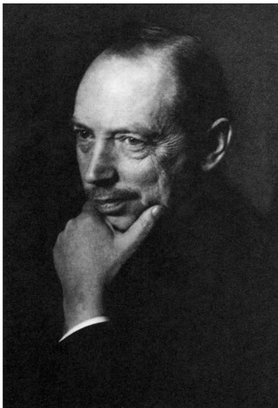
Friedrich Thimme (1868.—1938.)

Njemačka nije bila samo vojnički poražena, nego i politički desetkovana, a psihološki ponižena. U tom svjetlu je i pitanje odgovornosti za svjetski rat (tzv. Kriegsschuldfrage ), napose članak 231. Versailleskoga ugovora, kojim je — nakon naglašenoga francuskog inzistiranja — utvrđena njemačka krivica za njegovo izbijanje, postalo ne samo jedno od ključnih pitanja njemačke vanjske politike, nego i bitan čimbenik unutarnjega društvenog i ideološko-političkog raslojavanja. Njemačka je vlada zbog toga već u srpnju 1919. donijela odluku o pripremanju zbirke dokumenata koja bi rasvijetlila diplomatske i političke aktivnosti uoči Prvoga svjetskog rata. Prvotna vladina nakana, da objavi Bijelu knjigu koja je imala objasniti i opravdati ulogu Njemačkoga Reicha, zaslugom priređivača obuhvatila je ne samo izvorno planirano razdoblje od 1912. naovamo, nego se je protegla sve do vremena osnivanja Reicha, 1871. godine. Slijedom toga pretvorila se u impozantnu zbirku dokumenata o predratnoj politici, koja je pod naslovom Die grosse Politik der Europäischen Kabinette, 1871—1914. Sammlung der diplomatischen Akten des Auswärtigen Amtes im Auftrage des Auswärtigen Amtes ( Visoka politika europskih vlada 1871.—1914. Zbirka diplomatskih dokumenata Ministarstva vanjskih poslova, po ovlasti Ministarstva vanjskih poslova ) objavljena u Berlinu od 1922. do 1927. u 40 knjiga (od čega je čak dvanaest objavljeno u dva sveska). Zbirku su uredili Johannes Lepsius