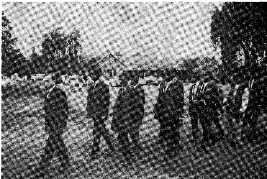
Študenti tehnologije mlijeka prigodom podjele diploma, u Egerton College-u.

»Mariakani Milk Sheme« je mljekarski projekt, u mjestu Mariakani, ostvaren od UNICEF-a s mljekarom, kapaciteta oko 30.000 litara/dan, oko 35 km udaljenom od Mombase na Indijskom Oceanu. Svrha projekta je bila razvijanje mljekarstva i nastava mljekarstva u tropskim uvjetima.