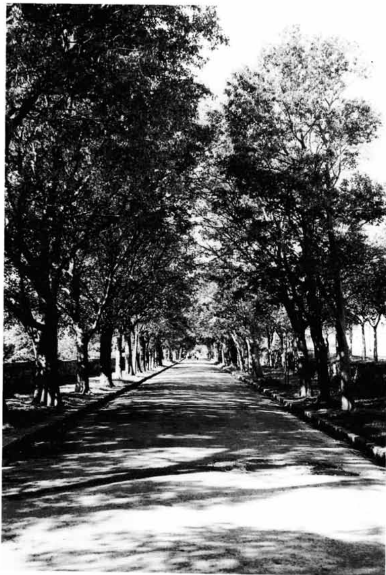
Sl. 2. Šetalište S. S. Kranjčevića (Alej) - pogled prema Velikim vratima (1996.).

namjenu. Ništa čudno, jer motorizacija u sučeljavanju s čovjekom gotovo uvijek odnosi pobjedu. Osim prvobitne namjere Šetališta, naknadna izgradnja Osnovne škole na njegovu početku trebala bi biti odlučna prevaga u potpunoj zabrani