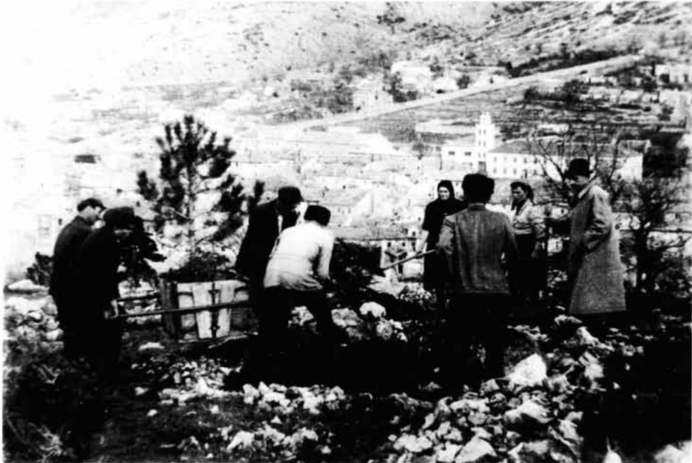
Sl. 3. Pošumljavanje Nehaja crnim borom u sanducima godine 1954.

detaljnije obraditi - snimiti sadašnje stanje vegetacije, kako bi se mogli planirati budući zahvati.