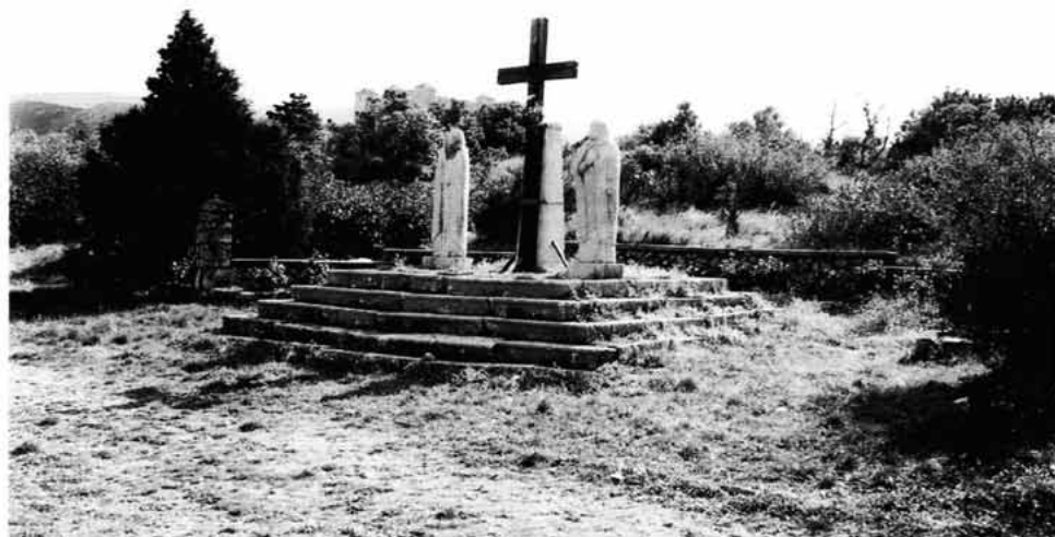
Sl. 5. Kalvarija na Nehaju.

provjeriti sve hidrante na vodovodnoj mreži da bi se moglo organizirati zalijevanje sadnica tijekom ljetnih mjeseci. U budućnosti trebalo bi nastaviti s kombiniranim radovima, i to na pošumljavanju, ponajprije neobraslih dijelova, te uzgojnim radnjama (čišćenje i njege) na postojećoj autohtonoj vegetaciji. U budućim radovima na Nehaju svakako bi trebalo obuhvatiti i uklanjanje mnogobrojnih hrpa materijala uz asfaltnu cestu Trbušnjak - kula Nehaj. Za navedene radove trebalo bi odrediti prioritet, a također bi se usporedno pristupilo selektivnom izboru radova prema Projektu 1981. godine. Razumljivo, radi se o krupnoj i dugoročnoj zadaći, a njezina dinamika svakako ovisi o raspoloživim sredstvima. S postupnim ostvarenjem navedenog sadržaja Nehaj će postati privlačniji za sve veći broj posjetitelja, čime će se razvijati njihova svijest o potrebi da se iskoriste njegovi kompleksni sadržaji.