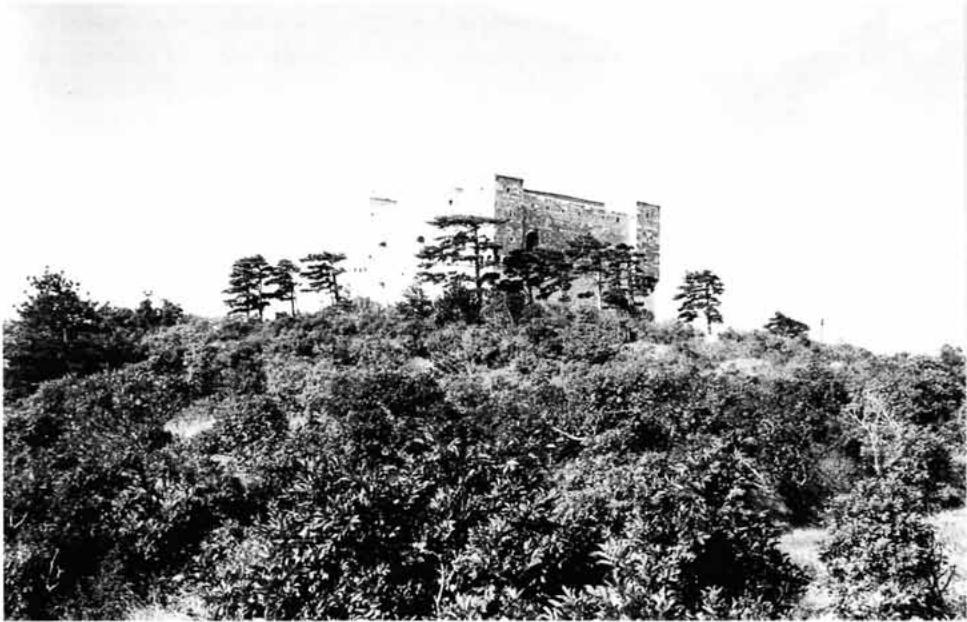
Sl. 4. Grupe crnog bora s autohtonom vegetacijom s južne i zapadne strane tvrđave Nehaj (snimio I. Stella, 1996.).

sudionici takvog sporazuma izdvajali bi na zajedničkom računu sredstva, dok bi radove obavljalo posebno specijalizirano poduzeće. Tom zahtjevu najbolje bi odgovarala Šumarija Senj, koja posjeduje potrebnu stručnost za izvršavanje gotovo svih vrsta radova zajedno s čuvanjem. U te radove svakako bi trebalo uključiti senjsko "Eko" društvo i ogranak "Lijepe naše". Godišnje planove i njihovo ostvarenje odobravali bi predstavnici sudionika. Ukoliko bi se ideja o financiranju Nehaja usvojila, pristupilo bi se potpisivanju ugovora pod pokroviteljstvom Gradskog poglavarstva.