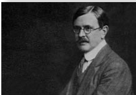
Robert W. Seton-Watson

Osvrćući se na međunarodnu krizu koju je izazvala aneksija Bosne i Hercegovine, Seton-Watson je ustvrdio da je ta nekadašnja otomanska pokrajina došla u »neopozivi posjed kuće Habsburg« te da je »težište južnoslavenskoga pitanja prešlo s Beograda na Zagreb, odnosno od Srba na Hrvate«. 24