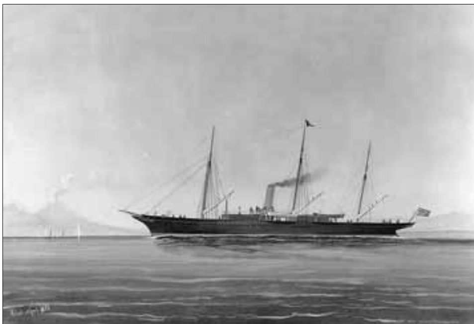
Posljednja jahta u vlasništvu nadvojvode Karla Stjepana bila je "Rovenska". Dvadesetih godina pod imenom "L'Elettra" i pod talijanskom zastavom postaje poznata po pokusima koje je na njoj izvodio znameniti fizičar Guglielmo Marconi.