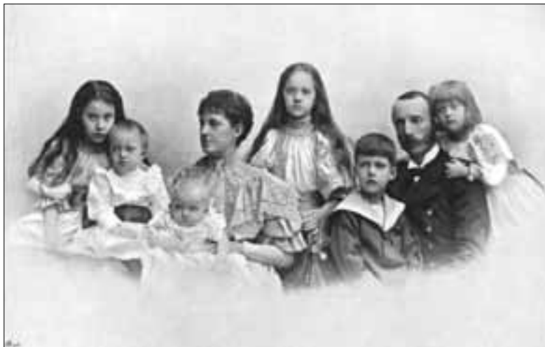
Obitelj austrijskog nadvojvode Karla Stjepana redovito je posjećivala Split i Dalmaciju.