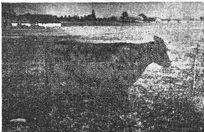
Crvena danska krava, osnovno mlekoproduktivno grlo

To je danski sir tipa rokfort. Ovo ime su mu dali Danci, u saglasnosti s jednom internacionalnom odredbom od god. 1951., po kojoj naziv »rokfort« mogu da nose samo odgovarajući sirevi izrađeni u Francuskoj. Zato svugde u drugim zemljama, gde se izrađuje ovaj tip sira, uvedena su nacionalna