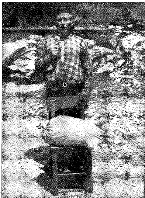
Sl. 2 - Mješinski sir iz Bosanskog Grahova. (Orig.)

Kao što se vidi iz ovih analiza, analizirani sirevi sadržavaju postotak masti koji odgovara \frac{3}{4} masnim sirevima. Nadalje se vidi da uzorak br. 1 ima odgovarajući sastav Ca i P, dok uzorak br. 2 ima nizak procenat ovih elemenata. Primjećuje se da su sirevi, od kojih su uzeti ovi uzorci, slabog kvaliteta, lošeg izgleda i ne vrijede kao tržna roba.