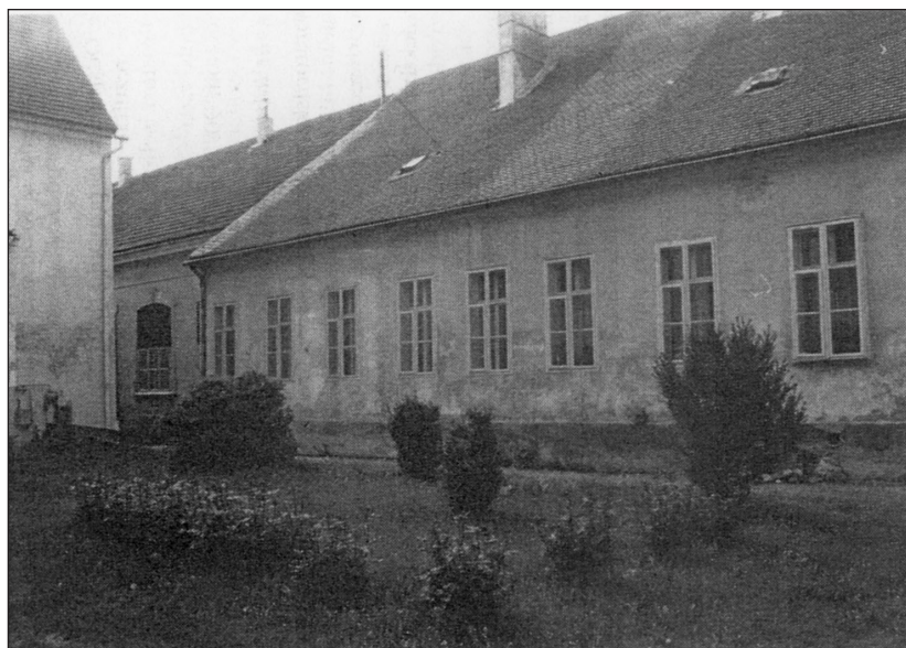
Slika 3 – Kemijski laboratorij Kraljevskoga gospodarskoga i šumarskoga učilišta u Križevcima, utemeljenoga 1860.

Radi promicanja gospodarstva Austrijska vlada je u Križevcima utemeljila Kraljevsko gospodarsko i šumarsko učilište s kemijskim laboratorijem tzv. Lučbarom (Učilište je otvoreno 19. studenoga 1860.). 27 Pored realnih škola, to Učilište je, sve do osnutka Kemijskoga zavoda na Sveučilištu (1876.), bilo jedina ustanova u Hrvatskoj za kemijska ispitivanja. Kemija je bila obvezni predmet višega odjela Učilišta, a eksperimentalna je nastava bila skromna. U laboratoriju su se obavljale analize tla, vode, ulja i uljarskih sirovina, mlijeka, krmiva, gnojiva i vina iz hrvatskih vinograda. Prvi profesori su bili Čeh Voitjeh Vávra (Hrusice, Češka, 1842. – Križevci, 1892.) i Hrvat Žiga pl. Šugh (Velika, 1841. – Križevci, 1911.). 28