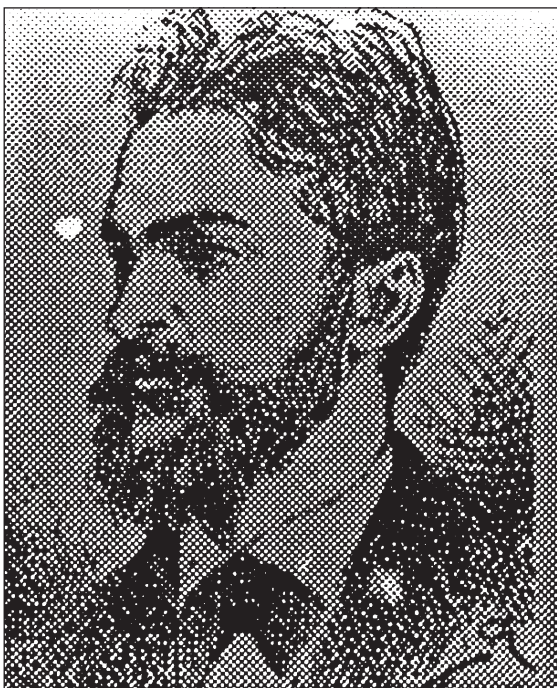
Slika 4 – Portret Aleksandra Veljkova (1847.–1878.), prvoga hrvatskoga sveučilišnoga profesora kemije