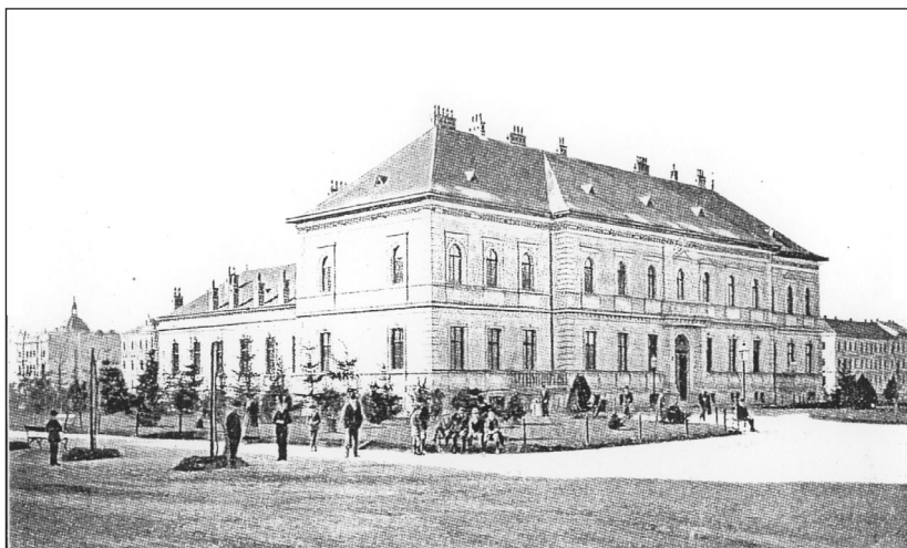
Slika 7 – Prvi sveučilišni kemijski Institut na Strossmayerovome trgu u Zagrebu Fig. 7 – The first University Chemical Institute on the Strossmayer Square in Zagreb