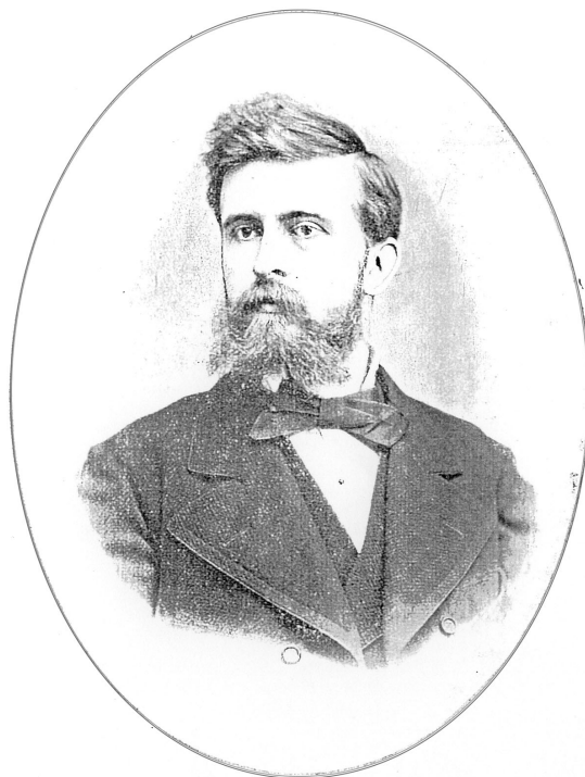
Slika 6 – Portret Gustava Janečka (1848.–1929.), drugoga hrvatskoga sveučilišnoga profesora kemije

za kemiju 19. stoljeća. Prvi profesor i osnivač prvoga sveučilišnoga kemijskoga laboratorija u prizemnici u Novoj Vesi broj 1 u Zagrebu, bio je Aleksandar Veljkov (Budimpešta, 6. svibnja 1847. – Budimpešta, 29. travnja 1878.). 24,31 Godinu dana bavio se organskom kemijom u laboratoriju kod Liebigova učenika A. W. von Hofmanna (1818.–1892.) u Berlinu, a doktorirao 1869. kod E. Ludwiga (1842.–1915.) u Beču. Prije dolaska u Zagreb (1875.) bio je docent na Politehnici u Budimpešti. U Zagrebu je pak djelovao samo dvije godine, jer se po dolasku razbolio od tuberkuloze i uskoro umro. Stoga je za novoga sveučilišnoga profesora kemije natjecajem 1879. izabran Čeh Gustav Janeček (Konopište, Češka, 30. studenoga 1848. – Zagreb, 8. rujna 1929.). 24,32-34 Studirao je farmaciju i kemiju u Pragu, a 1871. je diplomirao farmaciju. U Beču je 1875. doktorirao s disertacijom