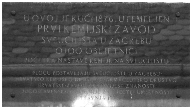
Slika 5 – Spomen-ploča na zgradi u Novoj Vesi broj 1 u Zagrebu, u kojoj je bio smješten prvi sveučilišni kemijski laboratorij u Hrvatskoj

Obnovom Sveučilišta (1874.) i utemeljenjem njegovih znanstvenih zavoda (1876.) započinje najvažnije razdoblje