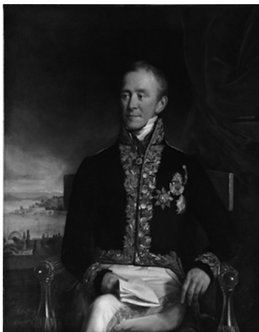
Ilustracija 6. Franz Schrotzberg Portret Franje Ksavera Ottenfels Gschwinda , Beč, 1837. godine Hrvatski povijesni muzej

Muškarac srednjih godina prikazan sjedeći u pozlaćenom naslonjaču, do ispod koljena, tijelo frontalno, glava četvrt ulijevo. Prosijeda kosa, oči zelenkasto sive, inkarnat lica blago rumen. Odjeven u veliku svečanu dvorsku odoru; 17 crni kaput izvezen zlatovezom, bijele hlače sa zlatnim egalizerima. Oko vrata na lentici Komanderski križ Reda sv. Stjepana, lijevo na grudima tri zvijezde odlikovanja: zvijezda turskog Ordena slave ( Nishan İftikar ), ispod njega lijevo zvijezda ruskog carskog Ordena bijelog orla, desno zvijezda Ordena Legije časti. 18 Lijeva ruka naslonjena o naslon stolice, u desnoj drži nekoliko listova papira. U pozadini desno zagasito crvena baršunasta zavjesa, lijevo se otvara pogled na Carigrad.