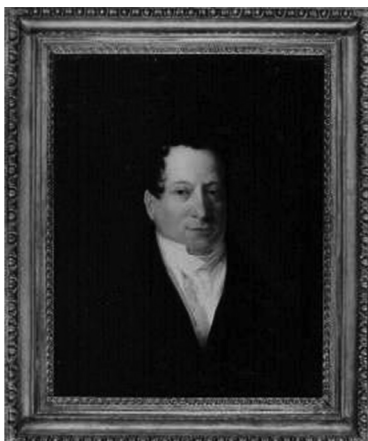
Ilustracija 7. Neutvrđeni autor Johann Gaudenz Gobert Salis Seewis

kom sigurnošću utvrđeno da prikazuje Johanna Gaudenza Goberta Salis Seewisa, švicarskog plemića, časnika i pjesnika, oca generala Ivana Ulricha Salis Seewisa. Osim rodoslovlja koje je pružilo prvo usmjerenje, pretpostavka je potvrđena pronalaženjem podataka na internetu. 24