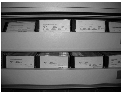
Slika 3: CD-i s digitaliziranim audiozapisima

Nakon što je CENKI iskazao interes za nabavu kopija relevantne građe, a IEF iskazao spremnost da izađe u susret, krenulo se u razmatranje mogućih modela suradnje koji bi bili od obostranog interesa. Naime znatan dio građe za koju je bio zainteresiran CENKI još nije bio digitaliziran pa je trebalo pronaći neko tehnički i financijski prihvatljivo rješenje za obje strane. Budući da su za audiograđu i videograđu bila potrebna dodatna sredstva radi njihove digitalizacije u profesionalnom studiju, u prvoj fazi projekta usmjerili smo se na onu građu koja se mogla digitalizirati uz minimalne troškove, u samom Institutu. Kako bi formalizirale suradnju, dvije su ustanove 2013. godine sklopile ugovor o suradnji u istraživanju, obradi i popularizaciji nematerijalne kulture na temelju kojeg se započelo s provođenjem suradničkog projekta digitalizacije istarske građe pohranjene u Odjelu dokumentacije IEF-a.