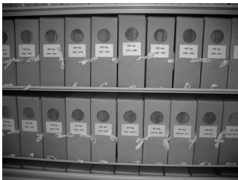
Slika 1: Rukopisni fond IEF-a

Institut za etnologiju i folkloristiku iz Zagreba ustanova je koja u svom Odjelu dokumentacije ima pohranjen respektabilan korpus građe etnografske i folklorne tematike prikupljene, među ostalim, i na području Istre, a koji se kao takav našao u središtu interesa CENKI-ja. Radi se ponajprije o onoj građi koju su prikupili djelatnici Instituta u okviru svog redovnog znanstvenoistraživačkog rada, ali i o građi koju su Institutu donirali vanjski suradnici i istraživači amateri te onoj koja je nabavljena kroz sustav razmjene s drugim srodnim znanstvenim i kulturnim ustanovama, poput Etnografskog muzeja u Zagrebu i Etnološkog odjela Hrvatske akademije znanosti i umjetnosti.