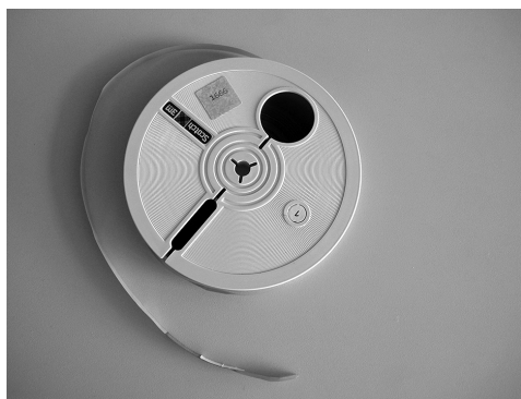
Slika 2: Magnetofonska vrpca

S digitalizacijom građe pohranjene u Dokumentaciji započelo se još 1997. godine, tada ponajprije u svrhu zaštite dragocjenih audiosnimki koje su počeli propadati što zbog starosti, a što zbog loših uvjeta pohrane, odnosno nedostatka adekvatnog skladišnog prostora. S vremenom se krenulo i u digitalizaciju ostalih arhivskih fondova, da bi se od 2011. započelo i planiranje te rad na razvoju institucijskog repozitorija ne samo u svrhu pohrane i obrade digitalne i digitalizirane građe već i radi omogućavanja lakšeg pristupa njezinim postojećim i potencijalnim korisnicima.