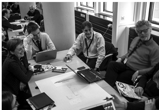
Slika 2. Europeana Cloud Kick-Off Meeting, 4. 3. 2013. Den Haag, Nizozemska