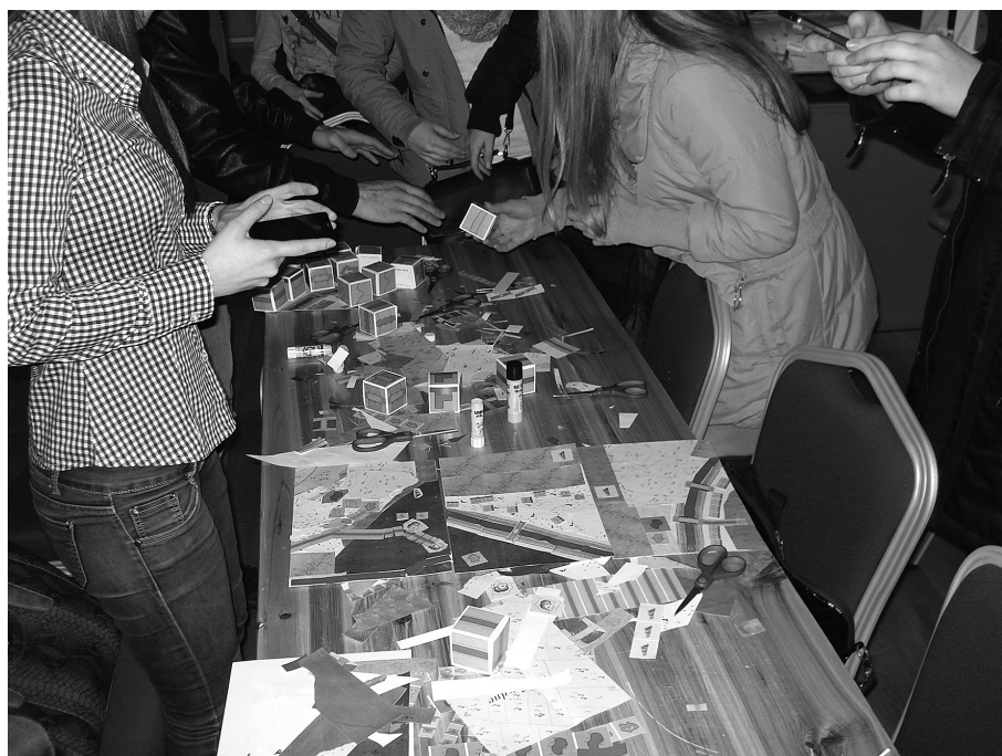
Fotografija 1. i Fotografija 2. Noć muzeja 2015. u Vukovaru, tematska kartografska radionica „Izradimo plan izmišljenog/stvarnog naselja upotrebom starih katastarskih simbola“