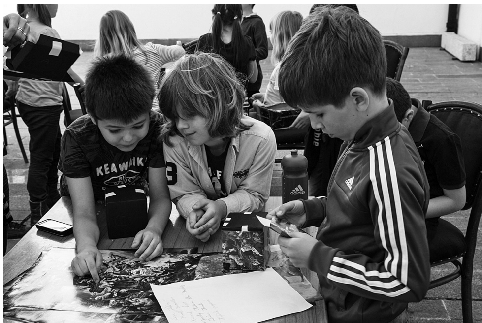
Fotografija 5. Aktivni sudionici radionice

Radionica je namijenjena prvenstveno najmlađima i njihovim obiteljima te polaznicima nižih razreda osnovne škole, budući da predstavlja brojne mitove, legende i istaknute događaje kojima obiluje hrvatska prošlost, a koji se donose uz vizualne prikaze historijskog slikarstva (legende o dolasku Hrvata, krunidbi kralja Tomislava, Zvonimirovoj kletvi, Crnoj kraljici, Veroniki Desiničkoj, Gričkoj vještiči...) i mnoge priče koje smo otrgnuli iz zaborava vremena kako bi ih i posjetitelji jednog dana mogli pričati drugima. Na posljetku u kreativnom dijelu, nadahnuti inspirativnim pričama iz prošlosti, sudionici uz pomoć kartona, škara i ljepila izrađuju kocke/slagalice koje nose naljepnice s motivima povijesnog slikarstva, a koje im ostaju za uspomenu.