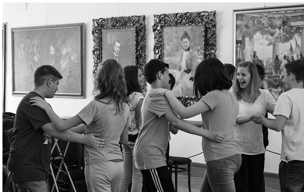
Fotografija 4. Sudionici radionice

Nakon kraćeg izlaganja na temu svakodnevice, društvenog života i odijevanja krajem 19. i početkom 20. stoljeća, slijede kreativni zadaci u kojima sudionici izrađuju cilindre i lepeze (po izboru), ali i uče plesati bečki valcer te pravila damskog i kavalirskog ponašanja. Iako je ponekad pravi izazov uspješno nagovoriti sudionike da odaberu svoje plesne partnere, u konačnici mnogi uspijevaju svladati svoje (često i prve) korake bečkog valcera, i to na najbolji način – kroz druženje, smijeh i igru – te naposljetku uspješno usvajaju znanje koje će im, vjerujemo, koristiti cijeli život!