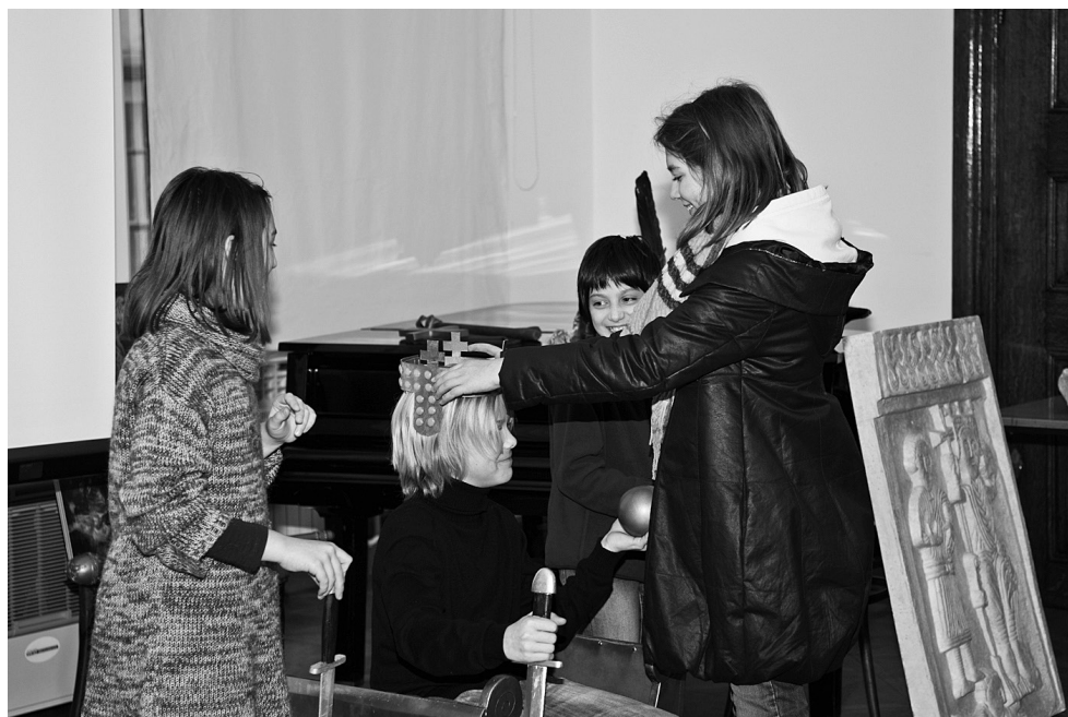
Fotografija 1. Radionica „Iz prošlosti domovine Hrvatske“

Na ovom ćemo mjestu ukratko pobrojati radionice i istaknuti njihove posebnosti te korištene metode.