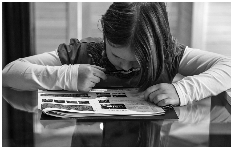
Fotografija 3. Sudionica radionice

Na primjeru kasnorenesansnog brodoloma kod otočica Gnalića i izronjenih predmeta sudionici uče o svakodnevnom životu s kraja 16. st., putovima pomoraca i trgovaca te opremi broda i teretu namijenjenom prodaji i razmjeni robe između Istoka i Zapada. U kreativnom dijelu sudionici rješavaju i izvršavaju radne zadatke (potraga za predmetima, njihovo sastavljanje i sortiranje, vezanje mornarskih čvorova te izrada igračaka i ukrasa uz pomoć predmeta sličnih originalima). Zanimljivo je da se tom radionicom pruža i mnoštvo informacija o podvodnoj arheologiji.