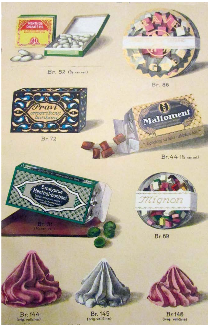
Slika 5. Reklama za Rave šećeriće. Publikacija Rave proizvoda 1924., vlasništvo obitelji Rac dinara, a i sljedeća će godina rezultirati dobrim poslovnim uspjehom. Tome