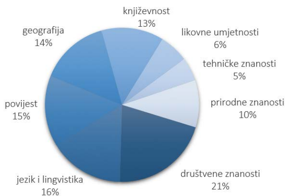
Slika 1. Zastupljenost područja u sadržaju HE-a (prema broju redaka)

Članci cjelokupne enciklopedije podijeljeni su u 79 struka raspoređenih u sljedeća područja: jezik i lingvistika, geografija, društvene znanosti, likovne umjetnosti, tehničke znanosti, prirodne znanosti, povijest i književnost, čija je zastupljenost prikazana na slici 1.