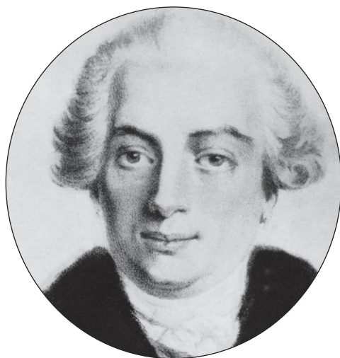
Slika 1. Claude Bourgelat (1712.–1779.), osnivač prve veterinarske škole u Lyonu 1762.

Veterinarstvo se kao profesija prvi put javlja u kulturama starog vijeka, dakle u vrijeme kada su životinje domesticirane, a stočarstvo postalo važna privredna grana. Prema sačuvanim izvorima, najstarije ustanove u kojima su se obučavali mladi ljudi za veterinarski poziv bile su u hramovima najvećih egipatskih gradova 4000 g. pr. Kr. [1]. Te su ustanove imale više karakter obrta nego škola. Prve veterinarske škole osnivaju se, međutim, puno kasnije, odnosno tek u XVIII. stoljeću [2]. Najznačajniju je ulogu u tom smislu imala Francuska, kao najrazvijenija europska zemlja u kojoj se u novonastalom građanskom društvu snažno razvijala industrija koja je uvjetovala, prvi put u povijesti, velik uvoz stoke iz drugih europskih i prekontinentalnih zemalja. Kao posljedica takva miješanja stoke nastaje nezapamćeno širenje epizootija, među kojima je bilo i smrtonosnih zoonoza. Kako su do tog vremena stoku liječili u najvećoj mjeri laici i nadriveterinari, nametnula se potreba za stvaranjem školovanih veterinara, odnosno za osnivanjem veterinarskih škola koje bi obrazovale stručan veterinarski kadar koji bi se mogao suprotstaviti novonastalim problemima.