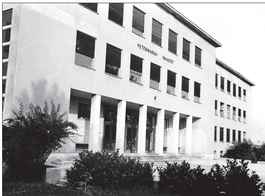
Slika 5. Veterinarski fakultet u Heinzlovoj ulici u Zagrebu