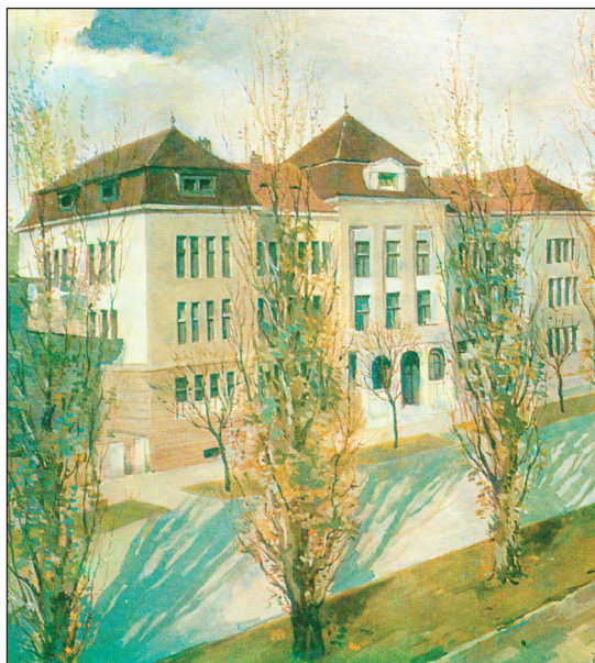
Slika 4. Veterinarska škola u Savskoj cesti u Zagrebu

Figure 3 Eugen Podaubsky (1869-1935), the founder of the School of Veterinary Medicine in Zagreb in 1919