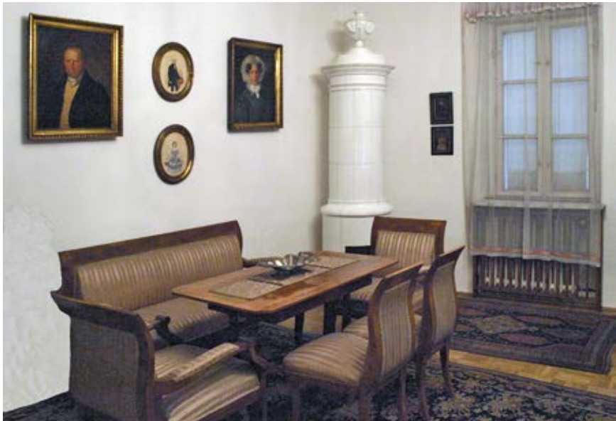
Memorijalna soba posvećena Semmelweisu u njegovoj rodnoj kući u Budimpešti, danas Povijesno-medicinskom muzeju nazvanom njegovim imenom. Semmelweis Memorial Room in his hometown Budapest, today the Medical History Museum named after him.