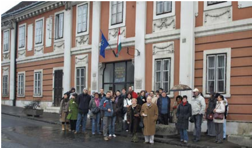
Studenti Medicinskog fakulteta Rijeka i članovi Hrvatskoga znanstvenog društva za povijest zdravstvene kulture pred Semelweisovim povijesno-medicinskim muzejom u Budimpešti 2008. The students of the Faculty of Medicine, University of Rijeka and the members of the Croatian Scientific Society for the History of Health Culture in front of the Semmelweis Museum of Medical History in Budapest, 2008.